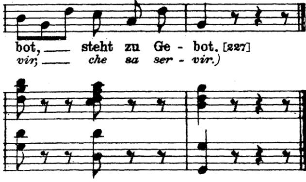
Şekil 33. Ölçü: 98, 99