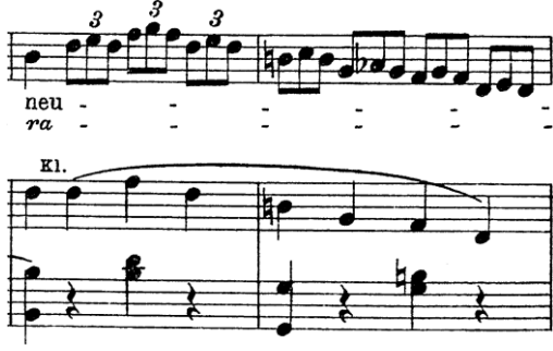
Şekil 24. Ölçü: 94, 95