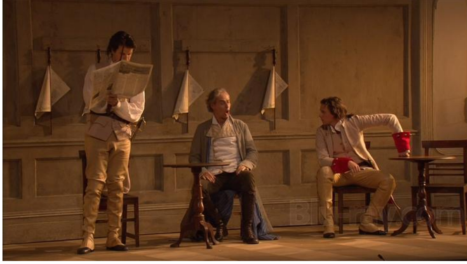
Görsel 4. Cosi Fan Tutte Operasının Açılış Sahnesi