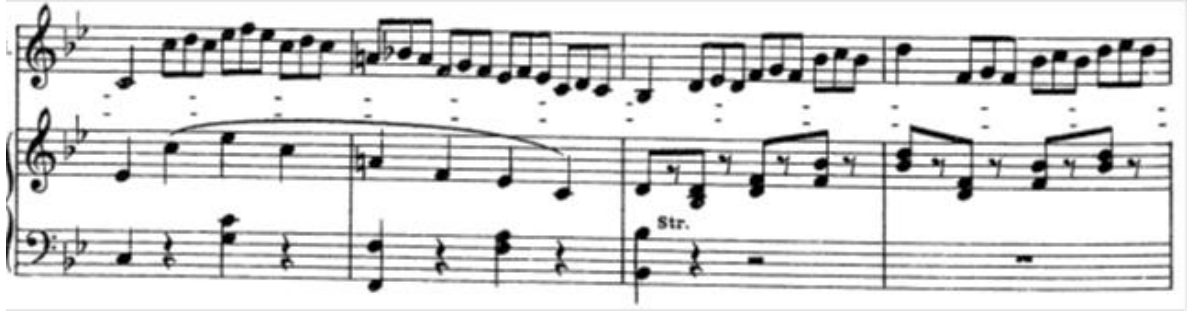
Şekil 25. Ölçü: 96, 97, 98, 99

Eserin bu bölümdeki majör geçişleri Fiordiligi karakterinin librettoyla uyan ifadesini son derece güçlendirmektedir.