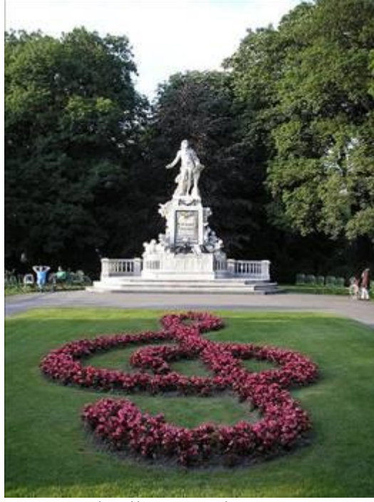
Görsel 2. Yoksullar Mezarlığı Mozart Anıtı