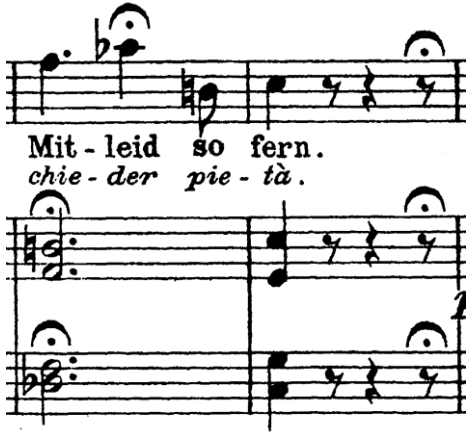
Şekil 16. Ölçü: 57, 58

Aryanın ikinci doruk noktası elli yedinci ölçüde kendini gösterir. Despina buraya kadar olan bölümde, erkeklerin yalancı gözyaşları, sahte bakışlar, büyüleyici kelimeler ile kadınları kandırdıklarını Fiordiligi ve Dorabella'ya anlatıyor. Bu davranışın erkeklerin genel karakteri olduğunu; onların erkekler için bir eğlence gibi görüldüğünü, kadınları reddetmenin, sevgilerini inkâr etmenin ve merhamet için yalvarmalarının değersiz olduğunu anlatıyor. Söz konusu bu uzatma notasını, “merhamet istemek” düşüncesinin üstünde durarak, Fiordiligi ve Dorabella'yı en güçsüz oldukları duygusal yönlerinden vuruyor.