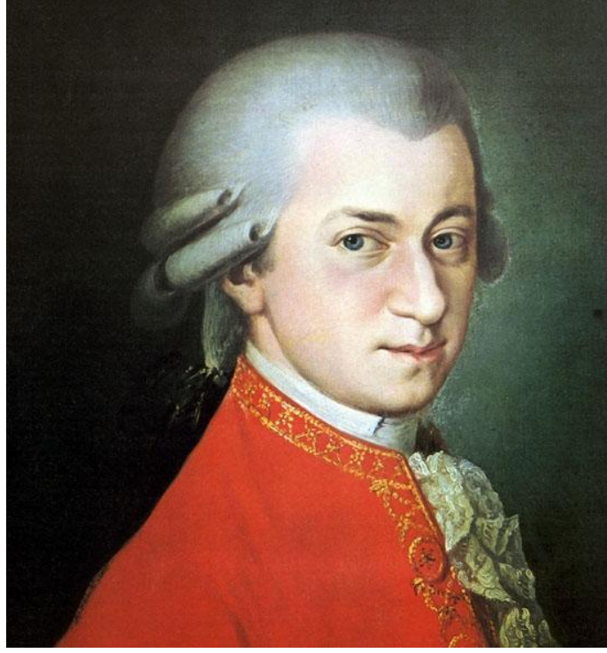
Görsel 1. Wolfgang Amadeus Mozart