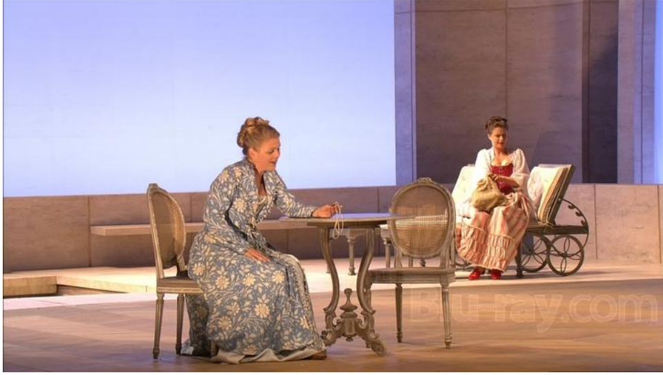
Görsel 5. Genç Kızların Sevgililerine Olan Aşklarını Anlattıkları Sahne