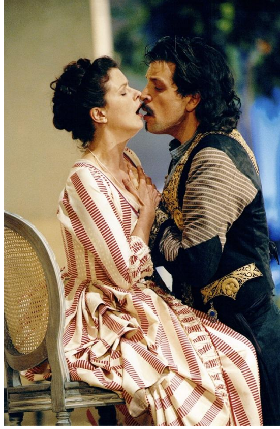
Görsel 8. Dorabella'nın Guglielmo İle Aşk Düeti