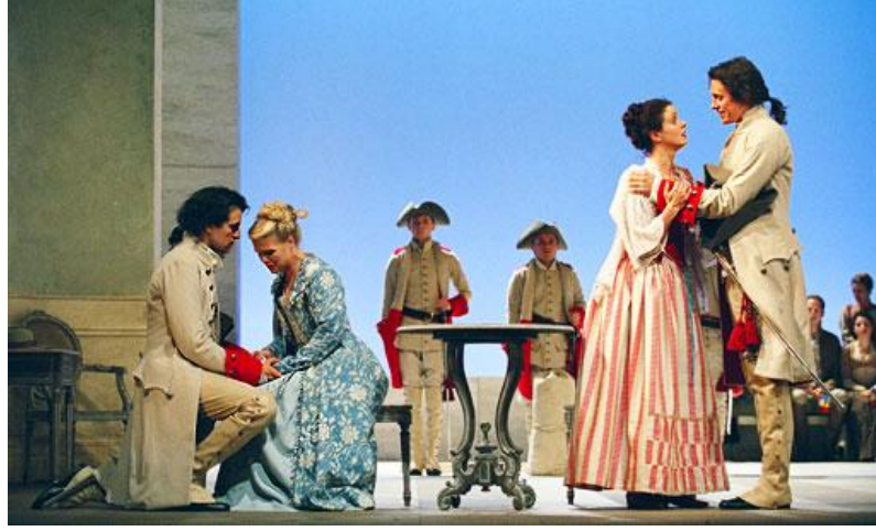
Görsel 9. Delikanlıların subay kılığında gerçek kimlikleriyle döndükleri sahne

Kızların evinde düğün hazırlığı yapılmaktadır. Bir tarafta yeni nişanlılar, diğer tarafta Don Alfonso ile bu kez noter kılığında girmiş olan Despina bu mutlu olayı kutlamak üzere toplanmışlardır. Tam bu sırada dışardan askerlerin marşı duyulur. Don Alfonso sözde telaşla pencereye koşarak bağırır. Delikanlılar hemen dışarı fırlayarak az sonra sanki kıtalarının başından dönmüş gibi, subay kılığıyla tekrar içeri girerler.