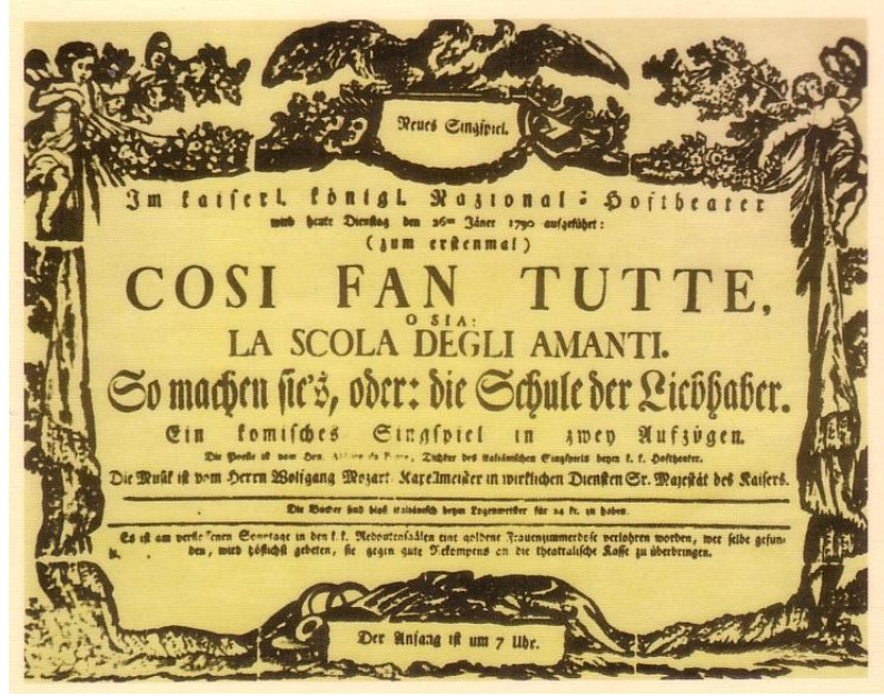
Görsel 3. Cosi Fan Tutte (İlk Afiş)