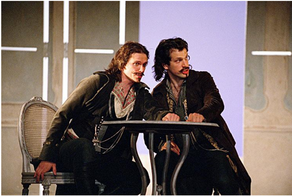
Görsel 7. Gençlerin kız kardeşleri beklediği sahne

Kızların evindeki bir oda da Despina'nın, on beş yaşına gelmiş kızların erkekleri çekmeyi bilmelerinin gerekliliğinden bahseden aryası duyulur. İki genç kız Despina'nın bu aryasını dikkatle dinlemektedirler. Sevgililerinin yerini yeni tanıştıkları yabancıların almasına çok az kalmıştır. Don Alfonso gelerek yeni sevgililerinin onları kıyıda beklediğini haber verir.