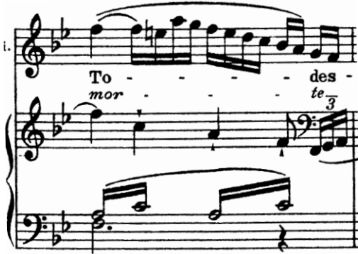
Şekil 21. Ölçü: 36

Otuz altıncı ölçüde fa möjör tonunda yapılan kromatik inişler, bu notalara ait "morte" (ölüm) ifadesini kuvvetlendirmiştir.