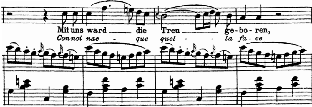
Şekil 20. Ölçü: 24, 25, 26, 27

dominantı olan Fa majöre geçerek, Fiordiligi'nin kolyesinin içindeki resim Guglielmo'yu gösterirken "O" yüzün hayatını aydınlattığını vurgulamaktadır.