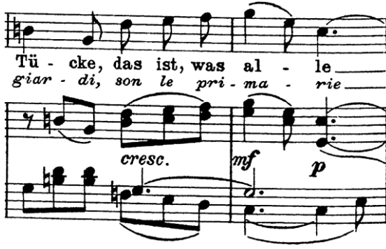
Şekil 15. Ölçü: 40,41

Aryanın ikinci doruk noktası elli yedinci ölçüde kendini gösterir. Despina buraya kadar olan bölümde, erkeklerin yalancı gözyaşları, sahte bakışlar, büyüleyici kelimeler ile kadınları kandırdıklarını Fiordiligi ve Dorabella'ya anlatıyor. Bu davranışın erkeklerin genel karakteri olduğunu; onların erkekler için bir eğlence gibi görüldüğünü, kadınları reddetmenin, sevgilerini inkâr etmenin ve merhamet için yalvarmalarının değersiz olduğunu anlatıyor. Söz konusu bu uzatma notasını, “merhamet istemek” düşüncesinin üstünde durarak, Fiordiligi ve Dorabella'yı en güçsüz oldukları duygusal yönlerinden vuruyor.