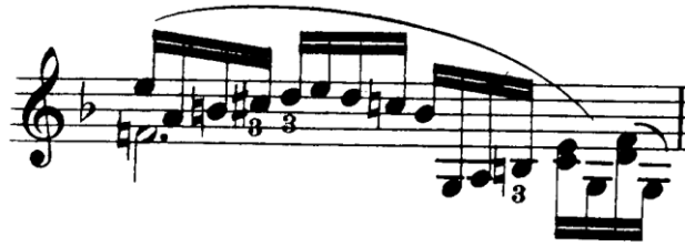
Şekil 4.45. Pierre Rode 24 Kapris, 23. Kapris, 21. Ölçü (F.David.1895 s.48)

Kaprıste en büyük zorluk sađ elde bađlı cümle yapısını bozmadan çift ses melodiyi çalabilmektir. Bu zorluđu bize en çok hatırlatan pasaj 21 numaralı ölçüdür. Bu ölçüde tek bir yay hareketinde hareketli yapının üst partiden alt partiye geçişini görmekteyiz.