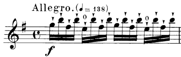
Şekil 4.7. Pierre Rode 24 Kapris, 4. Kapris, 2. Kesit, 1. Ölçü (David, 1895, s.8)

İkinci kesit detache onaltılık notalar ile başlar. Hızlı temposu ve onaltılık nota kalıpları nedeniyle sol el artikülasyon çalışması için uygundur. Kesit özellikle sol elde üçüncü ve dördüncü parmakları çalıştırmayı hedeflemektedir. Bu kesitte triller, aksanlar ve çift sesler kullanılmıştır. “Kesit Feridun Büyükkaksoy tarafından “Keman Öğretiminde İlkeler ve Yöntemler” adlı kitapta detache yay çalışması olarak önerilmiştir” (Büyükkaksoy, 1997, s.46) .