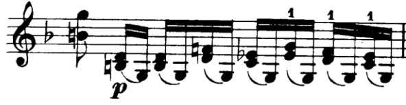
Şekil 4.44. Pierre Rode 24 Kapris, 23. Kapris, 24. Ölçü (F.David.1895 s.48)

Kaprıste en büyük zorluk sađ elde bađlı cümle yapısını bozmadan çift ses melodiyi çalabilmektir. Bu zorluđu bize en çok hatırlatan pasaj 21 numaralı ölçüdür. Bu ölçüde tek bir yay hareketinde hareketli yapının üst partiden alt partiye geçişini görmekteyiz.