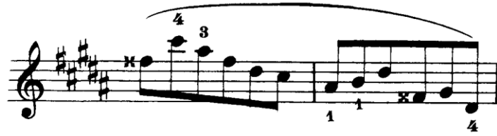
Şekil 4.18. Pierre Rode 24 Kapris, 12. Kapris, 5-6. Ölçüler (David, 1895, s.24).

Kapris 4. parmağı sürekli tel üzerinde hazır bulundurmayı gerektirecek şekilde yazılmıştır aynı zamanda 4 parmağın da tel üzerinde eşit şekilde çalışabilmesine olanak sağlayacak bu el pozisyonunun benimsenmesi ve geliştirilmesi için uygun bir egzersizdir. 4. parmak bulunduğu pozisyondan bir sonraki pozisyondaki ilk notaya uzanabilir. Sol elin sabit kaldığı ancak 4. parmağın komşu pozisyona uzandığı bu duruma parmak uzatma tekniği denir. Bu teknik sol elin zor pasajlardaki işlevini kolaylaştırır. Bu kaprıste hem 4. parmakta hem de diğer parmaklarda bu teknik kullanılmıştır.