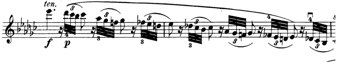
Şekil 4.24. Pierre Rode 24 Kapris, 14. Kapris, 1. Kesit, 11-12. Ölçüler (David, 1895, s.28)

Caprices” adlı makalesinde 14 numaralı kaprisin kasvetli bir başlangıç ile başladığından bahsetmektedir. İlk kesit forteden piano ya geniş bir nüans aralığında yazılmıştır. Alex Strauss bu kesitteki kasvetli matem havasının oluşması için forzandoların etkili kullanılması gerektiğini belirtmektedir (http-1). Bu kesitteki forzandolar vibrato ve sağ el basınç birlikteliği ile çalınmalıdır. İlk kesitte tele bitişik tek bir yay hareketinde 24 notanın olduğu 11. ve 12. ölçüyü içeren pasaj sağ el açısından oldukça zordur.