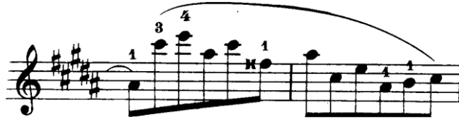
Şekil 4.19. Pierre Rode 24 Kapris, 12. Kapris, 10-11. Ölçüler (David, 1895, s.24)

Örneğin yukarıdaki ilk ölçü (12. Kapris, 5. Ölçü) 1. parmaktan sonra gelen 4. parmağın ileri pozisyona uzatılması ile çalınmaktadır. Genellikle el pozisyonumuz yuvarlak ve sapa paralel olduğu için 4. parmağı uzatacağımız zaman 4. parmağı düz bir şekilde ileri açarak parmağın etli kısmı ile basabiliriz. Bu teknikte parmak diplerindeki elastikiyeti kaybetmeden parmaklarımızı açarak hızlı pasajlarda daha rahat ederiz.