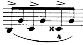
Şekil 4.16. Pierre Rode 24 Kapris, 12. Kapris, 7. Ölçüler (David.1895 s.24)

Hızlı temposu nedeni ile 6 bağlı ölçüler yayın ortasında yarım yay uzunluğunda düşünülmelidir. Ancak bu durum bir sonraki, bir önceki bağlı nota sayısına ve nüansa göre değişiklik gösterebilir.