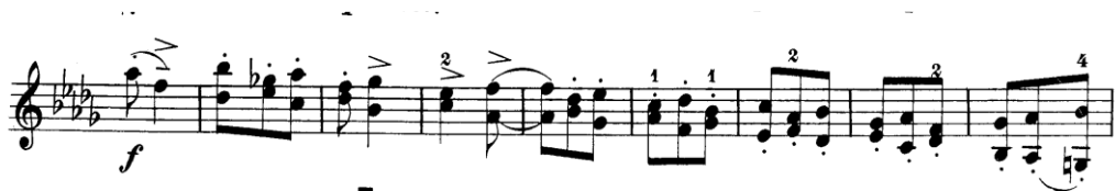
Şekil 4.25. Pierre Rode 24 Kapris, 15. Kapris, 99-107 Ölçüler (David, 1895, s.31)

Kapristeki 99 ve 107 numaralı ölçüler arasında yer alan pasaj tamamen çift seslerden oluşmaktadır.