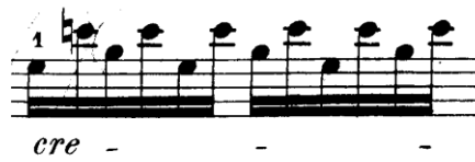
Şekil 4.5. Pierre Rode 24 Kapris, 2. Kapris, 6. Ölçü (David, 1895, s.4)

Kapristeki tekniklerin pekiştirilmesi için tamamlayıcı egzersiz olarak kaprisin eş zamanlı Dont (Op. 35) Etüt ve Kapris no:5-20, Fiorillo 36 Etüt no:8, Gavines 24 Etüt no:22, Kreutzer 42 Etüt no:6-16 ile çalışılması faydalı olacaktır.