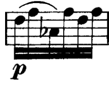
Şekil 4.39. Pierre Rode 24 Kapris, 22. Kapris, 110. Ölçü (F.David.1895 s.47).