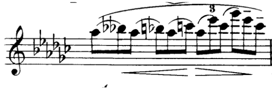
Şekil 4.22. Pierre Rode 24 Kapris, 13. Kapris, 15. Ölçü (David, 1895, s.26)

Rode'un bütün kapislerinde yazdığı nüans çeşitliliği bu kaprıste de kendini göstermektedir. Ancak genellikle uzun yayların kullanıldığı bu eserde yayın hızına ve basıncına dikkat edilmesi gerekir. Örneğin crescendo ve decrescendo nüansların olduğu bağılı yapılarda yayın hızı önemlidir. Crescendoda yayın hızını arttırmak decrescendoda ise azaltmak yay organizasyonunu doğru şekillendirmeye katkı sağlar. Yay aynı hız ve basınçta kullanılır ise nüanslar elde edilemez. Aşağıdaki ölçüler bu yay tekniğinin kullanılması için örnek pasajlardır.