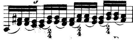
Şekil 4.9. Pierre Rode 24 Kapris, 5. Kapris, 65. Ölçü (David, 1895, s.2)

Kapriste genel olarak bir gam çalışmasında yer alan çıkıcı-inici gam, arpej ve çift sesler harmanlanmış biçimde karşımıza çıkmaktadır. Kapriste adeta gam çalışmasının önemi vurgulanmıştır. Beş numaralı bu kapris (barındırdığı çeşitli teknikler ve geniş nüans aralığı ile) Rode'un kaprislerinde kullandığı teknik ve müzikal yazım tarzının önemli örneklerinden biridir.