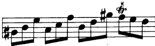
Şekil 4.2. Pierre Rode 24 Kapris, 2. Kapris 2. Kesit 17. Ölçü (David.1895 s.2)