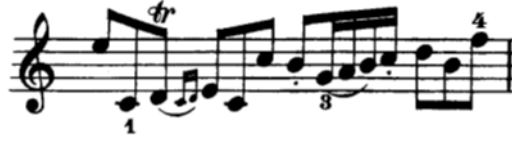
Şekil 4.3. Pierre Rode 24 Kapris, 2. Kapris 2. Kesit 24. Ölçü (David.1895 s.3)

Yukarıda belirtildiği üzere cantabile kelimesi “şarkı söyler gibi” anlamına gelmektedir. Cantabile başlığı altında yazılan eserlerde besteciler, yorumcuların şarkı söyleme düşüncesi ile çalmalarını beklerler. Sağ eldeki legato yay tekniği cantabile düşüncesinin ortaya çıkması için en önemli unsurdur. Bu kesit birçok hızlı notayı müzikal bir ifadeyle bağlı yaylarla çalabilme becerisini yorumcuya kazandırmayı hedeflemektedir.