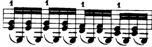
Şekil 4.47. Pierre Rode 24 Kapris, 23. Kapris, 22. Ölçü (F.David.1895 s.48)

22. ölçüde olduğu gibi hareketli partinin çift seste olduğu (çift ses onaltılık notaların boş tel ile bağlanması) benzer ölçülerde, çift sesleri bağlı çift seslerde olduğu gibi telden kaldırmadan çalmak, enerji ve zaman yönünden çalıcıya tasarruf yapma imkanı vererek pasajın daha hızlı ve kontrollü çalınmasını sağlayacaktır.