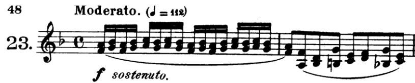
Şekil 4.42. Pierre Rode 24 Kapris, 23. Kapris, 1-2. Ölçüler (F.David.1895 s.48)

Alt ve üst sesin aynı ritimde olduğu (seslerin aynı anda değiştiği) çift sesler: