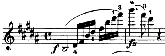
Şekil 4.15. Pierre Rode 24 Kapris, 11. Kapris, 1-2. Ölçüler (David.1895 s.22)

Kaprisin ilk iki ölçüsündeki nüanslar için önerilen teknik uygulamalar kaprisin içindeki benzer diğer ölçüler için de geçerlidir.