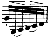
Şekil 4.37. Pierre Rode 24 Kapris, 22. Kapris, 27. Ölçü (F.David.1895 s.46)