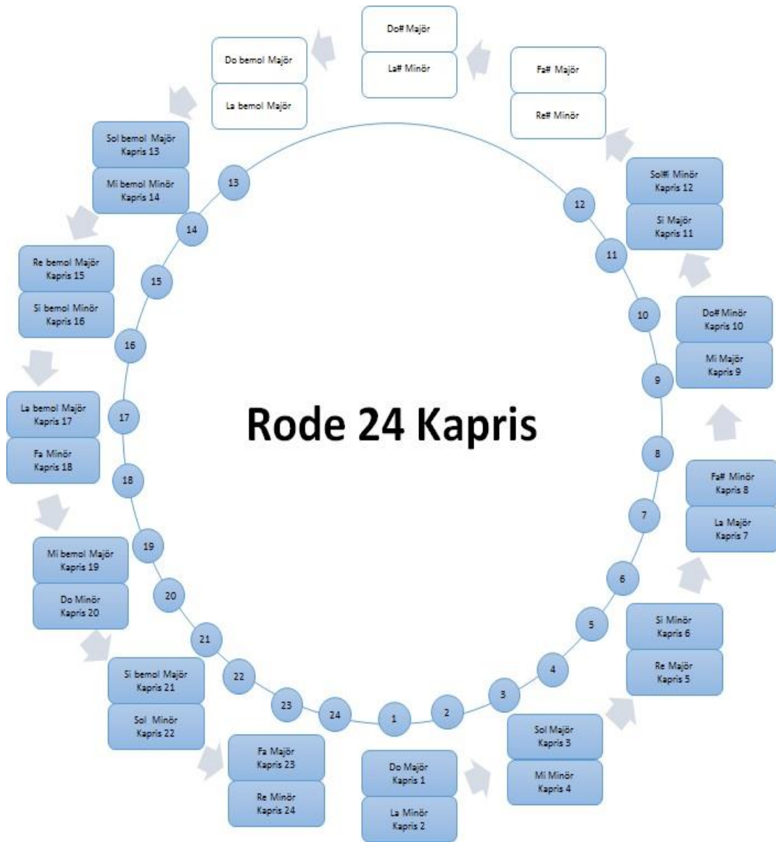
Şekil 3.1. Pierre Rode 24 Kapris Tonal Yapı

olan sol bemol majörden başlamaktadır. 13 numaradan itibaren sol bemol majör tonundan başlayan bemollü gamlar tek bemollü tonaliteye doğru aynı sistematik düzen içinde ardışık sıra ile 24 numaraya kadar devam etmektedir. Rode çok sık kullanılmayan tonalitelere ifade edebileceğimiz fa diyez majör, re diyez minör, do diyez majör, la diyez minör, do bemol majör ve la bemol minör tonlarında kapris yazmamıştır. Rode'un kurguladığı kaprislerindeki gam düzeni rastlantısal değildir. Bilinçli olarak sistematik bir bütün halinde kurgulanmıştır. Bu detay Rode'un kaprislerinde yorumcu tonal olarak hazırlamaya önem verdiğini gösterir. Rode'un 24 kaprisinde kullandığı tüm sistematik düzen Şekil 3.1'de ayrıntılı olarak görülmektedir;