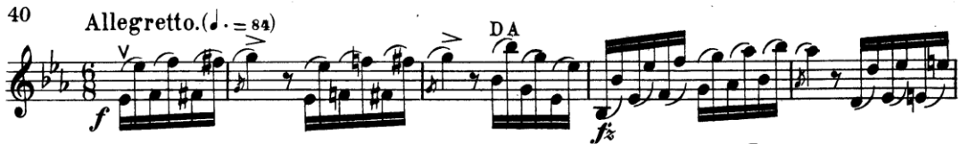
Şekil 4.31. Pierre Rode 24 Kapris, 19. Kapris, 2. Kesit, 1-5 Ölçüler (F.David.1895 s.40)

Kapristeki çift seslere hazırlık olması açısından kaprisi çalışmaya başlamadan önce üçlü, altılı, oktav ve onlu çift ses gam çalışması parmakların ısınmasına faydalı olacaktır. Kaprisi çalışılırken öncelikle parmak basma organizasyonu kavranmalıdır. Örneğin kesitteki oktav çift ses pasajlar sol elde pasajın temiz ve akıcı olması için iki telde aynı anda basılarak çift ses gibi düşünülmelidir. Bu çalışma kimi zaman iki notayı tele aynı anda basarak kimi zaman da telden parmağımızı gereksiz yere kaldırmayarak gerçekleşecektir. Kapriste oktavlar arasında pozisyon geçişleri mevcuttur. Bu geçişlerde oktav aralıkları sol el parmakları aynı anda basılmalı ve pozisyon geçişler basılı parmakların yuvarlaklığını koruyarak geçilen pozisyon aralığındaki mesafeye kontrollü bir şekilde ulaşması ile olmalıdır. Oktav seslerin pozisyon geçişlerinin temiz olması için bu geçişler çift ses olarak çalışılmalıdır. Oktav sesleri gidiş dönüş olarak çalışmak, hedefteki pozisyona giderek ve ilk pozisyona geri dönerek iki pozisyon arasındaki aralıkların parmaklar tarafından daha iyi kavranmasını sağlar. Bu çalışma büyük pozisyon atlayışları ve çift ses atlayışlar için uygun bir çalışmadır. Aşağıdaki 1 ve 5 numaralı ölçülerde görüldüğü üzere kapris çok sayıda pozisyon geçiş içermektedir ve bu pozisyon geçişler arasındaki geçiş mesafesi sol el parmakları tarafından iyi kavranmalıdır. Geçiş mesafelerinin iyi kavranmadığı pasajlarda yaşanabilecek en büyük problem temiz sesler elde edememektir.