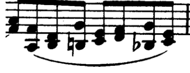
Şekil 4.46. Pierre Rode 24 Kapris, 23. Kapris, 14. Ölçü (F.David.1895 s.48)

22. ölçüde olduğu gibi hareketli partinin çift seste olduğu (çift ses onaltılık notaların boş tel ile bağlanması) benzer ölçülerde, çift sesleri bağlı çift seslerde olduğu gibi telden kaldırmadan çalmak, enerji ve zaman yönünden çalıcıya tasarruf yapma imkanı vererek pasajın daha hızlı ve kontrollü çalınmasını sağlayacaktır.