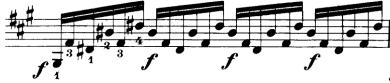
Şekil 4.12. Pierre Rode 24 Kapris, 8. Kapris, 5. Ölçü (David.1895 s.16)

pasajlarda çift ses parmak basma organizasyon çalışmaları, parmakları gereksiz kaldırmayı engeller ve böylece pasajları hızlı çalmak kolaylaşır.