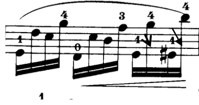
Şekil 4.10. Pierre Rode 24 Kapris, 6. Kapris, 1. Kesit, 19. Ölçü (David.1895 s.12)

İkinci kesit üç farklı gam ile başlar. Bunlar; si minör, sol majör, mi majör gamlarıdır. Başlangıçtaki gamlar bizlere ikinci kesitteki müzik sitilini de göstermektedir. İkinci kesit gamlar ve arpejlerin oluşturduğu bir bütündür. Bu kapriste dikkat edilmesi gereken en önemli unsur gam ve arpejlerin temiz olmasını sağlamaktır. Bu yüzden yavaş çalışmanın faydası görülecektir. Detache olan ikinci kesit farklı şekillerde çalışılabilir. Örneğin bir ölçüde iki bağlı ve bağlı notalar aynı zamanda ritimli olarak çalınabilir. Bu çalışma şekli sol el parmaklarının daha güçlü olmasını sağlayacaktır.