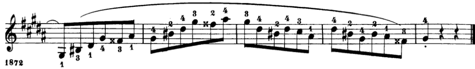
Şekil 4.17. Pierre Rode 24 Kapris, 12. Kapris, 71-75. Ölçüler (David, 1895, s.25).

Kapriste 71,72,73 ve 74 numaralı ölçülerde tek bir yay hareketinde 23 adet nota vardır. Bir yay hareketinde bu kadar çok notayı aynı anda çalabilmek için yay organizasyonunu doğru yapmak gerekmektedir. Yayıdaki her bir santim ekonomik kullanılmalıdır.