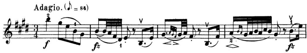
Şekil 4.13. Pierre Rode 24 Kapris, 9. Kapris, 1. Kesit, 1-4. Ölçüler (David.1895 s.18)

yaylarla çalabilme becerisini (kemanda şarkılı çalabilme becerisini) yorumcuya kazandırmayı hedeflemektedir. Kaprisin ilk kesiti kemanda şarkılı çalabilme becerisini geliştirir. Birçok eğitimci kemanda şarkılı çalabilme yetisinden bahsederken sağ kolun şarkılı çalma ve ses rengine olan etkisinin önemine vurgu yapmaktadır. Bu kesitteki en büyük zorluk bütün bu müzikal becerileri teknik pasajlarla birleştirerek dinleyiciye aktarmaktır. Kesiti çalışırken öncelikle yavaş tempoda uygun parmak numaralarını temiz seslerle çalmak ilk aşamada yararlı olacaktır. Daha sonra orijinal bağları ile müzik cümlelerini tek tek birleştirerek bütünü çıkartmak ikinci aşamada kesiti çalabilmeye yardımcı olacaktır.