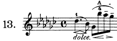
Şekil 4.20. Pierre Rode 24 Kapris, 13. Kapris, 1. Ölçü (David, 1895, s.26)

Kaprıste sol el parmakları telin üzerinde olmalı ve parmak artikülasyonunda küçük hareketler tercih edilmelidir. Sol el bir sonra gelecek pozisyon ya da parmak numarasına önceden hazırlık yapmalı birçok pasajda pozisyon geçmek yerine parmak uzatma tekniği kullanılmalıdır. Tele bitişik uzun yay kullanımında parmak uzatma tekniği pozisyon geçişine göre geçiş yapılan iki nota arasındaki legato yapıyı müzikal yönden korumamızı kolaylaştıran bir tekniktir. Parmak uzatmayı gerçekleştirebilmek için bütün parmaklarımızın esnek olması, özellikle büyük aralıklarda tüm parmakların arasındaki boşlukların değerlendirilmesi gerekmektedir. Örneğin aşağıda yer alan 1 numaralı ölçüde sol notası ile si notası arasında pozisyon geçmek yerine parmak uzatmak crescendonun çıkmasına ve iki nota arasındaki bağın kopmamasına yarar sağlayacaktır.