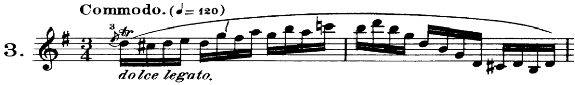
Şekil 4.6. Pierre Rode 24 Kapris, 3. Kapris, 1-2 Ölçüler (David, 1895, s.6)

Kaprıste nüanslar ile bütünleyici bir etki oluşturan aksanlar ve triller yorumcunun gözünden kaçmamalıdır. Çünkü bu unsurlar kapristeki önemli ses dinamikleridir. Rode bu kapriste nüansların yanı sıra dolce (tatlı) terimini kullanmıştır. Bu kapris sağ el ve sol el koordinasyon çalışması için uygundur. Kapristeki tel geçişleri, sol elin parmak hareketleri ile uyumlu olmalıdır. Sol el bir sonra çalınacak notaya hazırlık yapmalıdır. Özellikle 24 onaltılık notanın tek yay hareketinde çalındığı ilk iki ölçüde yay ekonomik kullanılmalıdır.