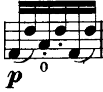
Şekil 4.36. Pierre Rode 24 Kapris, 22. Kapris, 93. Ölçü (F.David.1895 s.46)