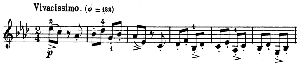
Şekil 4.27. Pierre Rode 24 Kapris, 17. Kapris, 1-6 Ölçüler (David, 1895, s.36).

Kaprisin temposu hızlıdır. Bu hız nedeni ile ölçüye bir vurulması düşünülmelidir. Kapris incelendiğinde bu hızlı tempo Rode'un staccato yay tekniğinde dinleyiciye virtüöz bir konser kaprisi dinletme hedefinde olduğunu bizlere düşündürür. Ancak yine temponun hızlı olması nedeniyle tam olarak tele yapışık bir staccato tekniğiyle çalınması mümkün değildir. Onun yerine telden çok ayrılmadan, tel üzerinde yaylanan, soutille yay tekniğine yakın bir yay kullanımı daha net sesler ve kaprisin genel virtüöz karakterine uygun bir çalım elde etmeyi sağlayacaktır.