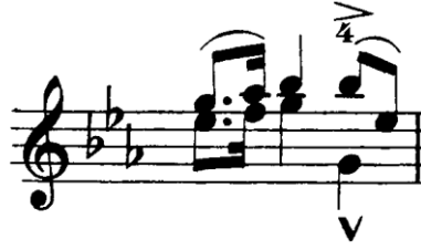
Şekil 4.29. Pierre Rode 24 Kapris, 19. Kapris, 1. Kesit, 35. Ölçü (David, 1895, s.39)

rahat ve esnek kullanımı sayesinde onlu aralık melodik yapının içerisinde başarı ile icra edilebilir.