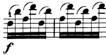
Şekil 4.41. Pierre Rode 24 Kapris, 22. Kapris, 65-66. Ölçüler (F.David.1895 s.46)

Kapris bağısız ve ritimli olarak ağır tempoda (iki, üç, altı bağlı olarak) detache çalışılabilir. Bu çalışma sırasında bir önceki ve bir sonraki nota, pozisyon, yay vb. gibi unsurlar dikkate alınarak belirlenen parmak numaralarının en yararlısını bulmak yorumcunun pasaja daha hakim olmasını sağlayacaktır. Bu nedenle çalışırken farklı kombinasyonlarda parmak numaraları denemek yararlı olacaktır. Kapriste sol el parmakları bir sonraki notaya hazırlanmalı hatta uygun olan pasajlarda (tek sesli) çift ses basmalıdır. Örneğin 65- 66 numaralı ölçülerde ardışık notalar çift ses olarak düşünülmelidir.