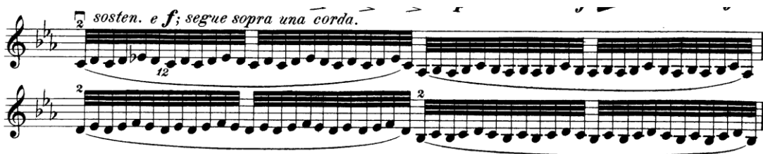
Şekil 4.32. Pierre Rode 24 Kapris, 20. Kapris, 23-24. Ölçüler (F.David.1895 s.42)

Kapriste 23. ölçüden başlayarak kaprisin sonuna kadar devam eden (10 ölçü hariç) bağlı tele bitişik tek bir yay hareketinde 24 notanın olduğu pasaj sol elde artikülasyon sağ elde uzun yay (ekonomik yay kullanımı) çalışmaları için uygundur. Pasajdaki notaların bir yay içinde dengeli, eşit ve cümle bütünlüğü korunarak çalınması önemlidir. Pasaja hazırlanmak için yapılacak en yararlı sağ el çalışması tek ses üzerinde mümkün olan en uzun yay çekiş ve itişine sahip olmak üzerine yapılan çalışma yöntemidir. Çalışmada sağ elin kaliteli ses çıkararak çalabileceği en uzun yay hareketine ulaşabilmesi hedeflenmelidir. Bu çalışma yöntemi sağ elin yaya daha hakim olmasını sağlayacaktır. Bu pasajlar bütününde dikkat çeken en önemli nokta sonuna kadar bütün pasajın sol telinde olmasıdır.