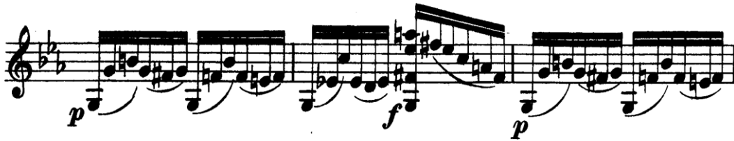
Şekil 4.30. Pierre Rode 24 Kapris, 19. Kapris, 2. Kesit, 48-50. Ölçüler (F.David.1895 s.41)

Rode'un 24 kaprisin her birinde çeşitli keman tekniklerini harmanlayarak kullandığını daha önce de belirtmiştik. Ancak Rode çoğu zaman kullandığı bu tekniklerden bir tanesini merkeze almış bu teknik özelliğın üzerinde daha çok durduğunu göstermiştir. 19 numaralı kaprisin ikinci kesiti incelendiğinde kaprisin oktav çalışmasını merkeze aldığı görülmektedir. Rode neredeyse tamamen oktavlardan oluşacak bir egzersizi müzikal öğeler ile harmanlayarak bu kesiti oluşturmuştur. Ancak çift ses (oktav) çalışmasına bu kadar değindiğimiz kesite nota yazımı olarak baktığımızda, çift ses yoktur. Kaprisin oktav çalışmasının yanında büyük ölçüde akor basmayı da çalıştırdığı görülmektedir. Üç bağlı tek ses notaların üç ayrı telde yazılmış olması, aynı parmağın iki tele birden basarak kullanımı gibi akorlu eserlerde sıkça karşılaşılan yöntemlerin varlığı bizlere akor çalışması düşüncesini göstermektedir. 46-53 numaralı ölçüler arasındaki pasaj akor kullanımının eserdeki en belirgin kısmıdır.