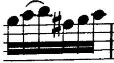
Şekil 4.35. Pierre Rode 24 Kapris, 22. Kapris, 14. Ölçü (F.David.1895 s.46)