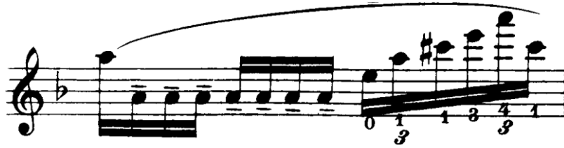
Şekil 4.49. Pierre Rode 24 Kapris, 24. Kapris, 1. Kesit, 8. Ölçü (F.David.1895, s.47)

Kesitte sağ elde tele bitişik tek bir yay hareketinde birden çok notanın olduğu bağlı yapıda 8 numaralı ölçüde portato yay tekniği kullanılmıştır.