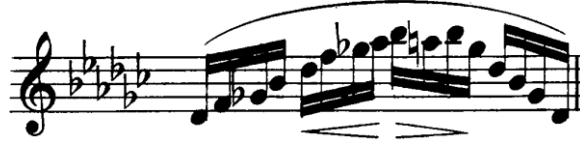
Şekil 4.23. Pierre Rode 24 Kapris, 13. Kapris, 62. Ölçü (David,1895, s.27)

Kapristeki tekniklerin pekiştirilmesi için tamamlayıcı egzersiz olarak kapisin eş zamanlı Dont (Op. 35) Etüt ve Kapris no:7, Fiorillo 36 Etüt no:8, 15-16, Kreutzer 42 Etüt no:14 ile çalışılması faydalı olacaktır.