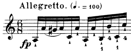
Şekil 4.4. Pierre Rode 24 Kapris, 2. Kapris, 1. Ölçü (David, 1895, s.4)

Kapriste tek sestem oluşan birer ölçülük nota kalıpları çift sesmiş gibi düşünülerek sol el parmakları hazırlanmalıdır. Çift ses çalışmalarındaki en önemli nokta ilgili iki parmağın farklı iki tele aynı anda basmasıdır. Prensip olarak çift ses basılan sesler teker teker çalınarak dinlenmelidir. Böylece çift seslerin temiz olarak çalınması sağlanacaktır. Çift ses çalışmasına bu kadar değindiğimiz iki numaralı kapriste nota yazımını olarak baktığımızda, çift ses yoktur. Rode bu kapriste sol el için çift ses çalışmasını tek sesler halinde yazmıştır. Kapriste genellikle ardışık notaların oluşturduğu çift sesleri görmekteyiz. Örneğin kapristeki ilk iki ölçü altılı ve oktavlardan oluşmaktadır. Bu ölçüler sol elde pasajın temiz olması için bu aralıklar iki telde aynı anda basılarak çift ses gibi çalınmalıdır. Bu çalışma kimi zaman iki notayı tele aynı anda basarak kimi zaman da telden parmağımızı gereksiz yere kaldırmayarak gerçekleşecektir.