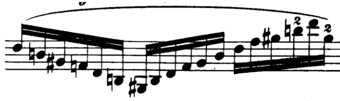
Şekil 4.48. Pierre Rode 24 Kapris, 24. Kapris, 1. Kesit, 7. Ölçü (F.David.1895 s.50)

Kesitte sağ elde tele bitişik tek bir yay hareketinde birden çok notanın olduğu bağlı yapılarda çoklu tel geçişler vardır.