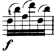
Şekil 4.40. Pierre Rode 24 Kapris, 22. Kapris, 65. Ölçü (F.David.1895 s.46).

Kapris bağısız ve ritimli olarak ağır tempoda (iki, üç, altı bağlı olarak) detache çalışılabilir. Bu çalışma sırasında bir önceki ve bir sonraki nota, pozisyon, yay vb. gibi unsurlar dikkate alınarak belirlenen parmak numaralarının en yararlısını bulmak yorumcunun pasaja daha hakim olmasını sağlayacaktır. Bu nedenle çalışırken farklı kombinasyonlarda parmak numaraları denemek yararlı olacaktır. Kapriste sol el parmakları bir sonraki notaya hazırlanmalı hatta uygun olan pasajlarda (tek sesli) çift ses basmalıdır. Örneğin 65- 66 numaralı ölçülerde ardışık notalar çift ses olarak düşünülmelidir.