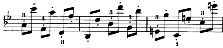
řekil 4.33. Pierre Rode 24 Kapris, 21. Kapris, 25-27. ller (F.David.1895 s.44).

Kapris ierisinde ok sayıda tel deđiřtirme ve pozisyon geif barındırır, bu yn ile tel deđiřtirme ve pozisyon geif teknik becerilerinin artmasına katkıda bulunur.