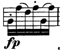
Şekil 4.38. Pierre Rode 24 Kapris, 22. Kapris, 114. Ölçü (F.David.1895 s.47)