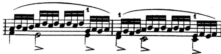
Şekil 4.43. Pierre Rode 24 Kapris, 23. Kapris, 5-6. Ölçüler (F.David.1895 s.48)

Alt ve üst sesin farklı ritimde olduğu (seslerin farklı zamanlarda değiştiği) çift sesler: