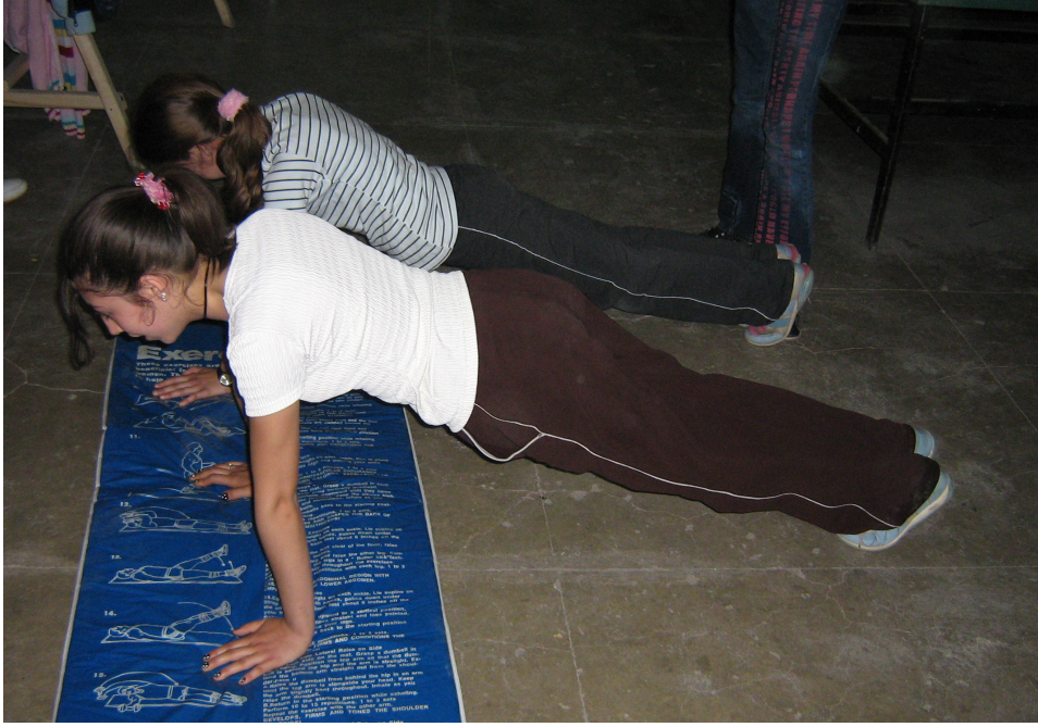
Şekil 3- İzometrik Şınav Testi (Isometric Push Up)

- İzometrik Şınav Testi: Üst vücut kapasitesini ölçmek amacıyla uygulanmıştır. Uygulayıcı tarafından şınav pozisyonu gösterilir. Bu pozisyonda bekleme süresi kronometre ile (sn) olarak kaydedilir. Kollarda veya dizlerde herhangi bir bükülme olması veya belin gerginliğini koruyamaması durumunda test sona erer (Ün, 2003; Winnick ve Short, 1999) ( Şekil 3 ).