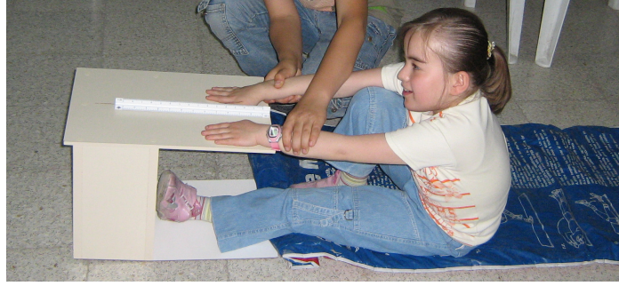
Şekil 6- Otur-Uzan Testi (Sit and Reach)

- Otur-Uzan Testi: Esneklik veya hareket açıklığını ölçmek amacıyla uygulanır. Ölçümler belirlenmiş standarda uygun olan bir ölçüm aracıyla yapılmıştır. Öğrenci, yardımcı yardımıyla yere oturur. Bir bacağı bükülü diğer bacağı öne uzatılmış durumdadır. Öne uzattığı ayağı cihazın içine girecek şekilde ayarlanır. Bükülü olan bacak, kolların arasından çıkmayacak şekilde öğrencinin öne ve ileri doğru uzanması ve santimetreyle bölümlenmiş kısmı ileri doğru itirmesi istenir. Bunu yaparken öğrenciye arkadan destek verilmez. Uzandığı en son kısım (cm) olarak kaydedilir (Ün, 2003; Düzgün, 2002; Winnick ve Short, 1999) ( Şekil 6 ).