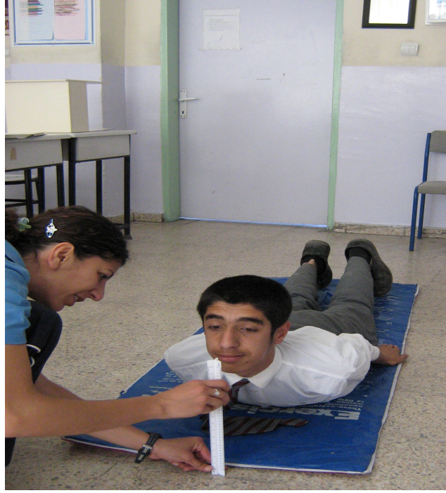
řekil 4- Gövde Esnekliđi Testi (Trunk Lift)

- Gövde Esnekliđi Testi: Gövde esnekliđini ölçmek amacıyla uygulanmıřtır. Hareket uygulayıcı tarafından gösterilir. Öğrenci yüzükoyun yere uzanır. Kollar yanda düz yere dayalı olarak durur. Öğrenciye başını elleriyle yerden yardım almaksızın kaldırıp karşıya bakması söylenir. Metre yardımıyla yerle çenesi arasındaki mesafe ölçölüp sonuç (cm) olarak kaydedilir. Sonuç 30 cm'nin üzerinde bir deđerse sonuç 30 cm olarak kaydedilir (Pekçetin, 2003, Ün, 2003; Winnick ve Short, 1999) ( řekil 4 ).