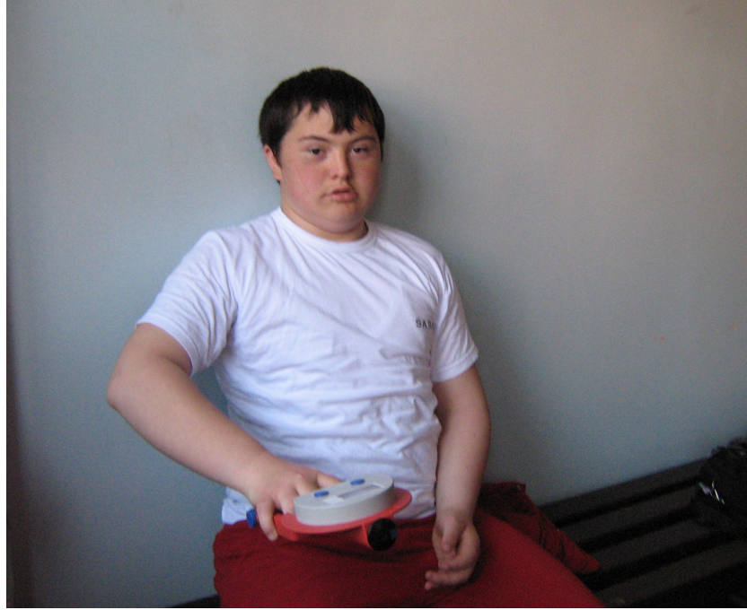
Şekil 7- Kavrama Kuvveti Testi (Dominant Grip Strength)

- Kavrama Kuvveti Testi: Test el ve kol kuvvetini ölçmek amacıyla uygulanır. Öğrenci kol dayama yeri olmayan sandalyeye oturur. Ayaklar yerle tam temasta olup dirsek 90° bükülü pozisyondayken test uygulanmıştır. Ölçümler 3 tekrarlı yapılmıştır. Her bir tekrar arasında 30 saniye (sn) dinlenme süresi verilmiştir. Ölçümlerin ortalaması alınıp skor kilogram (kg) cinsinden kaydedilmiştir. Ölçümler için “Takei” marka dinamometre kullanılmıştır (Yılmaz, 1998; Yanardağ, 2001; Winnick ve Short, 1999) ( Şekil 7 ).