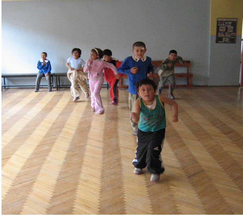
Şekil 2- İlerleyici Aerobik Kardiyovasküler Dayanıklılık Koşu Testi (Pacer)

- 16 M İlerleyici Aerobik Kardiyovasküler Dayanıklılık Koşu Testi (Pacer Test) : Bu test aynı 20 m testinde olduđu gibi uygulanmıřtır. Tek fark mesafedir. Renkli huniler 16 m' lik mesafeye konulmuřtur (Savucu ve ark., 2006; Winnick ve Short, 1999).