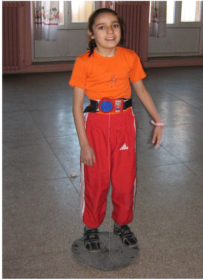
Şekil 8- Sıçrama Testi

- Sıçrama Testi: Test patlayıcı gücü ölçmek amacıyla uygulanmıştır. Cihaz hazırlanıp uygulayıcı tarafından nasıl yapılacağı gösterilmiştir. Cihaz öğrencinin beline bağlanıp yerden kuvvet alarak yukarı doğru sıçraması istenmiştir. Öğrencinin daha yukarı sıçramasını sağlamak amacıyla bir yardımcı, öğrencinin yanında durarak ellerini yukarı kaldırır ve öğrencinin sıçrayarak eline dokunmasını ister. İki deneme hakkı verilmiş olup ortalama değer (cm) olarak kaydedilmiştir. Ölçümler için "Takei" marka ölçüm aracı kullanılmıştır (Ün, 2003; Pekçetin, 2003; Winnick ve Short, 1999) ( Şekil 8 ).