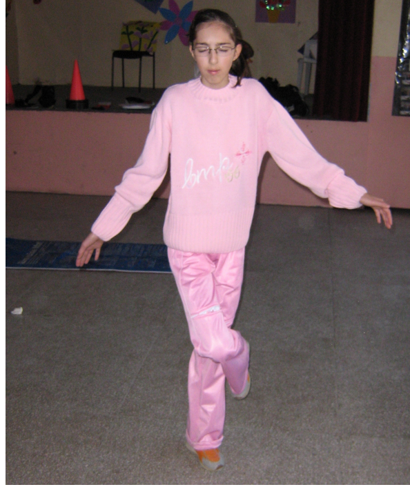
Şekil 9- Statik Denge Testi

- Statik Denge: Statik pozisyonda dengeyi sürdürebilme becerisini ölçmek amacıyla uygulanmıştır. Öğrenciden ayakta duruş pozisyonunda, ellerini kalçalarının üzerinde birleştirmeleri istenmiş sonra bir ayağını kaldırıp diğer dizinin üstüne yerleştirerek gözlerini kapatıp bu pozisyonu korumaları söylenmiştir. Kronometre, öğrenci gözlerini kapattığında başlatılmış, denge bozulduğu anda durdurulmuştur. Aynı test göz açık şekilde de uygulanmıştır. Skor (sn) cinsinden kaydedilmiştir (Yılmaz, 1998; Ün, 2003; Winnick ve Short, 1999) (Şekil 9).