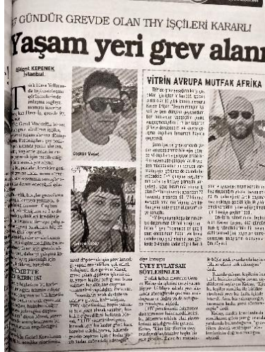
Görsel 4.8. Evrensel, 19 Ağustos 2013