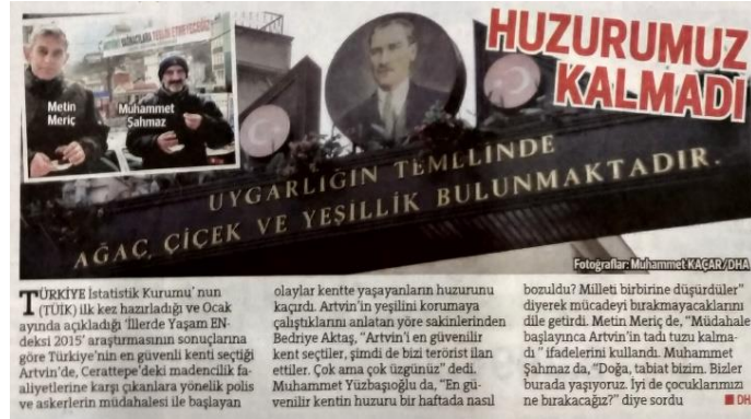
Görsel 4.14. Hürriyet, 24 Şubat 2016, s. 19

Aynı zamanda, haberde Artvin'in en işlek caddesinin girişinde üzerinde Atatürk'ün fotoğrafının ve "Uygarlığın temelinde ağaç, çiçek ve yeşillik bulunmaktadır" sözünün yer aldığı kemerin görüntüsü ile görüşülen Artvinlilerden ikisinin olduğu fotoğraflar kullanılmıştır.