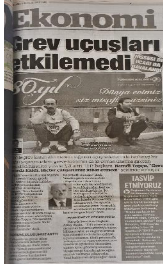
Görsel 4.4. Yeni Şafak, 16 Mayıs 2013, s. 6