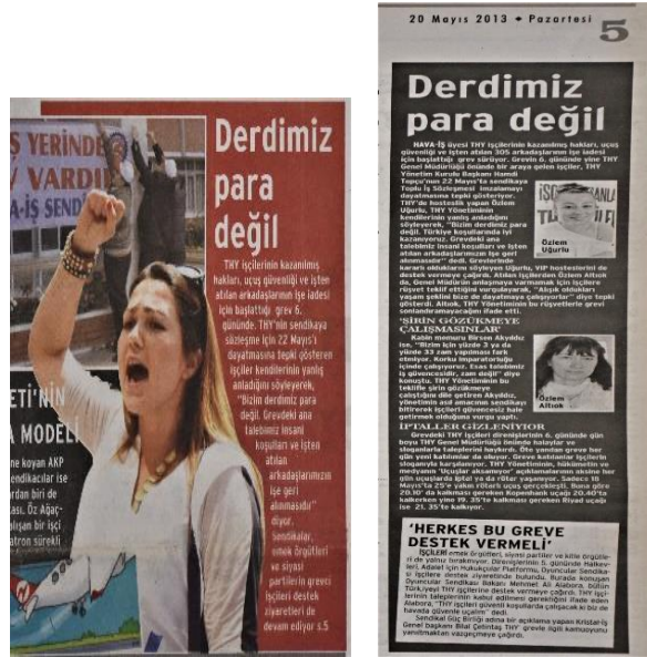
Görsel 4.7. Evrensel, 20 Mayıs 2013, s. 1 ve 5

uygun bir ücret artışı yapacağını açıklamasıyla ilgili işçilerin görüşleri alınmıştır. Birinci ve iç sayfada “Derdimiz para değil” (Evrensel, 20 Mayıs 2013, s. 5) başlığıyla aktarılan haberde THY Yönetim Kurulu Başkanı Hamdi Topçu’nun sendikaya yaptığı çağrının işçiler tarafından tepkiyle karşılandığı belirtilerek, işçilerin konuyla ilgili görüşleri isim ve fotoğraflarıyla birlikte aktarılmıştır.