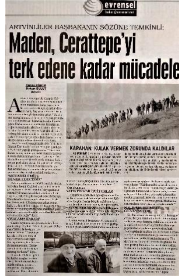
Görsel 4.10. Evrensel, 26 Şubat 2016, s. 1 ve 2

Evrensel gazetesinde Artvin halkının görüşlerini temel alan diğer haberlerin başlıkları ise şöyledir: “ARTVİN’DE ESNAFLAR DA MADENE DİRENİYOR: Maden gelirse KEPENK İNER” (7 Ağustos 2015, s. 2), “Polis ve asker geldi Artvin’de huzur kaçtı” (24 Şubat 2016, s.2), “Madene karşı direnen Artvinliler: Kurmazlar sandığı, biliyorlar çünkü hayır diyeceğimizi” (25 Şubat 2016, s. 2). Söz konusu haberlerin ilkinde Artvin merkezde esnaf ve yurttaşlarla yapılan görüşmede Artvinliler, Cerattepe’nin doğasının önemini, Çernobili yaşamış bir halk olarak doğaya karşı duyarlı olduklarını ve madenin Artvin’i bitireceğini, bölgeye zarar vereceğini, madenin yasadışı uygulamalarla hayata geçirilmek istenmesine karşı haklı olduklarını ve madeni yaptırmamak konusunda kararlı olduklarını dile getirmiştir. Diğer iki haberde ise Türkiye İstatistik Kurumu’nun (TÜİK) Türkiye’nin en güvenli kenti seçtiği Artvin’de Cerattepe’deki madencilik faaliyetlerine karşı çıkan Artvinlilere yönelik 16 Şubat’tan itibaren devam eden müdahaleler karşısında huzurlarının kalmadığı, Cerattepe’de yapılması planlanan madenciliğin gerekirse halkın oylamasına sunulması önerisi konusunda yurttaşların Cengiz İnşaat, hükümet yetkilileri ve güvenlik güçlerinin müdahalelerini eleştiren değerlendirmelerine yer verilmiştir.