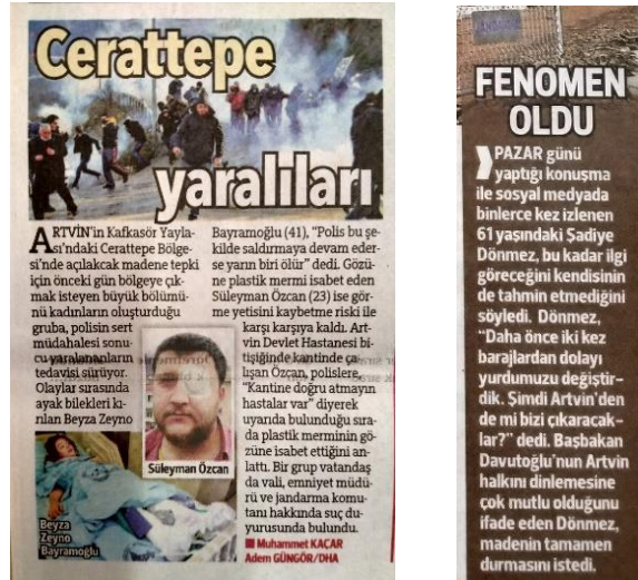
Görsel 4.16. Hürriyet , 23 ve 27 Şubat 2016

Bu bağlamda, Hürriyet konuyla ilgili haber içeriklerinde Artvin halkını ve mücadelesini açıkça önemsizleştiren ve olumsuzlayan bir söyleme sahip olmasa da Evrensel ve Sendika.org ile kıyaslandığında, halkın mücadelesinin boyutlarını magazinelle bir üslupla ele aldığı ve halkın görüşlerine geniş ölçüde yer vermediği söylenebilir.