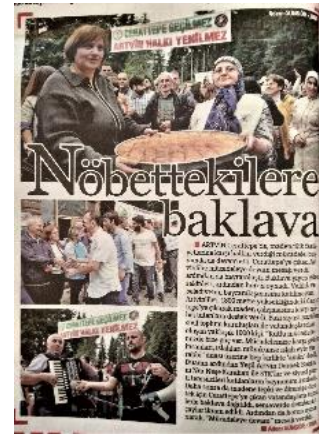
Görsel 4.15. Hürriyet, 14 ve 19 Temmuz 2015

Cerattepe’de kışın da devam eden nöbeti Sendika.org , Artvin halkının nöbet kulübesindeki koşullarını ayrıntılarıyla yansıtırken; Hürriyet ’te 6 Aralık tarihinde yayımlanan “Cerattepe’de karlı nöbet” başlıklı haberde nöbet tutma eyleminin kar yağışına karşın devam ettiği belirtildikten sonra nöbeti devralan Türkiye Mimar Mühendis Odalar Birliği (TMMOB) il koordinasyon kurulu temsilcisinin açıklaması verilmiştir. Haberde kullanılan tek fotoğrafta, üzerinde TMMOB il koordinasyon kurulu yazılı afişi tutan iki kişi ile onların yanında duran bir kişinin Cerattepe’deki nöbet kulübesinin civarında çekilmiş görüntüsüne yer verilmiştir (Hürriyet, 6 Aralık 2015, s. 6).