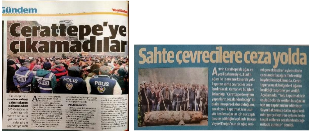
Görsel 4.17. Yeni Şafak, 22 ve 23 Şubat 2016

ekonomi politik yapısı gerekse temsil ettiği ideoloji bağlamında siyasi iktidarla olan organik bağının yönlendiriciliği açıkça görülmektedir.