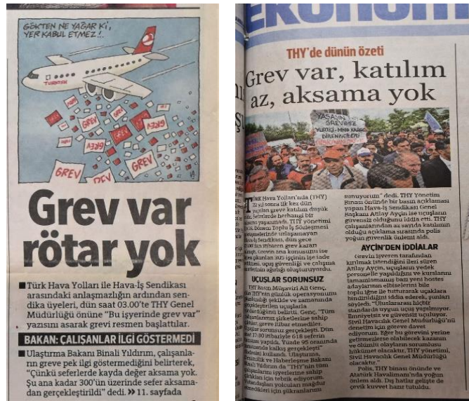
Görsel 4.3. Hürriyet , 16 Mayıs 2013, s. 1 ve 11

Hürriyet gazetesi de THY grevinin ilk gününü birinci sayfadan “Grev var rötar yok” ( Hürriyet , 16 Mayıs 2013, s. 1) başlığıyla duyurarak haberin devamında “THY’de dünün özeti” üst başlığı ve “Grev var, katılım az, aksama yok” başlığıyla ( Hürriyet , 16 Mayıs 2013, s. 11) aktarmıştır. T24 ’ün yukarıda verilen haber metninde aktarılan açıklamalar Hürriyet ’in konuyla ilgili haberinde de kullanılmıştır. Ancak Hürriyet , Hava-İş’in açıklamasını “Ayçin’den iddialar” şeklinde vermesiyle T24 ’ten belirgin bir biçimde ayrılmaktadır. Öte yandan, Hürriyet gazetesinde hem haberin başlığında hem de metnin içerisinde katılımın az olduğunu ve işçilerin greve itibar etmediğini vurgulayan söylemler ile haberde kullanılan fotoğrafta kalabalık haldeki işçilerin görüntüsüne yer verilmesi arasında karşıt bir durumun ortaya çıktığı saptanmıştır.