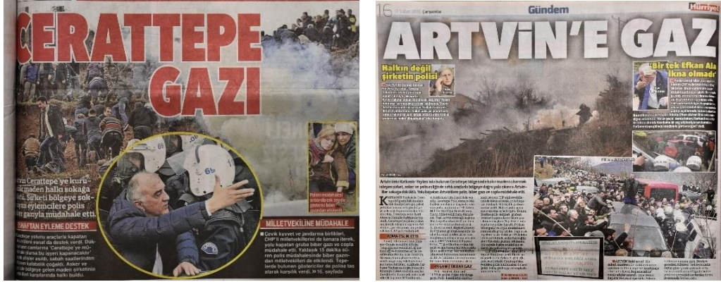
Görsel 4.6. Hürriyet, 17 Şubat 2016, s. 1 ve 16