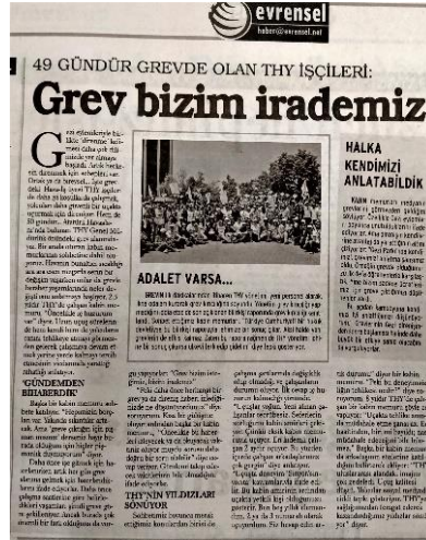
Görsel 4.9. Evrensel, 2 Temmuz 2013

Bu bağlamda, Evrensel gazetesi grevin başladığı ilk aylarda yaşanan gelişmelerle ilgili açıklamalarda sendika temsilcileri ve THY yönetiminin yanı sıra işçilerin söylemlerini de haber içeriklerine taşımıştır. THY işçilerinin taleplerini, işyerlerinde ve grev alanında yaşadıkları baskılar ve sorunlar kadar coşkularını ve umutlarını haber metinleri ile birlikte fotoğraflara yansıtmıştır.