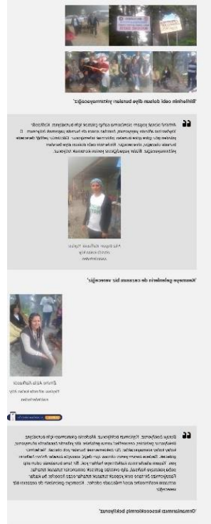
Görsel 4.11. Sendika.org , 9 Temmuz 2015 Görsel 4.12. Sendika.org , 4 Aralık 2015

getirildiği, kulübeyi ısıtan iki sobanın yakacak odunlarını Hatıla Vadisi köylüleri tarafından sağlandığı yönündeki bilgilerin yanı sıra yemek ve aydınlatma koşullarına ilişkin ayrıntılara yer verilmiştir: “Patates, kestane ve çekirdeğin eksik olmadığı Cerattepe gözetleme noktasında nöbet ezgilerine bağlama, gitar ve tulum eşlik ediyor. Yaz aylarında güneş paneli ve panelin yetmediği dönemlerde jeneratör ile sağlanan aydınlatma, şimdi ekonomik ve kullanışlı şarjlı akülerle sağlanıyor.” 85