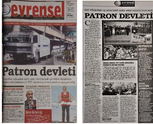
Görsel 4.1. Evrensel, 16 Mayıs 2013, s. 1 ve 5

Söz konusu haberin manşetinde polisin grev alanındaki güvenlik önlemlerine dikkat çeken büyük ve küçük boyutlarda olmak üzere iki fotoğraf kullanılmıştır. Önde TOMA aracının olduğu büyük fotoğrafın üst kısmında “Havaalanındaki görüntü ‘bu işyerinde grev yasak mı?’ dedirtti” başlığı atılmıştır. Küçük boyutlu fotoğrafta, “Atatürk Havaalanının her yanı polis tarafından ablukaya alındı” ifadesi kullanılmıştır (Evrensel, 16 Mayıs 2013, s. 1). İç sayfada, iki grup halinde ellerinde kalkanlarıyla grev alanında bekleyen polislerin görüntüsünün yer aldığı büyük boyutlu fotoğraf ise “Havaalanında sıkıyönetim manzaraları yaşandı. Polis havaalanını abluka altına alarak işçileri engelledi” (Evrensel, 16 Mayıs 2013, s. 7) ifadeleriyle açıklanmıştır.