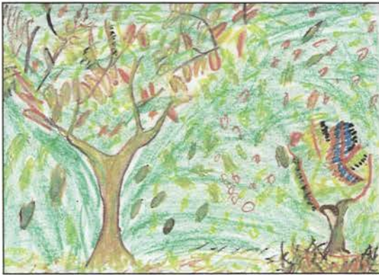
Resim 5. 5. sınıf. 10 yař Müzik eřliđinde uygulanmıř(25X25)