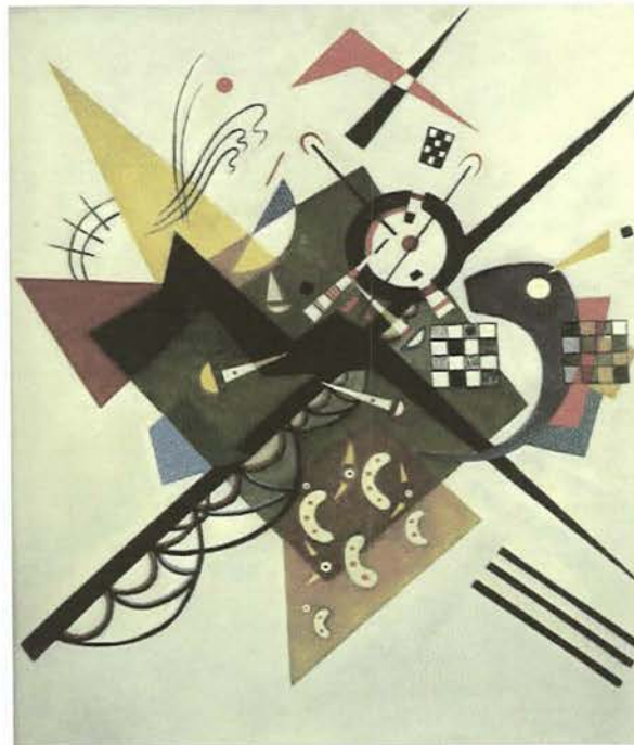
Resim: III Centre Georges Pompidou, Paris