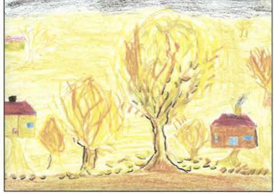
Resim 2. 4. sınıf. 9 yař Müzik eřliđinde uygulanmıř(25X35)