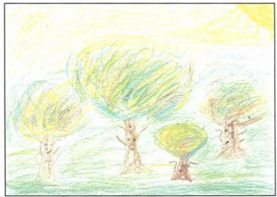
Resim 6. 5. sınıf. 10 yař Müziksiz uygulanmıř (35X25)