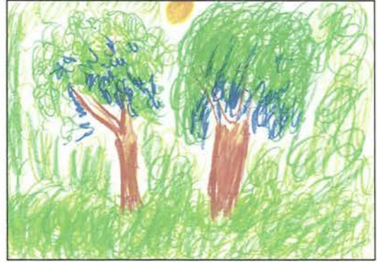
Resim 4. 5. sınıf. 10 yař Müziksiz uygulanmıř (35X25)