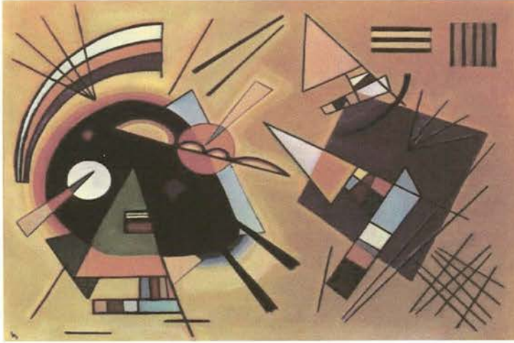
Resim: I Black and Violet 1923

neşe ve enerji vermesinin yanında bir süre sonra rahatsız etmeye başlar. Sarıyı gördüğümüzde güneşin sıcaklığını da, limonun ekşiliğini de hissedebiliriz. Turuncu gördüğümüzdeyse kocaman iri bir portakalı anımsayıp da ağzımız sulanmaz mı? Resim bilinçli yada bilinçsiz olarak beş duyumuzla algılanmaktadır. Herhangi bir resme bakarken içinde bulunan dokuyu, bize anımsattığı tadı, kokuyu hissedebiliriz ve resmi izlerken onun müziğini de duyabiliriz. Resimde hareket ve renkler bize duymamız gereken müziği açıkça duyurmaktadır. Resimde müzik hissedilirken, müzikte resmi yönlendirebilir yani resim yapan kişinin yaratıcılığının daha kolay ortaya çıkmasını, hayal gücünün rahatlamasını sağlayacaktır. Resim yapmakta olan kişi dinlediği müziğin ritim ve hareketini renk ,doku ve kompozisyona istemli yada istemsiz yansıtacaktır. Müziğin ona hissettirdiği duygular resimde daha yaratıcı bir havaya neden olacaktır ( Halıçınarlı, 1988, s., 226-228).