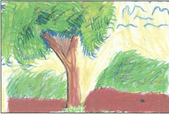
Resim3. 5. sınıf. 10 yař Müzik eřliđinde uygulanmıř(25X25)