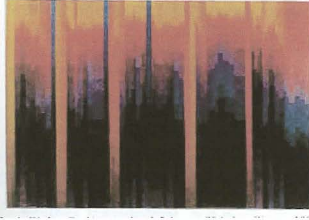
Resim: IV Jacob Weder, Bach'ın maj 3.Orkestra Sütinden Girgüe

Resimde çizgi ve boya iç - dünyayı ifade ederken müzik maddeye gerek duymadan bunu gerçekleştirmektedir. Çizgi, yüzey, renk, ışık, mekan gibi kompozisyon elemanlarının; ses, tını, ritim, armoni, müziğin biçimlendirme elemanları gibi zamansal ve zaman içinde algılandığı düşünceleri ilişkilerin çeşitli boyutlarda kurulmalarına neden olmuştur. Örneğin, mekansal, yapısal ya da Seurat' ın noktalarının eşdeğerliliğinin müziğin eş zamanlılığını karşılayabileceği düşüncesi gibi. Zamana karşı eşzamanlı düşünce; Delaunay'de resim düzeninde yapısal bir nitelik kazanan rengin, kapladığı yer ve kendi aralarındaki ilişkisi, yanındakine göre önde, geride izleniminin düşünsel bir mekan anlayışına ulaşmıştır. Kimi zaman, renk ve müziğin armonisi arasında ilişki kurulmuş, bu benzerlik için de renklerin nota değerleri düzenlenmiştir. Kimi zaman ise oniki tonluk ses skalası, oniki tonlu renk skalasının oluşturulmasına neden olmuştur ( İpşiroğlu, 1994,s.118 ).