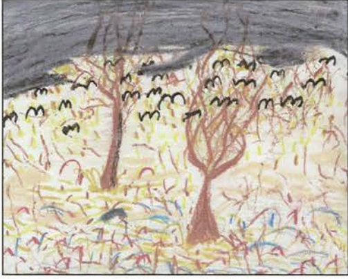
Resim 1. 4. sınıf. 9 yař Müziksiz uygulanmıř (35X25)

Konu : Dođadan gözlem çalıřması Teknik : Pastel boya tekniđi