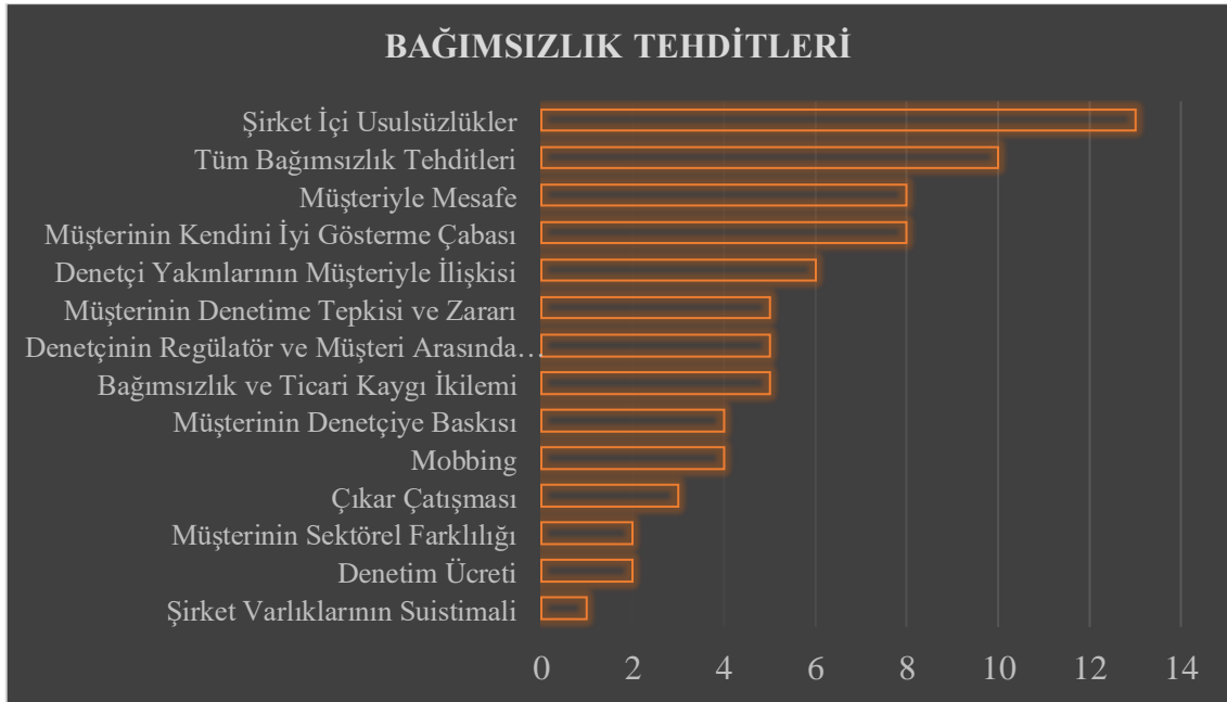
Şekil 1. Bağımsızlık Tehdidi Teması

şirket içi usulsüzlükler kodu ve müşterinin kendini iyi gösterme çabası kodu ile benzerlik gösterdiği, veri analizi sonucunda bağımsız denetçinin denetimi bağımsız şekilde yürütmesine engel teşkil eden tehditlerin büyük bir çoğunlukla müşteri işletmenin etik dışı davranışları nedeniyle ortaya çıktığı gözlemlenmektedir. Bağımsız denetim faaliyetlerinde bağımsızlığı koruma noktasında, bağımsız denetçinin etik tutumu ve şahsi çıkarlarından ziyade müşteri etik tutum ve davranışlarının çok daha fazla etkiye sahip olduğu düşünülmektedir. Ayrıca bağımsız denetim faaliyetlerinde bağımsızlığa engel yaratan tüm tehditlerin, aynı zamanda yönetsel etik uygulamaların verimliliğine de tehdit unsuru oluşturduğu ortaya çıkan bir diğer önemli bulgu olarak gözlemlenmektedir.