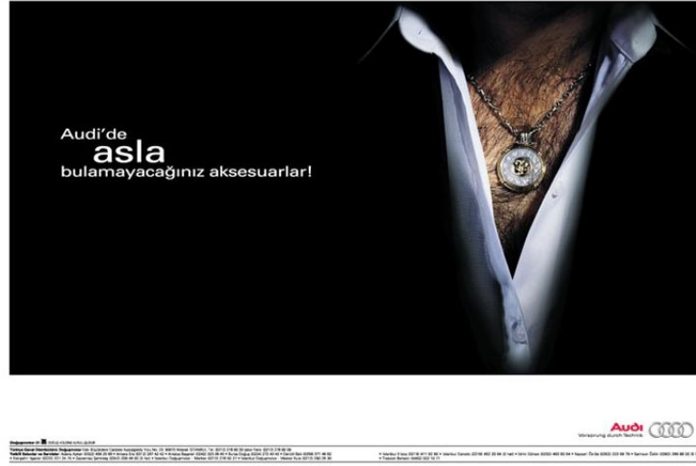
Görsel 1.9. Audi Reklam

“Audi’de asla bulamayacağınız aksesuarlar” reklam kampanyası da tabuları çiğnemeyi, şok ediciliği kullanarak oldukça etkili olmuştur. Markanın, Türkiye pazarında marka kimliğinin tam algılanamaması ve bilinirliğinin düşük olmasından dolayı cesaretle ortaya konulan ve dozu ayarlanmış şok stratejisi uygulanmıştır. Otomobil reklamları ile ilgili o zamana kadar var olan tabuların üzerine giden ve tabuları yıkan bu reklam kampanyasında, arkası basılmış ayakkabı, beyaz çorap, tesbih, altın bileklik gibi Audi’de asla bulunamayacak aksesuarlar anlatılmıştır (Görsel 1.6’da gösterilmektedir). Pırıl pırıl, son model otomobillerin mutlu aile tabloları ile birlikte yer aldığı reklamların aksine bu reklam kampanyası hem reklamın tonu hem de içeriği ile tüketicilerde bir şok etkisi yaratmıştır. “Otomobil reklamı böyle yapılır” tabusunu yıkan reklam kampanyası oldukça başarılı olmuştur.