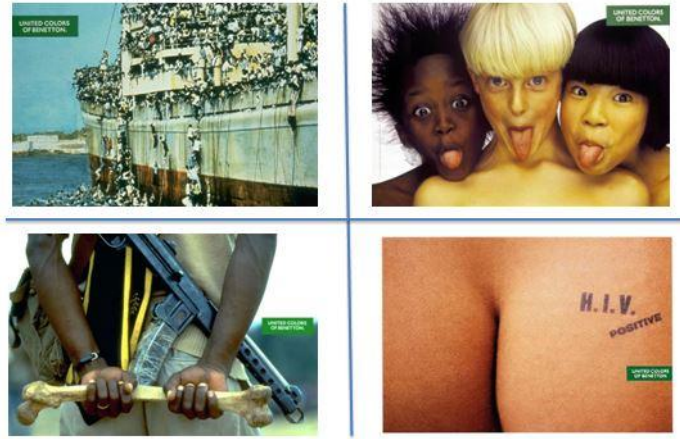
Görsel 1.1. Suçluluk Duygusu Örnek Reklam

Hedef kitle üzerinde oluşan suçluluk duygusu ve kaygının da harekete geçirici olması beklenilir (Elden ve Bakır, 2010, s. 113).