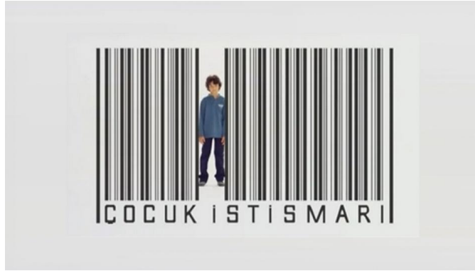
Görsel 1.10. Wenice Çocuk İstismarı Reklam

Ülkemizde çok tartışma yaratan kışkırtıcı reklam örneklerinden birisi de Wenice çocuk giyim markasının “Çocuk İstismarına Son” kampanyasıdır. Çocuk istismarı gibi toplumun oldukça hassas olduğu bir konunun reklamlarda yer alması ve bu tarz toplumsal bir sorunun ticari bir anlatım tarzı ile ele alınması oldukça tepki çekmiştir. Tabuları çiğneyen ve şok edici olan bu reklam, “çocuk istismarına son, el kadar elbiseye 55 lira, bacak kadar pantolona 45 lira isteyen markalara karşı Wenice var” şeklindedir (Görsel 1.7’de gösterilmektedir). Reklamda fiyat temelli bir faydanın hem küçük çocuklar hem de çocuk istismarı gibi hassas bir konunun bir arada kullanılarak anlatılması insanları rahatsız etmiştir. Protestolara ve şikâyetlere neden olan reklam daha sonra yayından kaldırılmıştır.