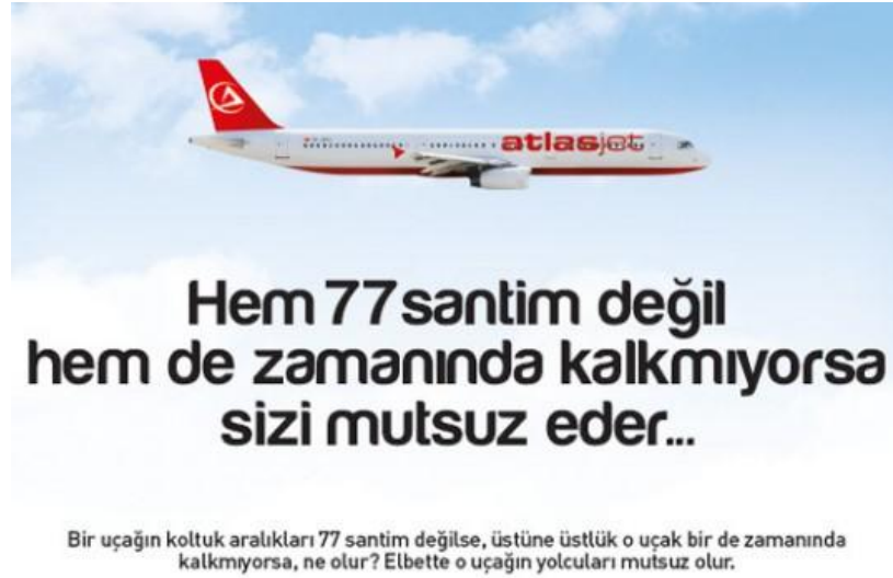
Görsel 1.11. Atlas Jet Reklam

FCUK gibi markaların, marka ismi kısaltmasıyla yapmış oldukları bir nevi sözel kışkırtıcılığı Atlas Jet markası reklamlarında kullandığı mesajlar ile yapmaya çalışmıştır. Atlas Jet havayollarının uçaklarının geniş koltuk aralıklı rahat, konforlu ve hesaplı uçuşlarının anlatıldığı “Sizinki kaç santim” reklam kampanyası oldukça dikkat çekmiştir. “ Affedersiniz, bizimki yine 77 santim oldu”, “69’u çok seveceksiniz”, “Bacaklarınızı çok seviyoruz”, “ İki tık tık bi şık şık”, “ Hem 77 santim değil hem de zamanında kalkmıyorsa sizi mutsuz eder” gibi cinsellik çağrışımlı reklam mesajlarının yer aldığı kampanya oldukça kışkırtıcı ve şok edici bulunmuştur (Görsel 1.8’de sunulmaktadır).