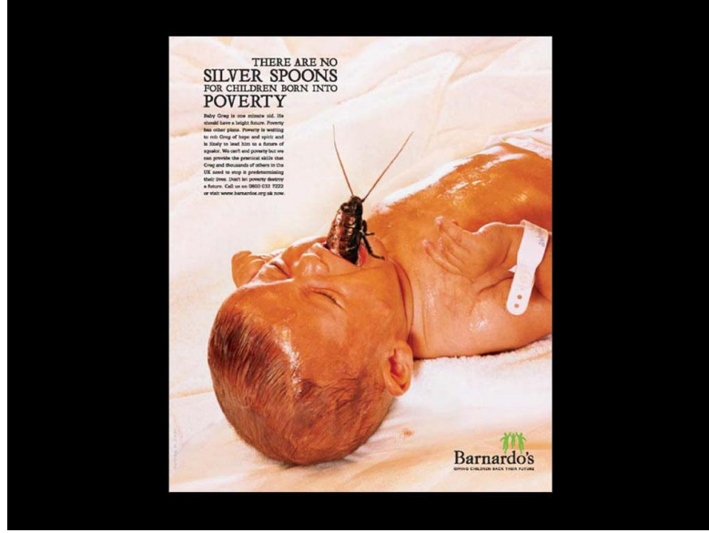
Görsel 1.8. Barnardo's Reklam