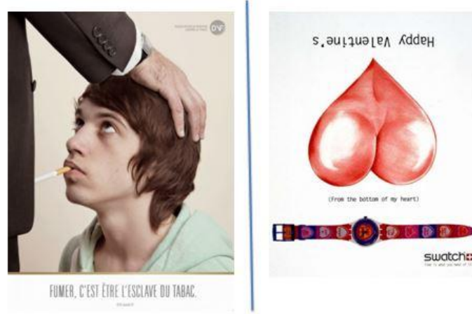
Görsel 1.3. Gizli Cinsellik Örnek Reklam

İngiliz giyim markası French Connection United Kingdom, marka isminin kısaltılmış kullanımını ile bu etkiyi sağlamaktadır. Marka reklamlarında isminin baş harflerinden oluşan FCUK kısaltmasına yer vermektedir ve reklam stratejisini de FCUK Him, FCUK Her gibi farklı konseptler ile devam ettirmektedir. Ülkemizde son dönemde ortaya çıktığı anda çok tartışılmaya başlanan AMK gazetesi de bu etkiyi temsil eden örneklerden birisidir. AMK dilimizde sıkça kullandığımız bir küfrün kısaltması olsa da, gazete bu kısaltmayı Açık-Mert-Korkusuz şeklinde açıklamaktadır.