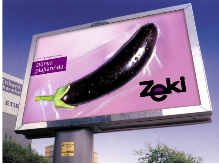
Görsel 1.12. Zeki Triko Reklam

Reklamda cinsellik çekiciliğini, çıplaklığı kullanmak isteyen ancak uygulanan yasak ve yaptırımlar dolayısıyla farklı bir reklam stratejisi izleyerek insanları şok eden, adından çokça söz ettiren marka Zeki Triko'dur. Zeki Triko, mayo reklamlarına uygulanan yasaklardan dolayı reklamlarında mankenleri kullanmak yerine farklı bir yola başvurmuştur. İlk olarak 1997 yılında uygulanan yasak üzerine reklamlarında Atatürk'ün mayolu resimlerinin yer aldığı "Güneşi Özledik" kampanyasını hazırlamıştır. Atatürk'ün mayolu olarak yer aldığı bu reklamlar olumlu ve olumsuz bir çok tepki almıştır. Daha sonra 2007 yılındaki reklam kampanyasında aynı yasağın uygulanması üzerine reklamlarında manken resimleri yerine salatalık, patlıcan, kabak gibi sebzelerin resimlerini kullanmıştır (Görsel 1.9'da yer almaktadır). Bu reklamlar da oldukça dikkat çekici olmuştur.