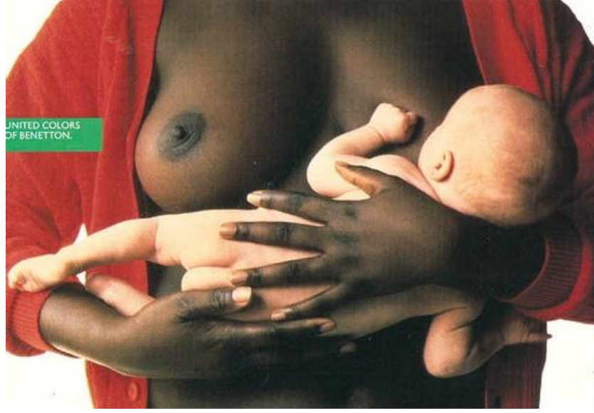
Görsel 1.4. Benetton Reklam