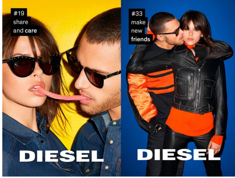
Görsel 1.5 Diesel For Successful Living Reklam