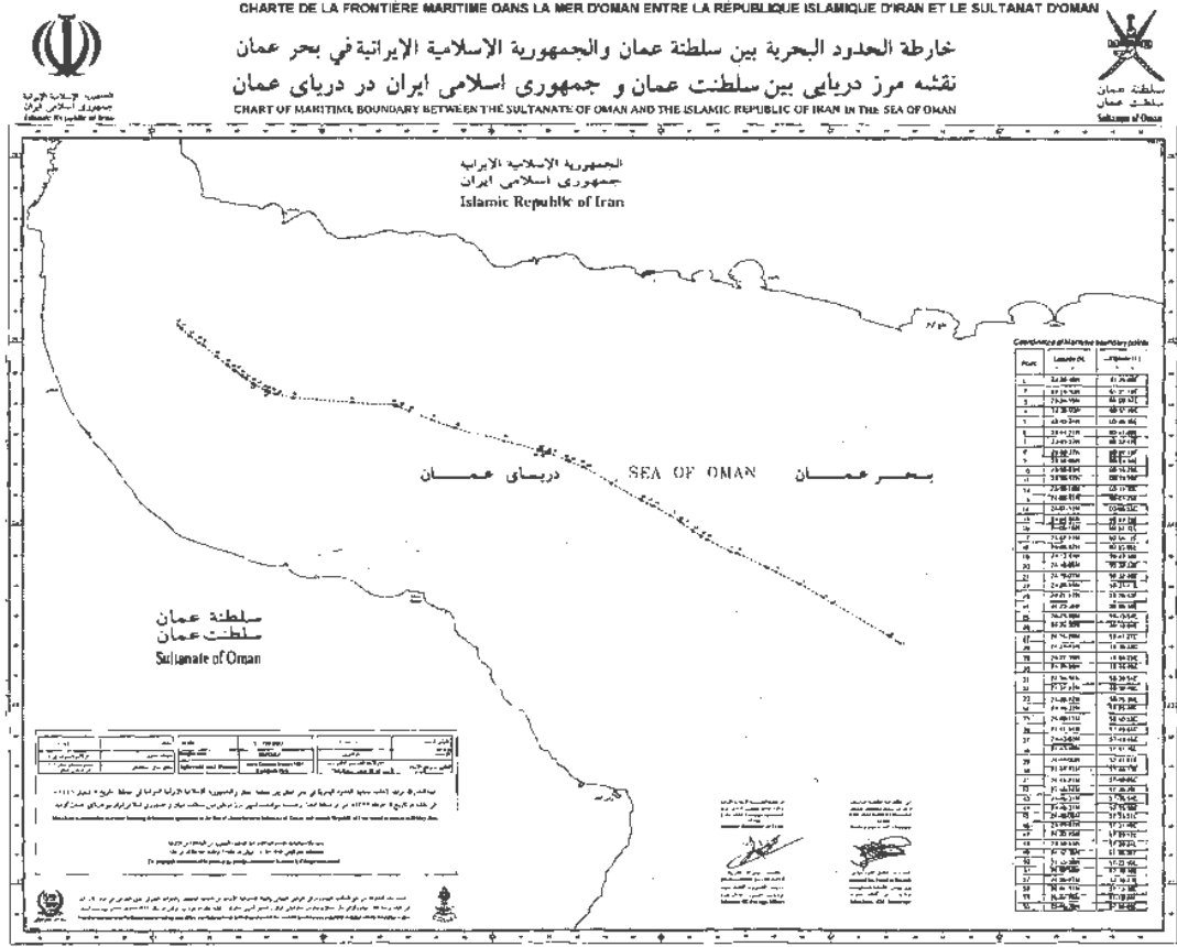
Görsel 3.1. İran ile umman arasındaki deniz sınırı

koordinatların birbirine bağlanması ile doğmaktadır. Bu durum aşağıdaki resimde daha detaylı izlenmektedir. 80