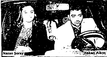
Nazan Soray Hakan Alkoç Bülent Ersoy bir süre önce hastaneye yattı. İşte bu dönemde bir dedikodu yayıldı. Alkoç, Nazan Soray ile buluşuyordu. Bu dedikodu dün gerçek oldu.