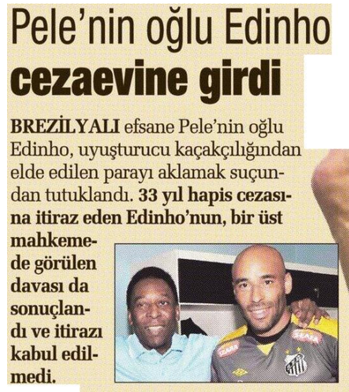
Görsel 4.19. Sabah gazetesi 20 Kasım 2014 tarihli haber

Sabah gazetesinin 20 Kasım 2014 tarihli “Pele’nin oğlu Edinho cezaevine girdi” haberinde menşei belirtilmemiştir. Bu sebeple haberin menşei kategorisi “belirtilmemiş” olarak kodlanmıştır (Görsel 4.19).