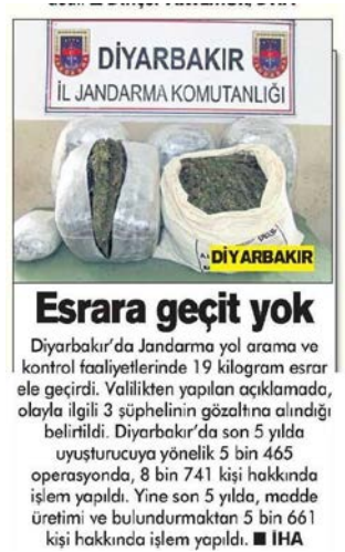
Görsel 4.40. Posta gazetesi 19 Şubat 2015 tarihli haber

Posta gazetesinin 19 Şubat 2015 tarihli “Esrara geçit yok” haberinde görsel olarak operasyonda bulunan esrar fotoğraflarına açık bir şekilde yer verilmiştir. Bu bağlamda kodlama klavuzuna görsel kategorisinde “uyuşturucu” kodlanmıştır (Görsel 4.40.).