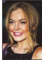
Görsel 4.23. Sabah gazetesini 10 temmuz 2013 tarihli haber