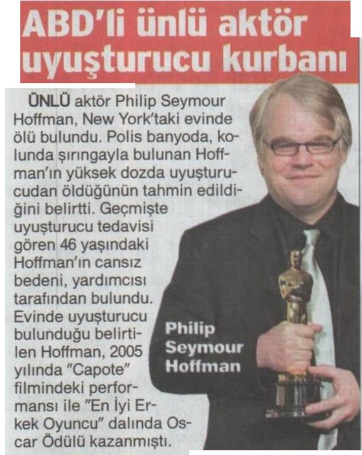
Görsel 4.15. Sözcü gazetesi 3 Şubat 2014 tarihli haber

Sözcü gazetesinin 3 Şubat 2014 tarihli “ABD’li ünlü aktör uyuşturucu kurbanı” haberi konum olarak gazetenin alt kısmında yer almaktadır. bu bağlamda haberin konum kategorisi alt olarak belirlenmiştir (Görsel 4.15).