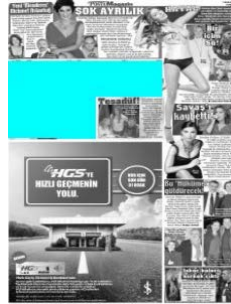
Görsel 4. 8. Posta gazetesi 1 Şubat 2013 tarihli gazete sayfası