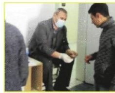
Bağımlılar mahkemeye tedavi için AMATEM'e yönlendiriliyor. Düzenli olarak yapılan denetimlerden birinde görevli numuneye barked yapıyor.

yapılan idrar testleriyle kontrol altına alınıyor. Uyuşturucu madde kullanmaktan vazgeçmeyen bağımlılar burada çeşitli yöntemlerle idrar testi sonuçlarını değiştirip para cezasından kurtuluyor. Bu yöntemlerden ilki bağımlılar arasında "Balon" yöntemi olarak adlandırılıyor. Bağımlı kişi idrar vermeye, uyuşturucu madde kullanmayan bir dublörle birlikte geliyor. Burada daha önceden hazırlanmış olan idrar torbası, şırınga ya da küçük kolonya şişesi içine temiz olan idrar yapılıyor. Litrenin onda biri kadar temiz idrar veren dublör karşılığında 100 TL alıyor.