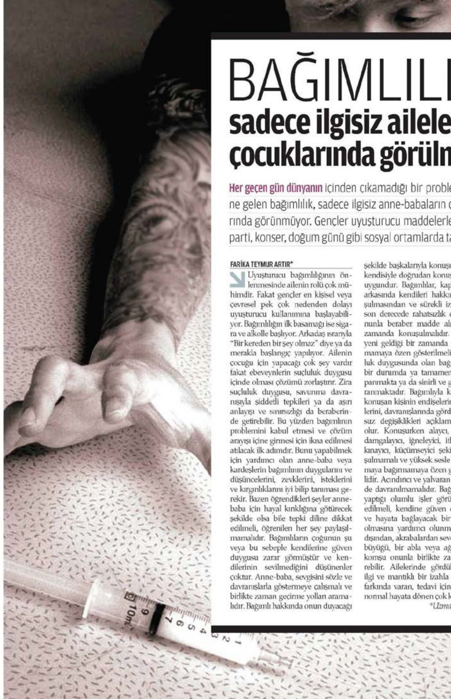
Görsel 4.36. Zaman Gazetesinin 28 Ocak 2014 tarihli haber

Zaman gazetesinin 28 Ocak 2014 tarihli “Bağımlılık sadece ilgisiz ailelerin çocuklarında görülmez” haberinde “uyarıcı/yardım isteyici (yeni bir maddeye karşı uyarı, dikkat, özen, bağımlılıktan kurtulmak için yardım isteme)” söz konusudur. Dolayısıyla bu haberde üslup kategorisinde “uyarıcı/yardım isteyici” üslup kodlanmıştır (Görsel 4.36).