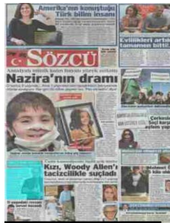
Görsel 4.16. Sözcü gazetesi 3 Şubat 2014 tarihli gazete sayfası