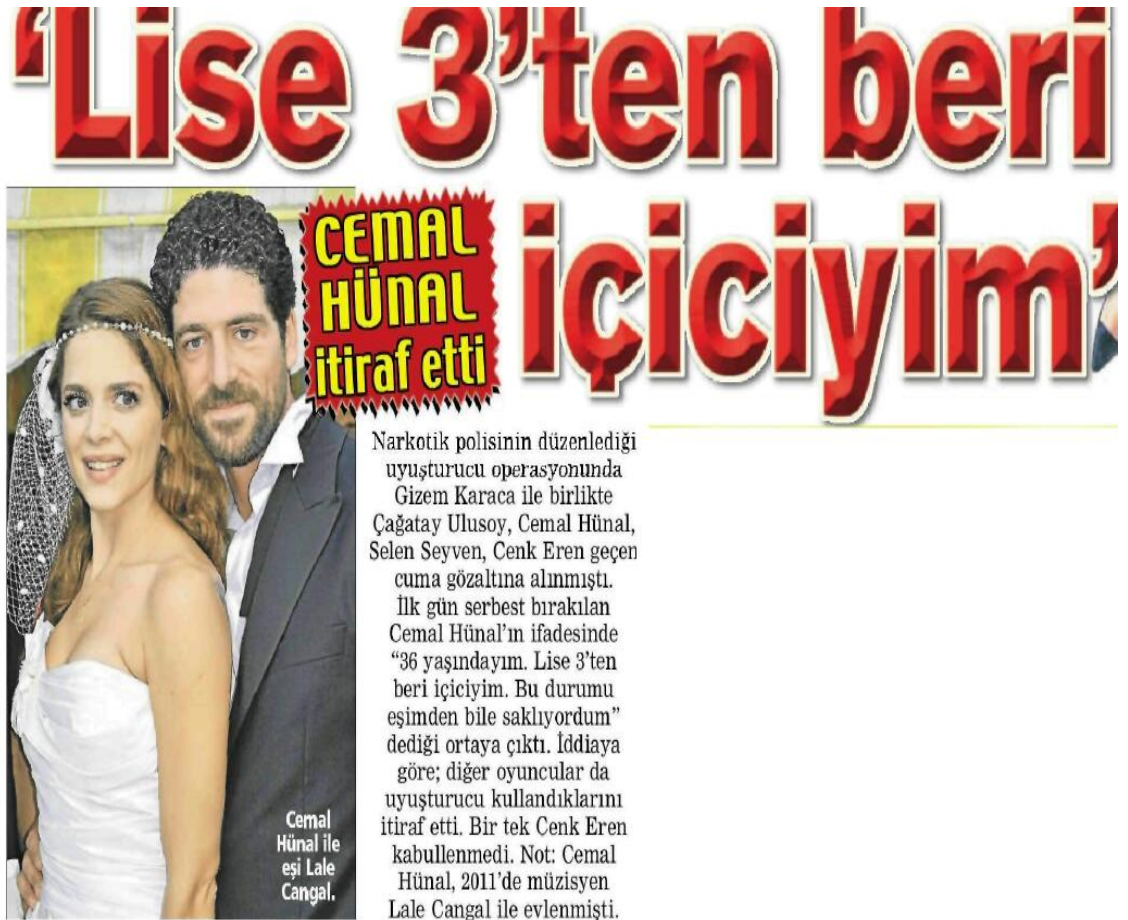
Görsel 4. 7. Posta gazetesi 1 Şubat 2013 tarihli haber

Posta gazetesinin 1 Şubat 2013 tarihli “Lise 3’ten beri içiciyim” haberinde haber metni gazete sayfasının orta/göbek olarak adlandırılan bölümüne yerleştirilmiştir ve kodlama klavunda da “orta/göbek” olarak kodlanmıştır (Görsel 4. 7).