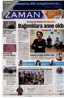
Görsel 4.10. Zaman gazetesi 6 Aralık 2015 tarihli gazete sayfası

Zaman gazetesinin 9 Aralık 2013 tarihli “Uyuşturucu kullanan öğrencilere yardım eli uzanmıyor” haberi gazetenin sürmanşet olarak adlandırılan bölümünde yer aldığı için konum kategorisinde “sürmanşet” olarak kodlanmıştır. Ayrıca haberin detay kısmı gazetenin dördüncü sayfasında yer almaktadır (Görsel 4.11).