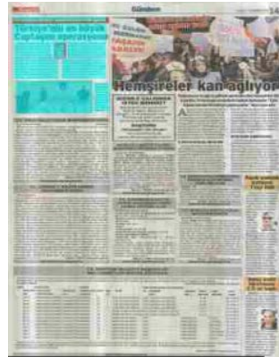
Görsel 4.14. Sözcü gazetesi 21 Kasım 2015 tarihli gazete sayfası