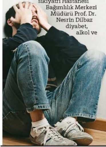
Görsel 4.32. Hürriyet Gazetesi 14 Ocak 2015 tarihli haber

TEDAVİDE, alkol bağımlılarında disülfiram, eroin bağımlılarında ise naltrekson implantları takılıyor. Naltrekson, eroinin gelip yapıldığı reseptöre (alıcı) yapışıyor. Eroinin yapışacağı yeri kısmen işgal ettiği için hasta tekrar kullanmak istemiyor. Disülfiram ise alkolün yıkılmasını sağlayan bir enzimi bloke ediyor. Hasta ilaca rağmen alkol alırsa, alkol vücutta yıkılıp atılmadığı için çok hızlı bir biçimde alkol zehirlenmesi yaratabiliyor. Bu bilginin paylaşıldığı hasta, alkol almaktan cayıyor.