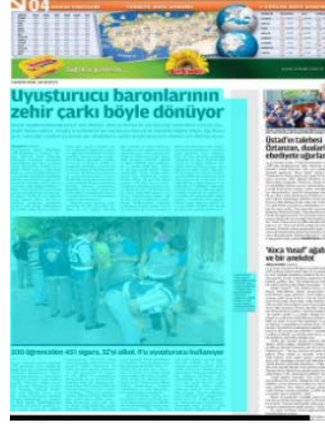
Görsel 4.18. Zaman gazetesi 3 Kasım 2013 tarihli gazete sayfası