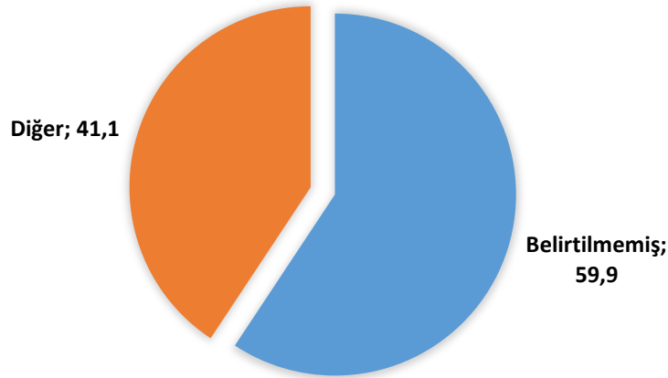
Şekil 4.1. Haber/bilgi kaynaklarının belirtilme ve belirtilmeme durumu

Uyuşturucu haberlerinin bilgi kaynaklarının kim ya da hangi kurum/kuruluşlar olduğuna ilişkin veriler Tablo 4.7.’de sunulmaktadır. Buna göre incelenen haberlerin yarısından fazlasında ( f=214 ; %59,9) haber/bilgi kaynağı belirtilmemiştir. Sonuç olarak incelenen haberlerin yarısından fazlasında haber kaynağının olmadığı ya da belirtilmediği anlaşılmıştır. Bunun yanı sıra kalan haber kaynaklarının tümü de verilerinde anlamlı bir değişim olmadığı için “diğer” kategorisinde toplanmıştır ( f=186 ; %41,1).