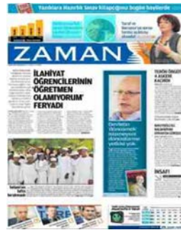
Görsel 4.12. Zaman gazetesi 9 Aralık 2013 tarihli gazete sayfası

Sözcü gazetesinin 21 Kasım 2015 tarihli “Türkiye’nin en büyük captagon operasyonu” haberinde konum olarak gazetenin üst kısmı tercih edilmiş, haber kodlama klavuzuna da “üst kısım” olarak kodlanmıştır (Görsel 4.13).