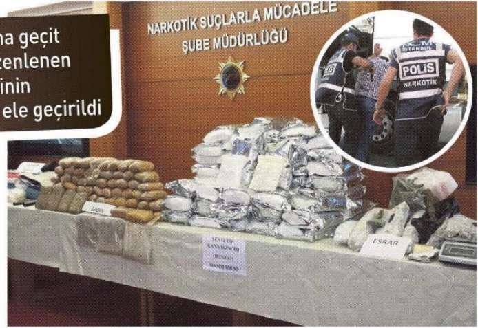
Fatih ve Avcılar’da uyuşturucu satıcılarına yönelik düzenlenen operasyonlarda ise 37 kilogram eroin, 210 gram kokain, 400 adet extacy, 625 gram esrar ele geçirildi, 1 kişi gözaltına alındı.

İstanbul Narkotik Suçlarla Şube Müdürlüğü ekipleri 18 Temmuz 2014 tarihinde yapılan operasyonda 5 ton 500 kilogram bonzai yapılabilecek 56 kilogram hammadde ele geçirdi, operasyonda gözaltına alınan şüpheliler Eray D. (33) ve Mehmet S.Ş. (39) çıkarıldıkları mahkemece tutuklandı. Bu iki bonzai baronunun uyuşturucu faaliyetlerini araştırmaya devam eden Narkotik Polisi, 9 Ağustos’ta ikilinin Ümraniye’de depo olarak kullandıkları bir evi tespit ederek baskın yaptı. Operasyonda bugüne kadar en fazla miktar ve ağırlıkta ele geçirilen bonzai yapımında kullanılan kimyasal fubinica bulundu. 120.40 kilogram ağırlığındaki bu hammadde 12 ton bonzainin elde edildiği öğrenildi.