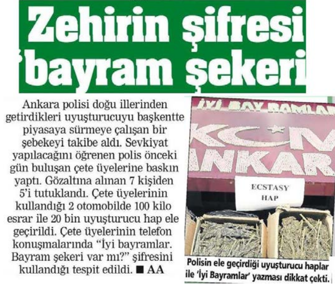
Görsel 4.38. Posta gazetesini 14 Ağustos 2013 tarihli haber

Posta gazetesinin 14 Ağustos 2013 tarihli “Zehirin şifresi bayram şekeri” haberinde tema olarak operasyon, uyuşturucunun türü ve ekonomik, ticari boyutunun kullanıldığı belirlenmiştir. Bu bağlamda tema kategorisinde “operasyon”, “ekonomik ve ticari boyut”, “uyuşturucunun bağımlılığın türü” kodlanmıştır (Görsel 4.38).