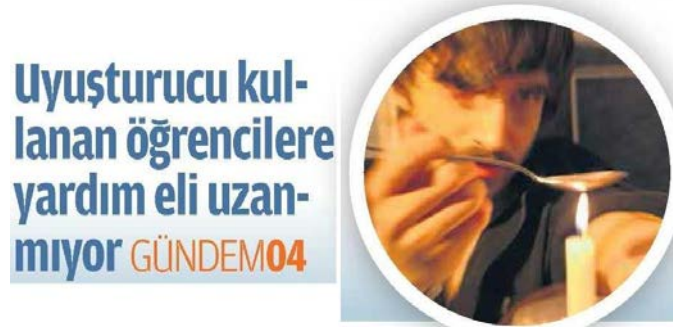
Görsel 4.11. Zaman gazetesi 9 Aralık 2013 tarihli haber

Zaman gazetesinin 9 Aralık 2013 tarihli “Uyuşturucu kullanan öğrencilere yardım eli uzanmıyor” haberi gazetenin sürmanşet olarak adlandırılan bölümünde yer aldığı için konum kategorisinde “sürmanşet” olarak kodlanmıştır. Ayrıca haberin detay kısmı gazetenin dördüncü sayfasında yer almaktadır (Görsel 4.11).