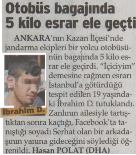
Görsel 4.22. Sözcü gazetesini 22 Haziran 2013 tarihli haber

Sözcü gazetesinin 22 Haziran 2013 tarihli “ Otobüs bagajında 5 kilo esrar ele geçti” haberinin menşei olarak muhabir adı ve ajans verilmiştir. Bu bağlamda haberin menşei kategorisine hem “muhabir adı” hem de “ajans haberleri” kodlanmıştır (Görsel 4.22).