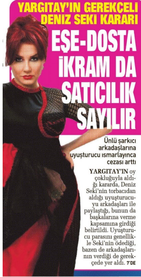
Grsel 4.41. Sabah gazetesi 27 Mayıs 2014 tarihli haber

kullanılmıştır. Kodlama klavuzunun görseller kategorisine de “nl kiiler” kodlanmıtır (Grsel 4.41).