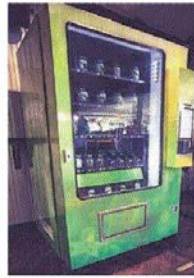
Görsel 4.39. Sabah gazetesini 5 Şubat 2015 tarihli haber

ESRAR kullanımının ABD'nin bazı eyaletlerinde kısmen yasal hale gelmesinin ardından Seattle şehrindeki bir bakımevine konulan marihuana otomatı dün hizmete girdi. “ZaZZZ” isimli makine, müşterilerin kimlik bilgilerini alarak maddeyi kullanmasında bir sakınca olup olmadığını denetledikten sonra paket halindeki esrarı veriyor. İçinde kendir yağı şişesi gibi uyuşturucu ve enerji verici başka maddelerin de bulunduğu otomattan bir paket esrar almak için 15 dolar ödemek gerekiyor. DİŞ HABERLER