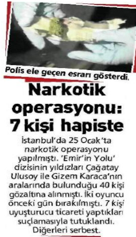
Görsel 4.28. Posta gazetesi 30 Ocak 2013 tarihli haber

Posta gazetesinin 30 Ocak 2013 tarihli "Narkotik operasyonu: 7 kişi hapiste" haberinde dil ve anlatım özellikleri olarak halk dilinin kullanıldığı belirlenmiştir. Bu bağlamda dil ve anlatım özellikleri kategorisinde "halk dili" kodlanmıştır (Görsel 4.28).