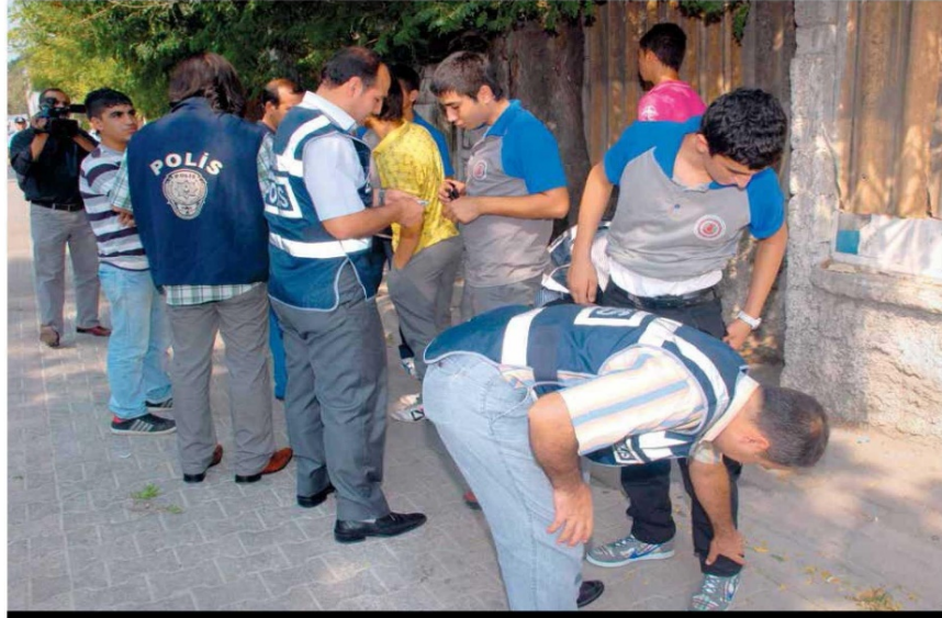
Istanbul'da 154 lisede yapılan araştırmada meslek liselerinde sigara, Anadolu liselerinde ise alkolün daha fazla tüketildiği ortaya çıktı. Uyuşturucu madde kullanım oranlarının ise sürekli arttığı tespit edildi.

daha kolay açılacaksın. Bak şu kişiler de uyuşturucu kullanıyor.” Çetelerin ayrıca gençlerin ‘hayır’ çıkılama kısı da bazı söylemler geliştirdiği raporlarda yer alıyor. Bununla ilgili olarak da şu bilgiler veriliyor: “Sen gidince buranın tadı tuzu kaçır. Eğer gidersen bir daha yüzüne bakmam. Ne olur hatırım için bir kez, beni kirama. Kesinlikle seni bırakmayız. Hadi süt çocuğu sen de, ana kuzusu.” Çocuklarda bağ ve bağımlılığın anne ile başladığını belirtiltiği çalışmada, çocuklar ile ebeveyn arasında sağlıklı iletişim kurulmaması halinde bazı sorunların baş göstereceğine dikkat çekiliyor. Çocuklarda bazı değişikliklerin tespit edilmesinde ise hemen sağlık birimleri ile irtibata geçilmesi tavsiyesinde bulunuluyor.