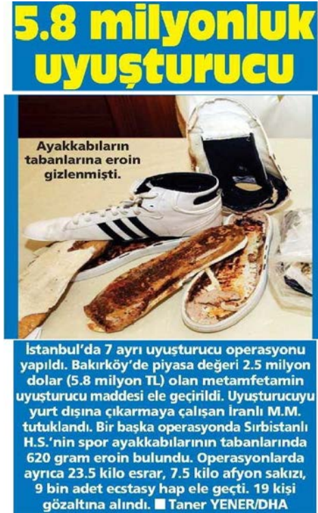
Görsel 4.1. Posta gazetesini 30 Aralık 2014 tarihli haberi

Posta gazetesinin 30 Aralık 2014 tarihli “5.8. Milyonluk Uyuşturucu” haberinde uyuşturucu kaçakçılığı olayı haber metni düzeninde yazılmıştır. Dolayısıyla yazı türü kategorisi olarak olarak “haber” kullanılmıştır (Görsel 4.1).