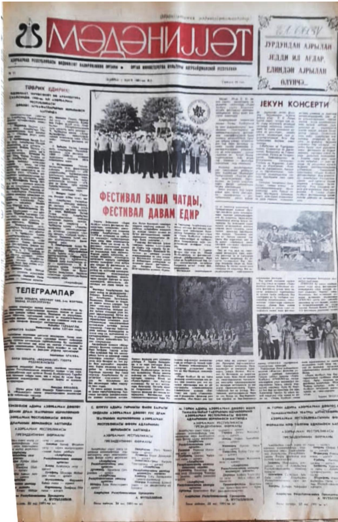
Kaynak: Medeniyet Gazetesi, 16 Mart 1973, 1.