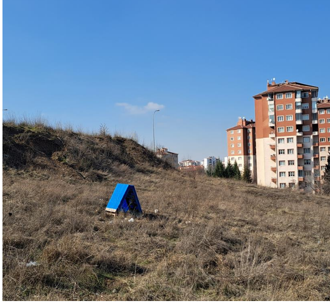
Görsel 7.2. Sokak köpeklerinin barınması için inşa edilen barınaklar

Eskişehir şehir merkezinde sokak köpekleri için çok sayıda konulan köpek kulübeleri bulunur. Burada “köpek kulübesi” ifadesini; Eskişehir Büyükşehir Belediyesi , Tepebaşı Belediyesi ve Odunpazarı Belediyesi tarafından sağlanan, kamu kaynakları kullanılarak ya da farklı Sivil Toplum Kuruluşları, gönüllü kuruluşlar ve özel işletme sahipleri ile yapılan iş birlikleri aracılığıyla üretilen; standart bir tasarıma sahip, su geçirmez, dayanıklı malzemelerden yapılmış ve çoğu Eskişehir Büyükşehir Belediyesi logosu ve/veya ilçe belediyesinin veya Eskişehir Kent Konseyi'nin adını taşıyan logolarla işaretlenmiş yapıları ifade etmek için kullanıyorum. Bu kulübeler, çoğunlukla Park ve Bahçeler Müdürlüğü çalışanları tarafından parklar, meydanlar, muhtarlık binalarının etrafı gibi uygun görülen kamusal alanlara yerleştirilmektedirler.