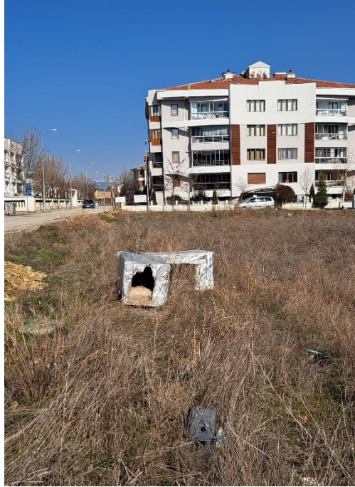
Görsel 7.1. Sokak köpeklerinin barınması için inşa edilen barınaklar

Sokak köpeklerinin barınma ihtiyacı Eskişehir Büyükşehir Belediyesi tarafından sağlanan köpek kulübelerinin kullanılması ya da insanlar tarafında inşa edilen barınakların kullanması aracılığıyla karşılanmaktadır.