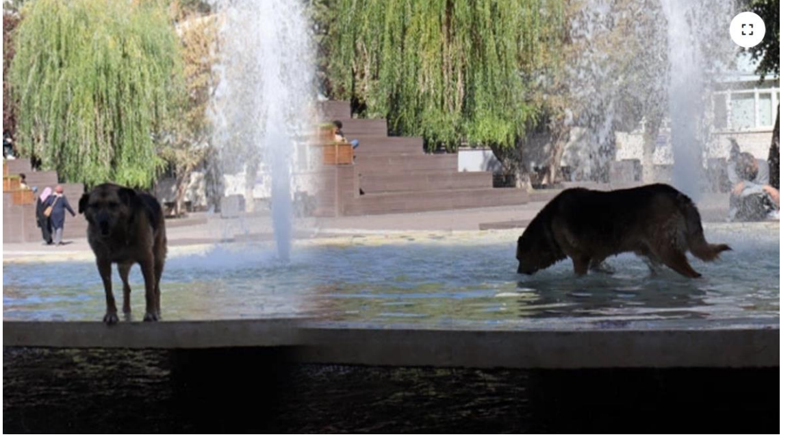
Görsel 7.10. Eskişehir'deki süs havuzunu serinlemek için kullanan sokak köpekleri. https://www.esyeniGUN.com/eskisehirde-sus-havuzundaki-bu-goruntu (Erişim tarihi 12.09.2023)

Aşağıdaki görsel ise, sokak köpeklerinin sıcak yaz günlerinde süs havuzunu kullanarak serinlediklerini gösteren bir haberden alınmıştır.