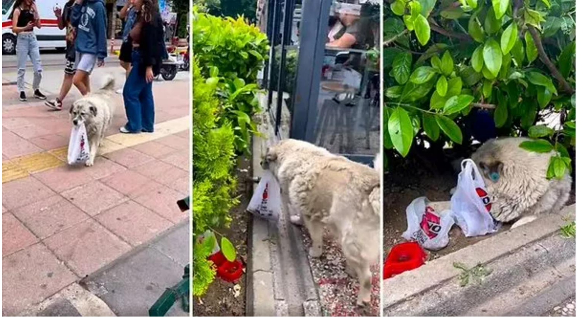
Görsel 7.14. Sokak köpeği Koyun. https://onedio.com/haber/eskisehir-de-her-gun-restoranin-onune-birakilan-posetteki-kuru-mamayi-teslim-alip-evine-getiren-kopek-1083627 (Erişim tarihi 22.10.2023).

Yine aynı caddedeki özel bir işletmeden mamasını poşetle alıp yaşadığı alana götürmesiyle bilinen Koyun