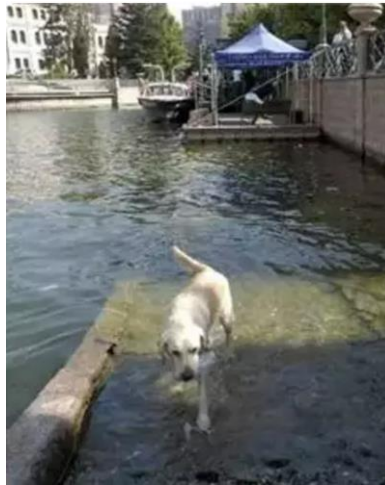
Görsel 7.11. Eskişehir'de belediyenin Porsuk Çayı'nı temizleme faaliyetine katılan bir sokak köpeği. https://www.milliyet.com.tr/yerel-haberler/eskisehir/porsuk-cayi-onunla-daha-temiz-10354330 (Erişim tarihi 21.10.2023).

Sokak köpekleri ayrıca kentteki gündelik hayatın da bir parçası haline gelmektedir. Aşağıdaki görsel, Eskişehir Büyükşehir Belediyesi temizlik ekibiyle birlikte Porsuk Çayı'ndan pet şişe toplayan sokak köpeğini konu alan haberden alınmıştır.