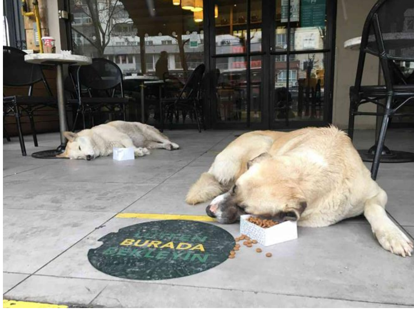
Görsel 7.8. Eskişehir’de soğuktan korunmak için kafeleri kullanan sokak köpekleri. https://www.sabah.com.tr/eskisehir/2021/12/21/soguk-havadan-etkilenmemek-icin-kafeye-siginan-sokak-kopekleri-ic-isitti (Erişim tarihi 30.10.2023).