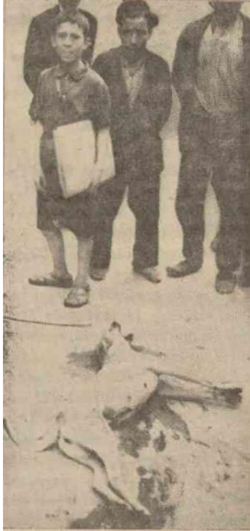
Grsel 4.1. Sokakta tfekle vurulan kpek. Kpek avı: Gpe, gndz, Darlfnn meydanında. ... (1929, 21 Mart). Vakit .

alıřanlarını tfeklerle dolařırken grmek, silah sesleri duymak ve kamusal alanlarda sokak kpeklerinin vurularak ldrlmesine tanık olmak, yntemle ilgili bir uygunsuzluk hissi yaratmıřtır. Buna ek olarak, sokak kpeklerinin l bedenlerinin vuruldukları yerlerde bırakılması da Őikyetlerin kaynađı olmuřtur 16