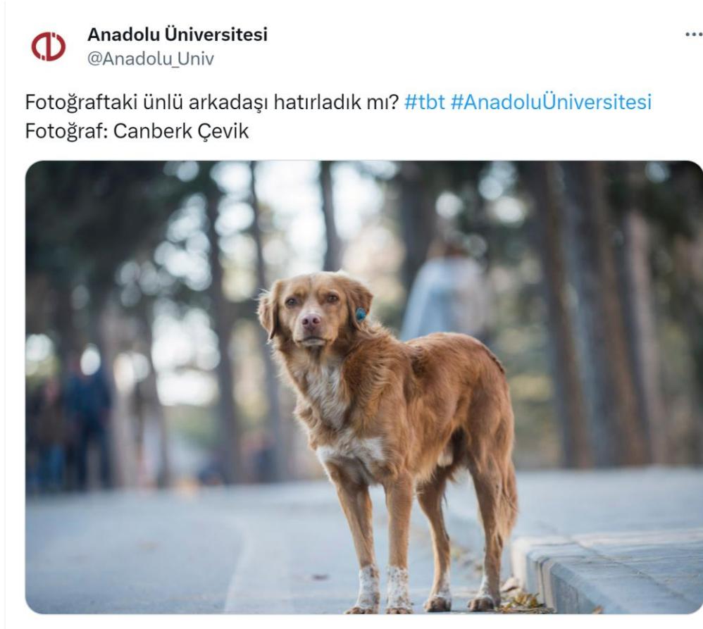
Görsel 7.12. Anadolu Üniversitesi Yunus Emre Kampüsü'nün sevilen köpeklerinden Tarçın.

Bir başka haber 37 oyuncakçıdan pelüş oyuncak çalan sokak köpeğini ele alırken, bir diğeri soğuktan korunmak için otogara sığınan sokak köpeklerini 38 , sokak köpeklerini sahiplenen devlet okullarını 39 ele almaktadır. Kimi durumlarda sokak köpekleri yaşadıkları çevrede o kadar tanınır, benimsenir ve gündelik hayatın bir parçası haline gelirler ki bu mekânların bir parçası ve buralarda yaşayan diğerk sokak köpeklerinin de bir temsiline dönüşürler. Örneğin, çalıştığım Anadolu Üniversitesi'nde hem öğrenciler hem de akademik ve idari personel tarafından bilinip sevilen Tarçın isimli sokak köpeği: