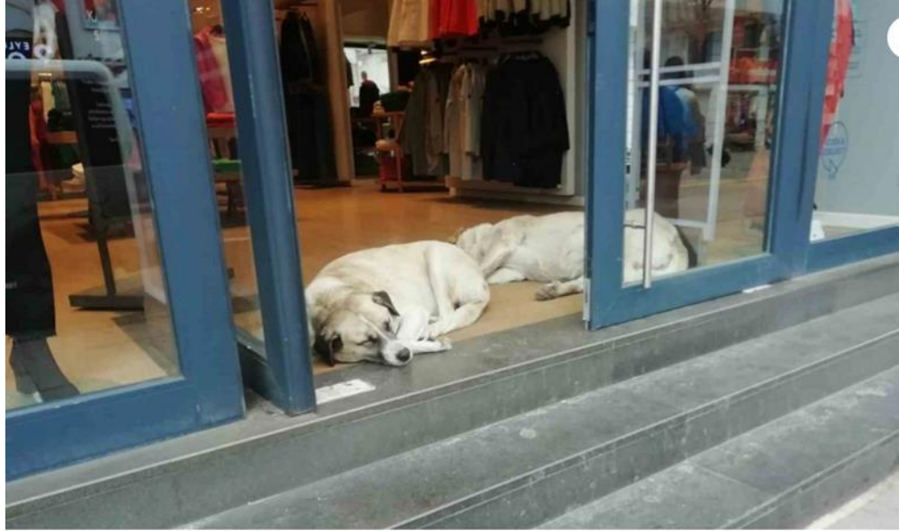
Görsel 7.7. Eskişehir’de soğuktan korunmak için mağazaları kullanan sokak köpekleri. https://www.esgazete.com/sokak-hayvanlari-soguktan-boyle-korundu (Erişim tarihi 05.11.2023).