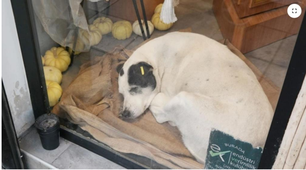
Görsel 7.9. Eskişehir’deki bir dükkânda barınan sokak köpeği. https://www.esyenigun.com/can-dostlar-ic-isitti (Erişim tarihi 02.11.2023).