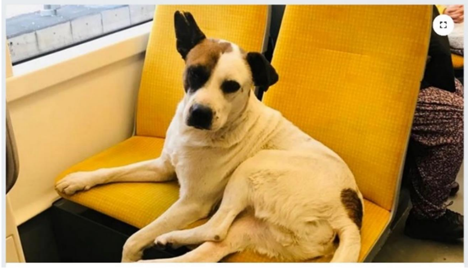
Görsel 7.4. Eskişehir'de tramvaya binen sokak köpeği. https://www.eskisehirhaber.com/eskisehirde-tramvayin-sevimli-yolcusu-hem-isindi-hem-de-yolculuk-yapti (Erişim tarihi 03.11.2023)