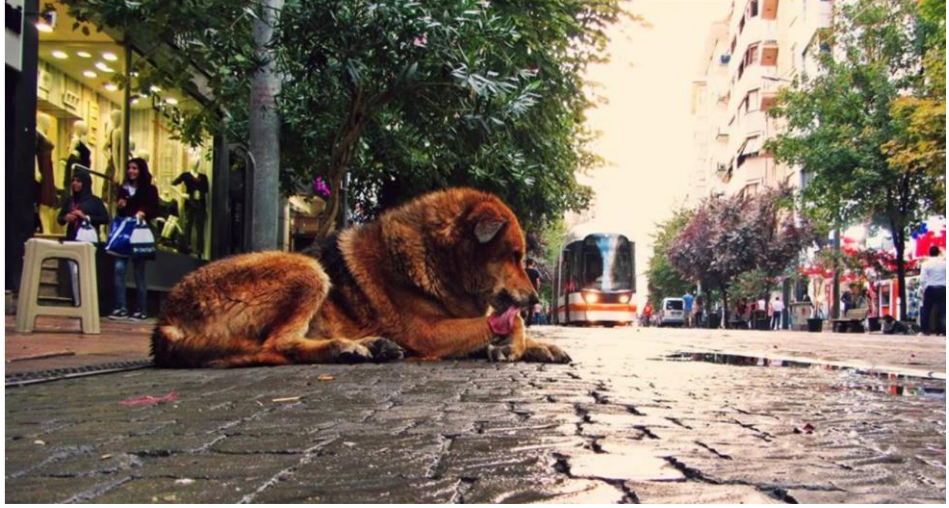
Görsel 7.13. Namık, Eskişehir'in sevilen ve tanınan sokak köpeklerinden biri.

Eskişehir kent merkezinde yer alan, Eskişehir'in en işlek caddelerinden biri olan İsmet İnönü 1 caddesinin sevilen sokak köpeklerinden biri, Namık