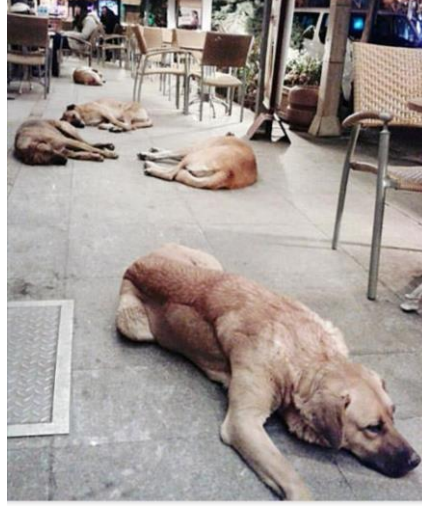
Görsel 7.6. Eskişehir’de ısınmak için kafeleri kullanan sokak köpekleri. https://www.sabah.com.tr/yasam/eskisehirden-insanlik-fotografi-3378787 (Erişim tarihi 01.11.2023).

Sokak köpekleri aynı zamanda kent içerisinde bulunan kafe, dükkân gibi ticari işletmeleri de sıklıkla kullanmaktadır.