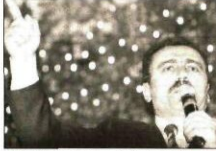
BBP lideri Yazıcıoğlu, partililere hitap etti.