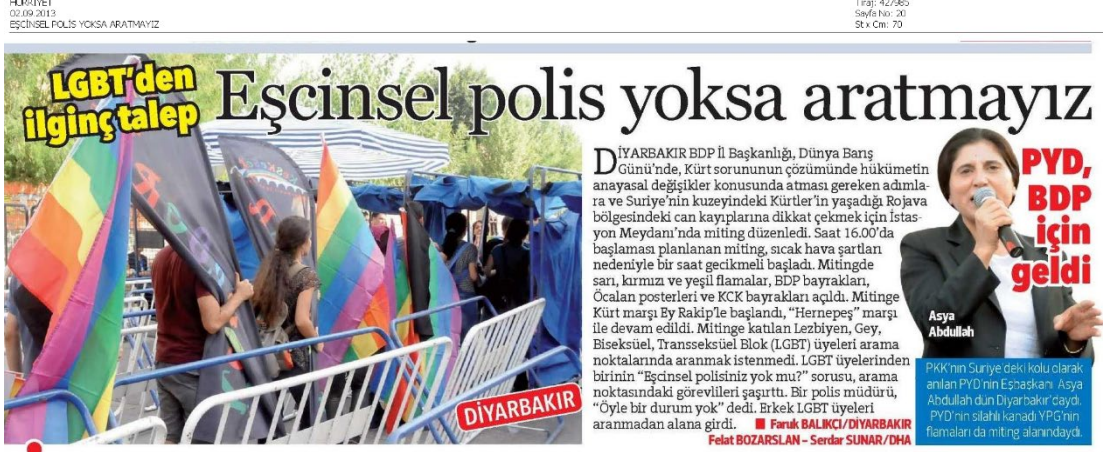
Görsel 4.25. LGBTİ+ ile ilgili atılan başlıkla okuyucu bakış açısının sınırlandırılmasına örnek haber

“eşcinsellik” birleştirilmiştir. Yine aynı haberin sağ köşesinde bulunan ve terör örgütü statüsünde olan PYD’de, haber aktörlerine bakış açısını dönüştürdüğü söylenebilir.