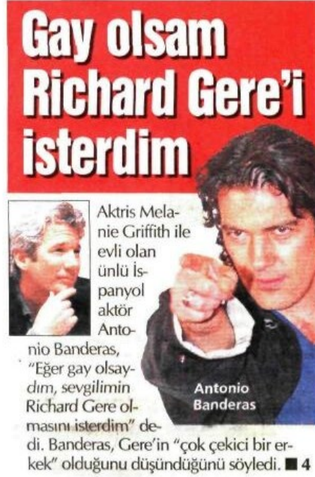
Görsel 4.20. LGBTİ+ 'ların "cinsel obje" imajlarının pekiştirildiği haber örneği