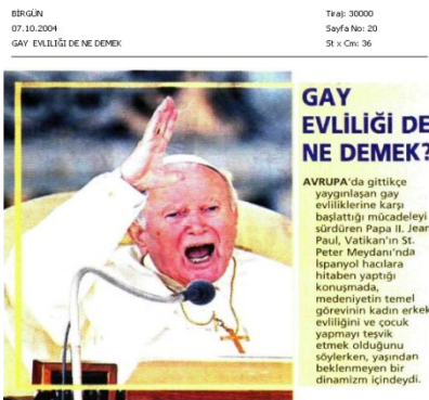
Görsel 4.7. Eşçinselleri aileyi tehdit eden bir unsur olarak temsiline haber örneği.

Hürriyet gazetesi (22.02.2004), California eyalet valisi Terminatör filminin başrol oyuncusu Arnold Schwarzenegger’in eşçinsel evlilikleri eleştirisini içeren haberi şu başlıkla haber yapmıştır: “Terminatör, Eşçinsel Nikahlara Çok Kızdı.” California eyalet valisi olarak Schwarzenegger, San Francisco kentinde gay ve lezbiyen çiftlerin nikahlarının kıyılarak evlilik cüzdanı verilmesine tepki duymaktadır. Haberde San Francisco belediye başkanı, California eyalet anayasasında cinsiyet temelli ayrımcılığın yasaklandığı gerekçesiyle eşçinsel çiftlere evlilik cüzdanının verildiğini belirtmesine rağmen haberin başlığına bu ifade çıkarılmamakta, eşçinsel nikahlara öfke öne çıkarılmaktadır.