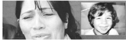
Görsel 4.15. Birgün gazetesinin 13.06.2012 tarihli haberinde homofobik tavır alan bir siyasiyi "gerici" sıfatı ile sunma örneği