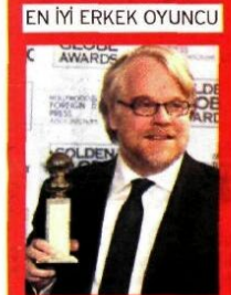
'Capote' filmiyle Philip Seymour Hoffman ödül aldı