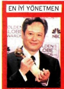
4 ödüllü 'Brokeback Mountain' filminin yönetmeni Ang Lee.