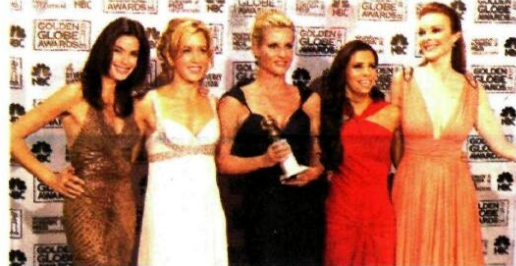
'Desperate Housewives' da En İyi Komedi Dizisi ödülüne layık görüldü.