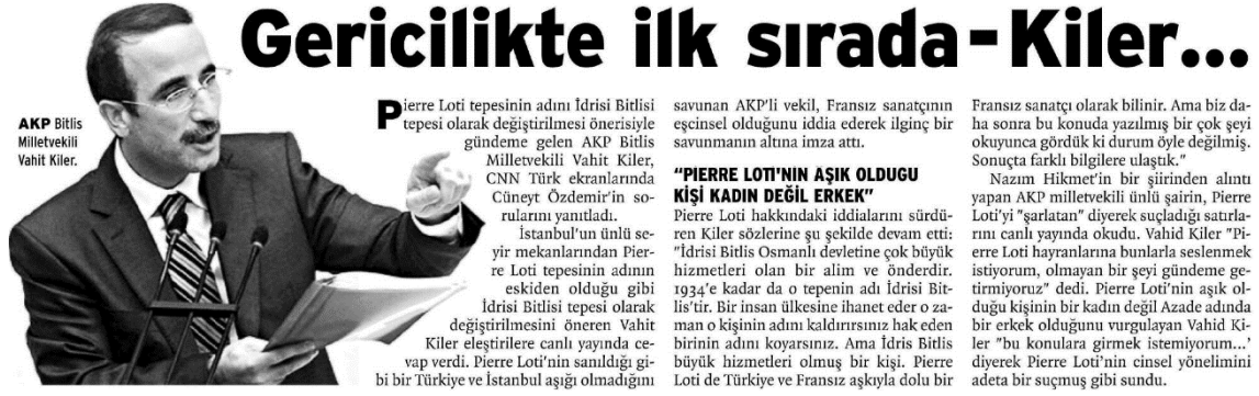
Görsel 4.14. Birgün gazetesinin 13.06.2012 tarihli haberinde homofobik tavır alan bir siyasiyi "gerici" sıfatı ile sunma örneği

BİRGÜN 19.02.2013 LEZBİYENLERDEN KURTARMA TİMİ