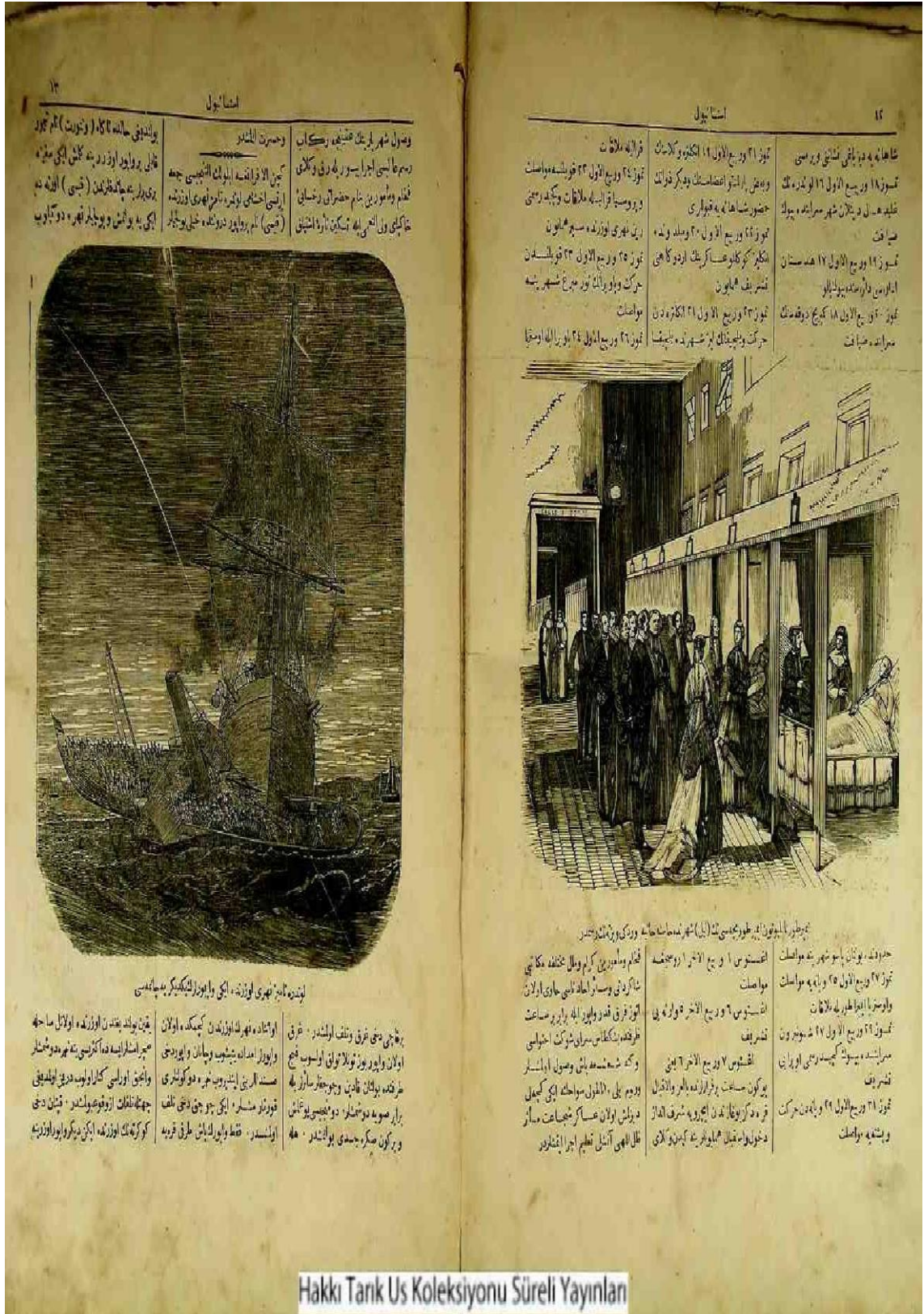
Hakkı Tarık Us Koleksiyonu Süreli Yayınları

Kaynakça: Hakkı Tarık Us Dijital Koleksiyonları