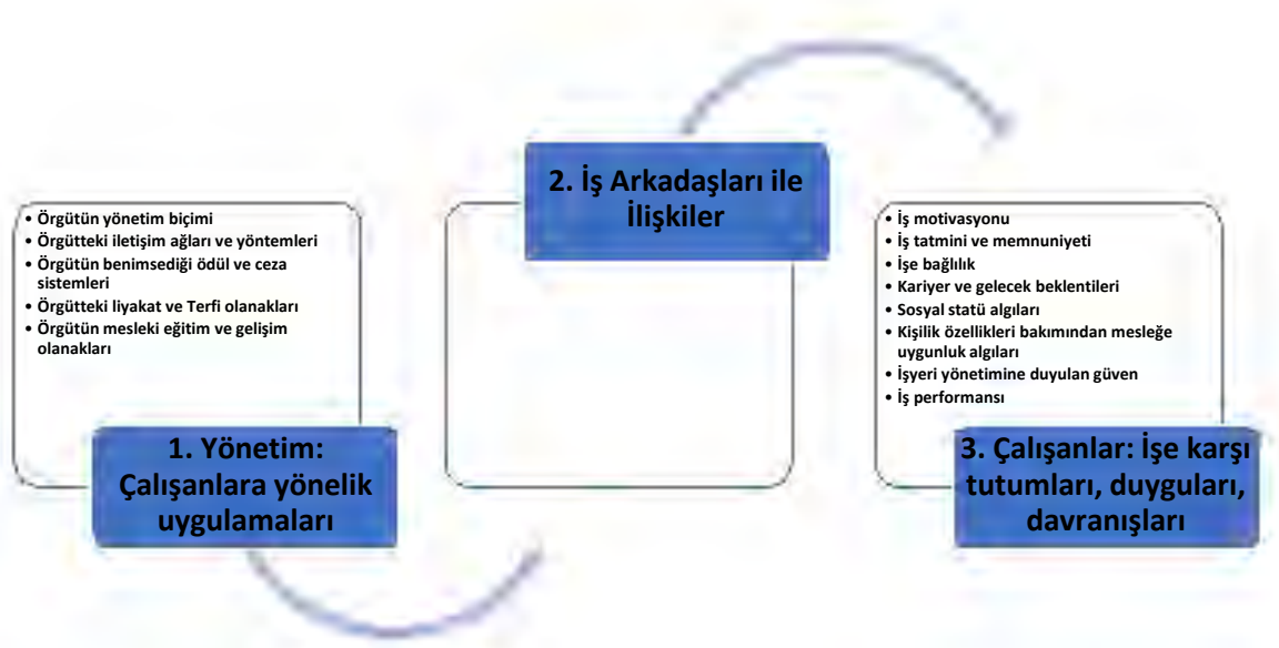
Şekil 1. Örgüt kültürü ve ikliminin unsurları

görülebileceği üzere örgüt kültürü ve iklimini yönetimin çalışanlara yönelik uygulamaları, iş arkadaşları ile ilişkiler ile çalışanların işe karşı tutumları, duyguları ve davranışları oluşturmaktadır.