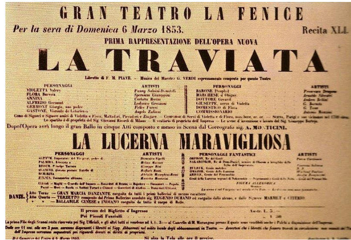
Görsel-4: La Traviata, Gala Afışı

Operanın ilk performansı 6 Mart 1853'te gerçekleşmiştir ve sonrasında sekiz kez daha sahnelenmiştir. O dönemdeki basına göre, opera ilk performansta başarısız olmuştur. Cesare Vigna, Gazzetta musicale di Milano'da, seyircilerin eserin inceliklerini anlamadığını yazmıştır (9 Mart 1853). Verdi, ilk temsil öncesinde operanın halkı memnun etmeyeceğini önceden hissetmişti. Şirketin, özellikle de Fanny Salvini-Donatelli'nin (prömiyerde Violetta karakterini seslendiren soprano) sağlıklı fiziği ile Violetta'nın veremli kırılganlığı örtüşmediği için uygun olmadığını düşündü; ve sansürün isteğiyle günümüzden XIV. Louis dönemine kadar olan dekorları değiştirmek zorunda kaldığı konuda kesinlikle fikir ayrılıkları vardı. Bir yıl sonra, 6 Mayıs 1854'te opera, bu kez San Benedetto Tiyatrosu'nda tekrar sahnelendi. Bu performans için Verdi, kadroyu ve eserin bazı bölümlerini değiştirdi, ancak dekorlar aynı kaldı. La Traviata'nın yeni versiyonu başarılı oldu ve birçok makale, halkın operaya övgü dolu eleştiriler yönelttiğini doğruladı. Bu performanstan sonra, La Traviata, Rigoletto ve Il Trovatore ile birlikte İtalya ve tüm Avrupa'nın kalıcı repertuarının bir parçası olmuştur (Wenderoth, 1995, s. 1).