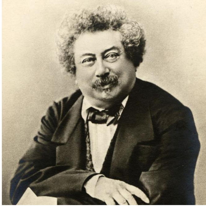
Görsel-2: Alexandre Dumas