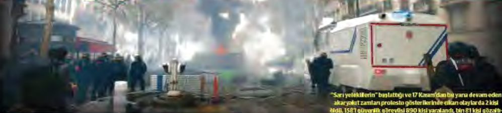
"Sarı yeleklilerin" başlattığı ve 17 Kasım'dan bu yana devam eden akaryakıt zamları protestin göstericilerine çıkan olaylarda 2 kişi öldü, 1587 güvencilik gösterisi 690 kişi yaralandı, bin 81 kişi gözaltına alındı ve 9 eylemci dört ay hapis cezasına çarptırıldı.