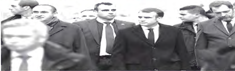
Macron, Champs-Elysees'de inceleme yaptı.

Öte yandan, önceki geceki bazı protestocuların Paris'in sembolü Zafer Takı'ndaki Marianne heykeline zarar verdikleri belirtildi. Ülkenin güneyindeki protestolarda meydana gelen trafik kazasında da bir motor sürücüsünün yaşamını yitirdiği açıklandı.