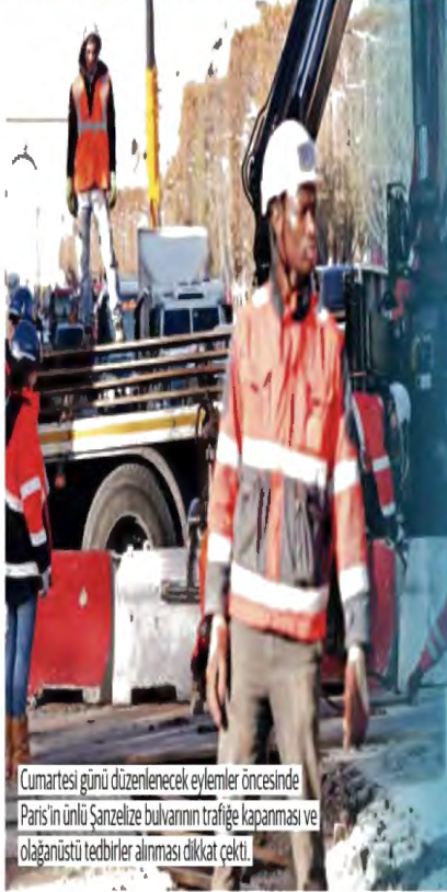
Cumartesi günü düzenlenecek eylemler öncesinde Paris'in ünlü Şanzelize bulvarının trafiğe kapanması ve olağanüstü tedbirler alınması dikkat çekti.