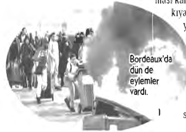
Bordeaux'da dün de eylemler vardı.

Yeni vergilerle yılbaşından itibaren petrolün litre fiyatının 2.9 Avro cent, dizelin litre fiyatının ise 6.5 Avro cent artırılması kararının ertelenmesi konusunda Fransız parlamentosunun bugün bir oylama yap-