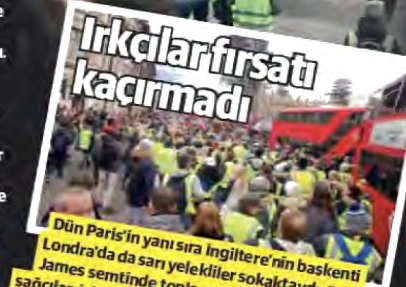
Dün Paris'in yanı sıra İngiltere'nin başkenti Londra'da da sarı yelekliler sokaktaydı. Saint James semtinde toplanan ve sarı yelekliler aşırı sağcılar, İslam ve göçmen karşıtı pankartlar taşıdı.