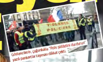
Göstericilerin, çoğunlukla "Polis şiddetini durdurun" yazılı pankartlar taşıması dikkat çekti.