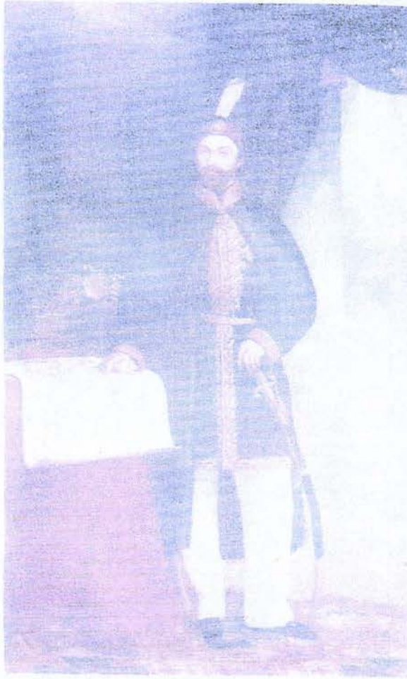
Resim 4. II. Mahmut'un Boy Resmi. Tuval Üzerine Yağlıboya (Ebat Bilinmiyor)

XIX. yüzyılda Avrupa devletleriyle ilişkilerin gelişmesi sonucu, Türkiye konusunu işleyen yazar ve sanatçılar çoğalırken, Türklerden de Avrupa'yı bizzat görenlerin sayısı artmaktaydı. Gerek öğrenim için, gerekse başka vesilelerle Avrupa'ya giden Türkler Batı'nın resimli, heykelli medeniyeti ile temasa gelmekteydi. Böylece Türkler Batı'nın resim, heykel ve mimarisine dair bilgi ve fikir sahibi olduktan başka, bazı kimseler de bu alanda bizzat bir şeyler yapmaya çalışmaktaydı. Daha yukarılarda işaret edildiği üzere, Osmanlı sarayı Batı müzik, resim ve mimarisinin memlekette tanınması ve bu alanlarda bizde de bir şeylerin yapılabilmesi yönünde girişimde bulunmaktaydı. Resim bakımından ilk adımı II. Mahmud atmış, kendi resmini yaptırarak devlet dairesine astırmıştı. Ondan sonraki hükümdarlar bu hususta daha geniş bir davranış içinde bulunmuşlardı. Bilhassa Sultan Abdülaziz Türkiye'de resim sanatının gelişmesinde önemli bir rol oynamıştı.