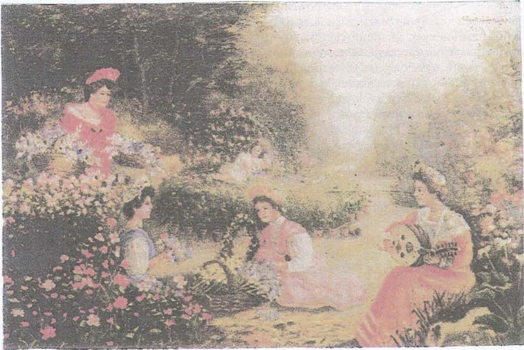
Resim 3. Müfide Kadri: Kırda Kadınlar, (1910) Tuval üzerine yağlıboya. 37x55cm. İzmir Resim ve Heykel Müzesi