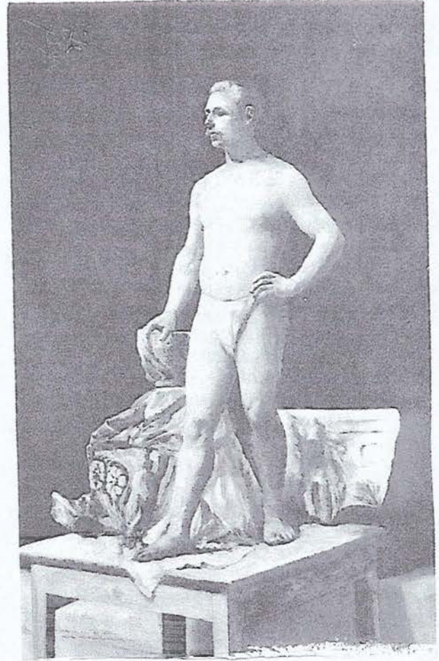
Resim 6. (Solda) Sanayi-i Nefise de bir öğrenci resmi, Tuval üzerine yağlıboya. 110x70cm. Özel Koleksiyon.