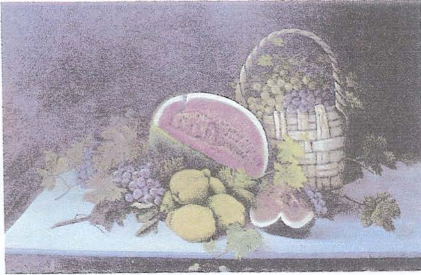
Resim 8. Şeker Ahmet Paşa: Natürmort. Tuval üzerine yağlıboya. 88x130cm. İstanbul Resim ve Heykel Müzesi