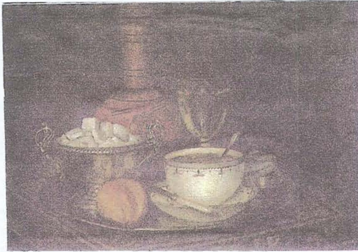
Resim 1. Abdülmecid: Kahvaltı Tepsisi. Tuval Üzerine yağlıboya. 55x46 Koleksiyon.

tarafından çizilmiş olmalıydı. Toderi'nin yazısında resimleri kimin yaptığına dair bir işaret yoksa da bundan bizim çıkartacağımız asıl önemli sonuç o tarihte Bahriye Mühendishanesinde öğretilen bazı bilgiler gereği olarak teknik resmin bir ifade ve öğretim aracı halinde buraya girmiş olduğuna dair bir işaret bulabilmemizdedir. Mühendishane-i Bahri-i Hümayun'da matematik ve geometri okutulur, denizciliğe ait çeşitli bilgiler verilirken harita yapma usulleri de öğretiliyordu. Esasen rahip Toderi'ni Mühendishanede harita ve atlasla, denizcilik ve ölçme aletleri, harita yapmada kullanılan malzeme okulun kütüphanesi, telif ve tercüme kitapların mevcudiyetine dair de bilgi vermektedir. Harita, elbette resim değildir, fakat gerek geometri şekil ve çizimlerin gerekse harita yapmayı öğrenmenin teknik resim için dolaylı da olsa fayda sağlayacağı şüphesizdir.