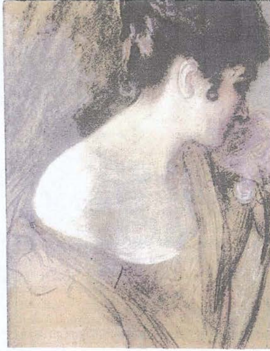
Resim 2. Mihri Müşfik: Genç Kadın Portresi, Pastel. 38x28cm. İstanbul Resim ve Heykel Müzesi

Mihri Hanım, olağanüstü girişkenliği ile atölyeye kadınlar hamamından model getiriyor, bu konuda çekingен olan Türk hanımlarının yerine, daha cüretkâr olabilen Rum ve Ermeni hanımları ikna edebiliyordu. Çıplak erkek model sorununu, Arkeoloji Müzesi'ndeki torsoları kullanarak çözümlenmeye çalıştığı biliniyor. Mihri Hanım bu yolda bile yapılan itirazları, torsoların beline peştamal bağladığını söyleyerek karşılayabilecek kadar zeki, mizahçı ve cüretkardı. Kız Sanayii Nefise Mektebinde, Erkek Sanayii Nefise Mektebinde olduğu gibi giysili erkek model de kullanılıyor; fakat bu modellerin mümkün olduğu kadar yaşlı kişiler olması öngörülüyordu. Bu yolda uzun yaşamı (150 yıldan fazla) dünyaca bilinen Zaro Ağa da atölyeye aynı amaçla getirilmiş; fakat kızların bu sorunu alay konusu etmeleri Zaro Ağa'nın anılarında bile yer almıştır.