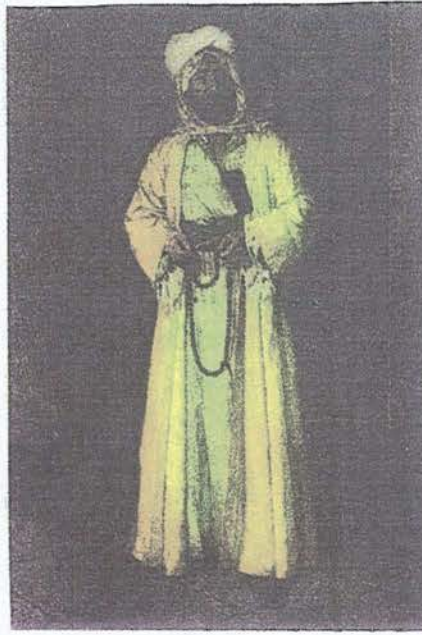
Resim. 5. Osman Hamdi: Doğulu Giysi İçinde Kendi Portresi. Tuval üzerine yağlıboya. 220x120 cm. İstanbul Resim ve Heykel Müzesi

yönetmeliğin en sonunda yer almıştır. Eski binalar ve ulusal eserlerin korunmasıyla ilgili noktalarda, Akademi içinde kurulması öngörülen Yüce Meclis (Meclis-i Âli) söz ve görev sahibi makam olarak tasarlanmıştır. Böylece, Yüce Meclis'in bu konudaki görevi hemen hemen zamanımızdaki "Kültür ve Tabiat Varlıklarını Koruma Kurulu"nun görevinin benzeri bir görev olacaktır.