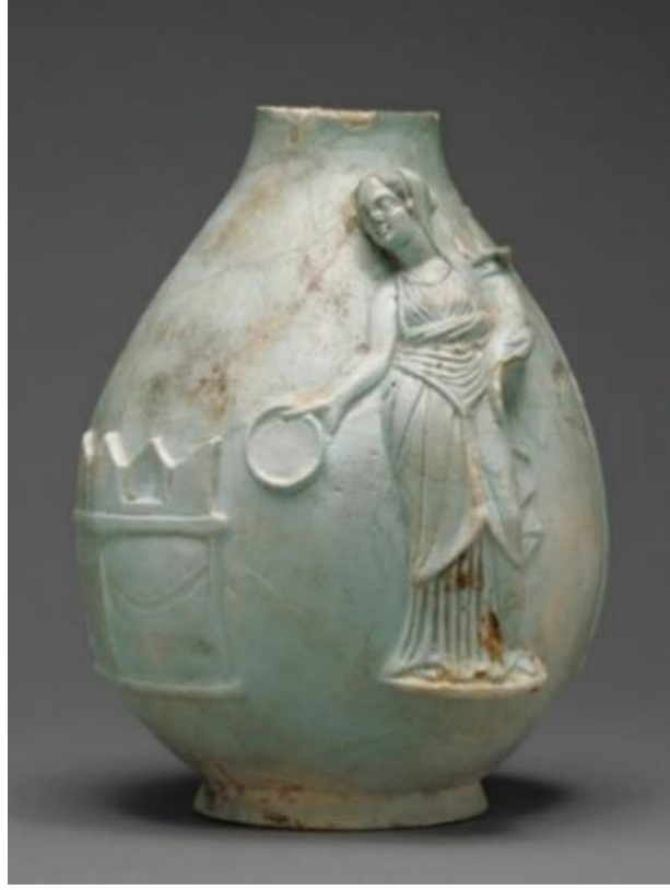
Görsel 1.4. J. Paul Getty Müzesi'nde bulunan, II. Berenike'nin elinde bir patera ve cornucopia ile Agathe Tykhe olarak yapılan tasviri. (MÖ 266- MÖ 221)

( https://www.worldhistory.org/image/10744/wine-vase-with-berenice-ii/#google_vignette