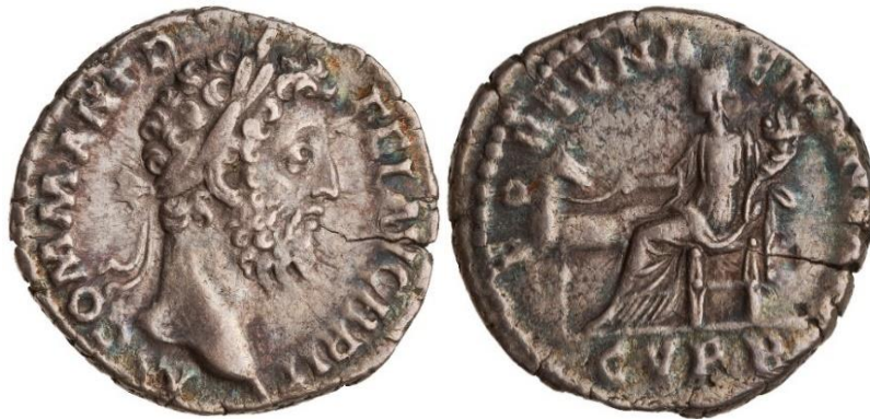
Görsel 2.73. İmparator Commodus döneminde, MS 186-MS 189 yıllarında, Roma'da basılan denarius. (RIC III Commodus 191a) (3.23gr, 17mm)

Commodus'un hükümdarlığını sonlarını doğru, MS 189 yılında basılan sikkelerde sadece onun kullandığı bir Fortuna epiteti ve geleneksel ikonografiden oldukça farklı bir betimleme de karşımıza çıkmaktadır. Bu ikonografide, kalıcı, sonsuz veya bitmez tükenmez Fortuna anlamına gelen Fortuna Manens epiteti ilk kez karşımıza çıkmaktadır. Burada tanrıça, oturur vaziyette, sağ eliyle yanında bulunan bir atın dizginlerini tutmakta ve sol elinde bir cornucopia taşımaktadır (Görsel 2.73). Burada oturan bir figürün, yekenin yerine kullanılan ve ayakta duran bir at ile yan yana gösterilmesi alışılmadık ve doğal olmayan bir durumdur. Dolayısıyla ulaşım, seyahat, nakliye, av ve yarış için kullanılan başlıca hayvan olan atın Fortuna ile kullanılması, tanrıçanın seyahat ile ilişkili niteliklerine yapılan bir atıf olmalıdır. 378