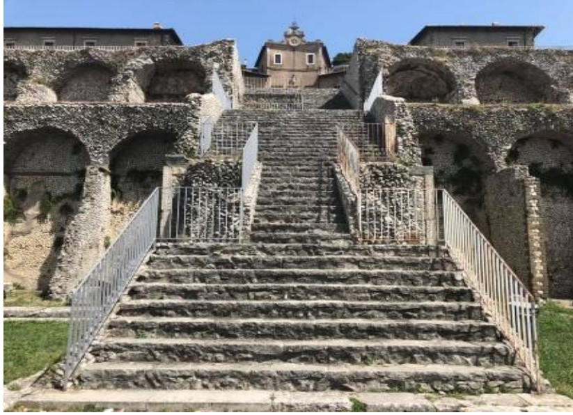
Görsel 2.1. İtalya'nın Palestrina (Praeneste) kentindeki Fortuna Primigenia tapınağının kalıntıları.

kurulmuş olmanın bir sonucu olarak Praeneste'deki Fortuna Primigenia Kültü, İtalya'nın geri kalanındaki Fortuna kültlerinin gelişiminde etkili bir rol oynamıştır. 149