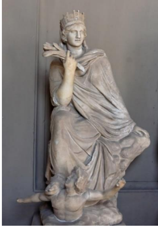
Görsel 1.6. Orijinali MÖ 3. yüzyıla tarihlendirilen Antakya Tykhe'si heykelinin Roma İmparatorluk Dönemi'nde yapılmış ve Vatikan Müzesi'nde bulunan bir kopyası. Boy: 0.89 metre.

( https://en.wikipedia.org/wiki/Eutykhides#/media/File:Tyche_Antioch_Vatican_Inv2672.jpg )