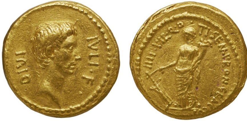
Görsel 2.18. MÖ 40 yılında Tiberius Sempronius Gracchus tarafından bastırılan aureus (altın sikke).

Antonius'un kardeşi Lucius Antonius ile Octavianus arasında yapılan Perusia Savaşı'nı Octavianus kazanmış, Antonius'un destekçileri yenilmiş ve böylece Octavianus zaferin anısına, kendisini Fortuna Caesaris'in gerçek varisi olarak göstererek altın bir sikke üzerinde Fortuna'ya yer vermiştir. Octavianus, artık Fortuna'nın kendi tarafında olduğunu başarılı bir şekilde göstermiştir. 238