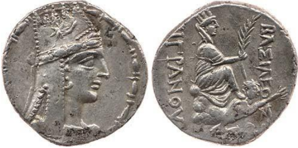
Görsel 1.14. Armenia kralı II. Tigranes'in (Büyük) yaklaşık olarak MÖ 83-MÖ 69 yılları arasında Antakya'da basılmış bir tetradrahmisi (gümüş (16.01gr)