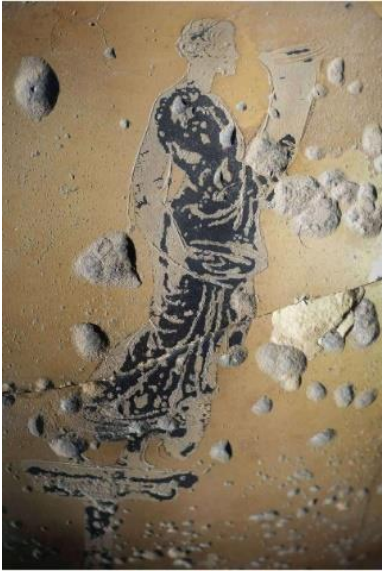
EK 3. MÖ 392-MÖ 391 yıllarına tarihlendirilen bir amphora üzerinde yer alan, cornucopia ve philae tutan Agathe Tykhe tasviri. (Stewart, 2017)