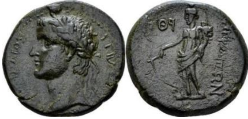
Görsel 2.26. İmparator Tiberius döneminde, MS 31-MS 32 yıllarında, Kilikya'daki Epiphaneia (Hatay/Erzin) kentinde basılmış bir Æ. (RPC I 4066) (8.64gr, 25.1mm)

( http://numismatics.org/collection/1944.100.39293 Erişim Tarihi 21.03.2023)