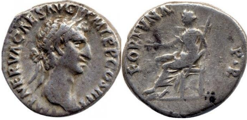
Görsel 2.44. İmparator Nerva döneminde, MS 96 yılında, Roma'da basılan denarius. (RIC II Nerva 5) (3.11gr, 17mm)

EK 28, EK 29 ve EK 30) 303 aynı zamanda da bu döneme kadar ki Roma ikonografilerinde ayakta duran Fortuna, ilk kez imparatorluğun Batı topraklarında basılan bir sikkede tahtta oturur vaziyette ve Fortuna Populi Romani epiteti ile karşımıza çıkmaktadır (Görsel 2.44 ve EK 31). Fortuna'nın farklı ikonografilerinin popülerliğindeki ve kullanımındaki bu aşırı değişkenlik, nadir görülen tiplerin Nerva tarafından yenilenmiş Divius Augustus serisinin bir parçası olduğu ve bu farklı türlerin, farklı bir Fortuna'ya atıfta bulunduğunu düşündürmektedir. 304