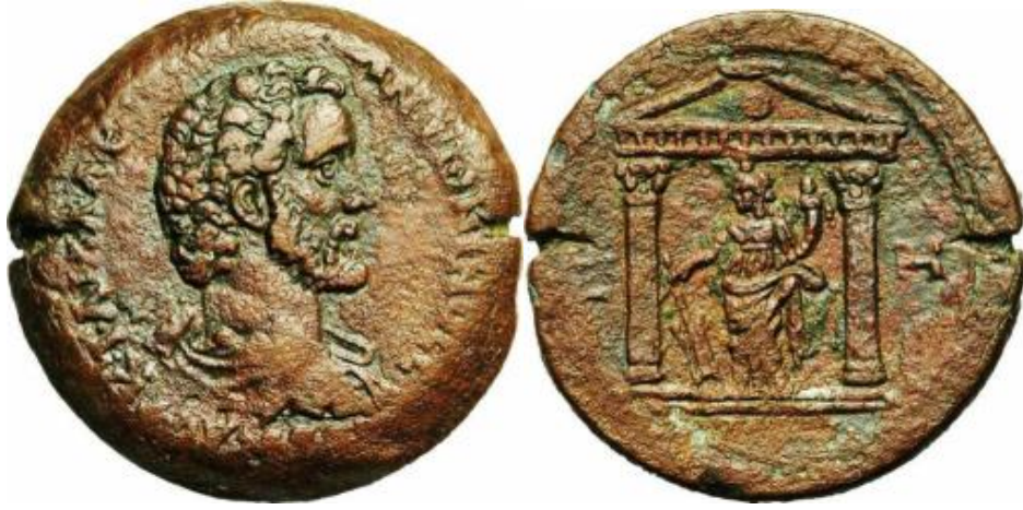
Görsel 2.61. İmparator Antoninus Pius döneminde, MS 144-MS 145 yıllarında, İskenderiye’de basılan Æ . (RPC IV.4 16361) (20.66gr, 33mm)

Antoninus Pius döneminde de tanrıçanın askeri niteliklerinin vurgulandığı, ayakta duran, sancak ve aplustrum 346 , asa ve cornucopia taşıyan 347 ikonografileri devam ettirilmiştir. Ayrıca bir yenilik olarak, İskenderiye’de basılan sikkelerde tanrıça, iki sütunlu bir tapınağın içerisinde, ayakta durmakta, başında kalathos bulunmakta, yeke ve cornucopia tutmaktadır (Görsel 2.61). 348 Kanımızca bu durum, tanrıçanın İskenderiye’de bir tapınağı ve tapınak içinde yer alan bir heykeli olduğunu işaret etmektedir. Ayrıca İskenderiye’deki Tykhaion’un varlığı konusundaki tartışmalarda bir kanıt niteliğindedir.