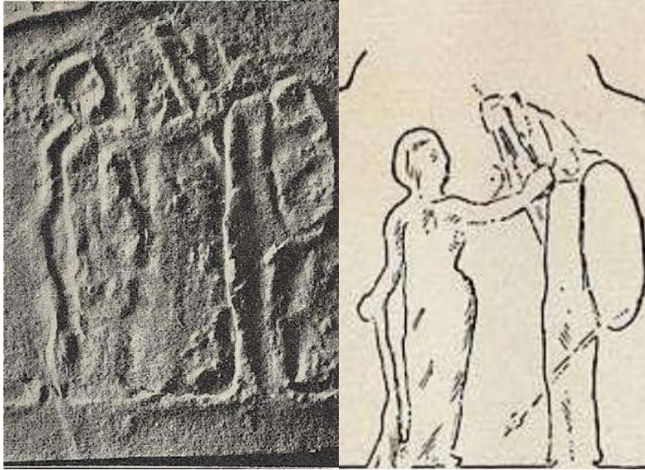
Görsel 1.2. Tegea'da bulunan Phylarkhos Steli'nde Tykhe'nin yeke ile yapılan tasviri.

Denizcilik ve denizden yapılan ticaret ile elde edilen refahı sembolize eden yeke, Siraküza, Roma, Antium ve İskenderiye gibi deniz ticareti ile ön plana çıkan kentlerin Tykhe'sinin sembolü haline gelmiştir. Hellen şair Pindaros'un (MÖ 518- MÖ 437) " senin lütfunla hızlı gemiler denizlerde yönlendiriliyor " 66 dediği Tykhe'nin, insanların hayatını da yönlendirdiği kabul edilmiştir. Pindaros, Tykhe'nin hem insan hayatı hem de denizler üzerinde gücü olduğunu onaylamakla birlikte, Tykhe'nin kurtarıcı ve koruyucu bir tanrıça olduğunu da aktarmaktadır. 67 Tykhe'nin yeke ile yapılan en erken tasviri Tegea'da bulunan ve MÖ 4. yüzyıla tarihlendirilen Phylarkhos Steli'nde görülmektedir (Görsel 1.2). Yeke tutan Tykhe tasvirinin yer aldığı ilk sikke ise, MÖ 4. yüzyıldan itibaren bir Tykhaion ve Tykhe Kültü'nün var olduğu bilinen Siraküza'da 68 ele geçirilmiştir. 69