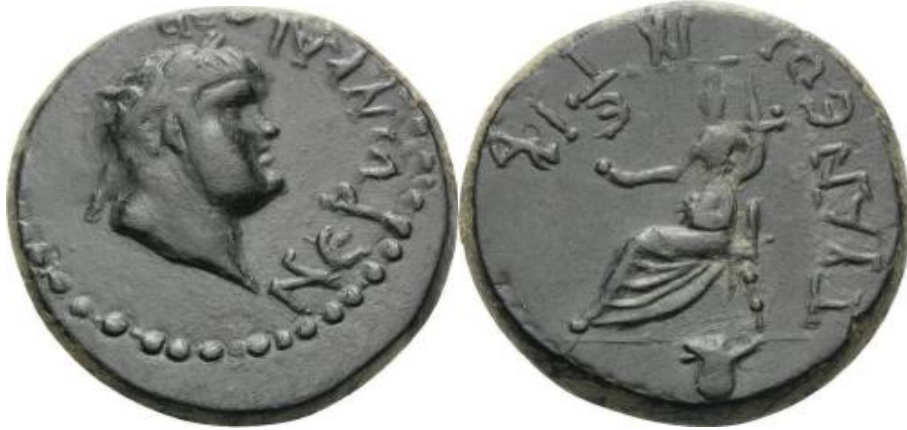
Görsel 2.30. İmparator Nero döneminde, MS 65-MS 66 yılında, Kapadokya'daki Tyana (Niğde/Bor-Kemerhisar) kentinde basılmış bir Æ . (RPC I 3660) (7.57gr, 20.4mm) ( https://rpc.ashmus.ox.ac.uk/coins/1/3660 Erişim Tarihi 18.03.2023)

İmparator Nero'nun Fortuna ile olan bu yakın ilişkiye rağmen onun dönemine tarihlendirilen ve üzerinde Fortuna tasviri bulunan ve Roma'da basılan bir sikke bulunamamıştır. Ancak doğuda, Kapadokya'da basılan sikkelerde Nero, Antakya Tykhe'si tipinde; oturan, altında bir nehir tanrısının kişileştirilmesi bulunan, sağ elinde buğday demeti ve sol elinde cornucopia tutan bir Fortuna/Tykhe tasviri kullanmıştır (Görsel 2.30). Aynı zamanda ayakta duran sağ elinde yeke ve sol elinde cornucopia tutan Fortuna/Tykhe tasviri de sikkelerde karşımıza çıkmaktadır (Bkz. EK 16). 274