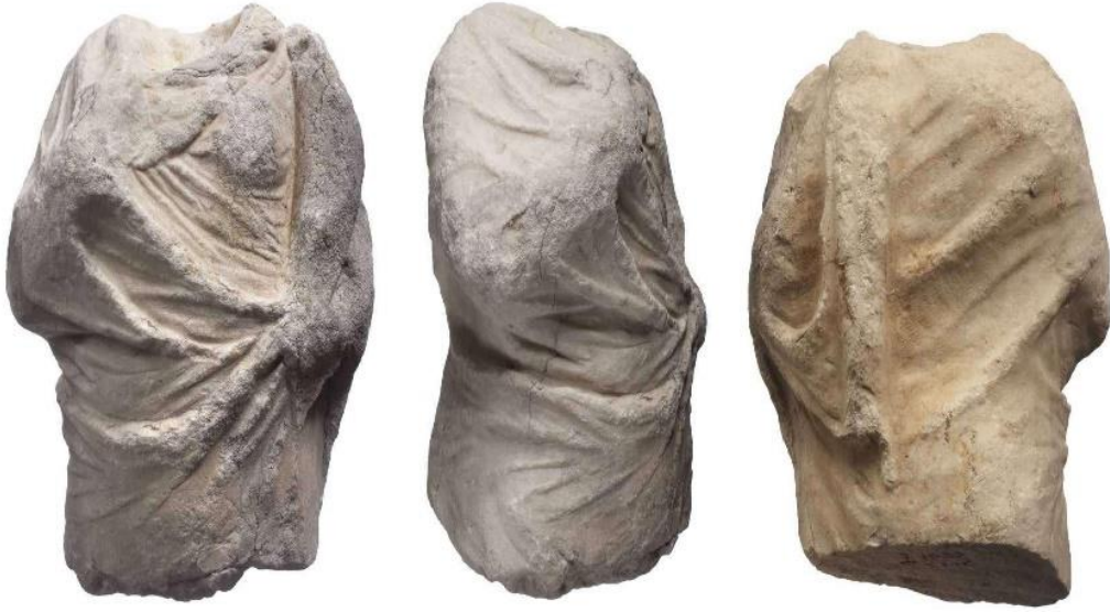
EK 7. Atina Agorası'nda bulunan ve MÖ 300-MÖ 275 yılları arasına tarihlendirilen, başı, boynu ve belden aşağısı olmayan, kıvrımlar halinde duran bol dökümlü bir kumaş giymiş ve cornucopia tutan Agathe Tykhe heykeli. (0.80m) (Stewart, 2017)