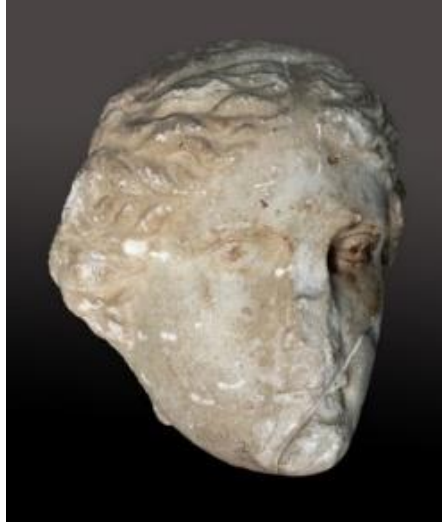
Görsel 2.5. Praeneste'deki Fortuna Primigenia Tapınağında ele geçirilen ve Fortuna'ya ait olduğu düşünülen kült heykelinin başı.

uyduğunu göstermektedir. 171 Fortuna Primigenia Tapınağı'nın önündeki kyunun yakınlarında Cicero'nun bahsettiği heykele ait olabileceği düşünülen anıtsal bir kadın heykeli başı bulunmuştur (Görsel 2.5). 172 Roma'daki bu ilk tasvirlerinde görüldüğü üzere Fortuna, Hellen dünyasındaki Tykhe'nin erken tasvirlerinde olduğu gibi, başında bir duvar tacı veya ayırt edici bir saç stili ile değil, sade ve basit bir şekilde betimlenmiştir.