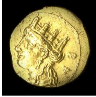
Görsel 1.1. Kıbrıs/Salamis kent devletinin kralı II. Euagoras döneminde, MÖ 361-351 yılları arasında, Salamis'de basılan bir altın sikke. (0.680gr)

Tykhe'nin bu tasviri, II. Euagoras'ın halefleri Pnytagoras (MÖ 351-MÖ 332) ve Nikokreon (MÖ 331-MÖ 310) tarafından da sikkelerde devam ettirilmiştir. 64