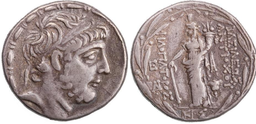
EK 10. MÖ 105-MÖ 104 yıllarında, Tripolis’de (Lübnan/Tripli) basılmış bir tetradrahmi. Ön yüzde; diadem takmış ve sağa dönük bir şekilde duran IX. Antiokhos Kyzikenos ve arka yüzde; ΒΑΣΙΛΕΩΣ ΑΝΤΙΟΧΟΥ ΦΙΛΟΠΑΤΟΡΟΣ yazısı ve ayakta duran, başında kalathos bulunan, sağ elinde yeke ve sol elinde cornucopia tutan Tykhe. (16.19gr, 28mm) ( http://numismatics.org/collection/1944.100.76784 Erişim Tarihi 23.02.2023)