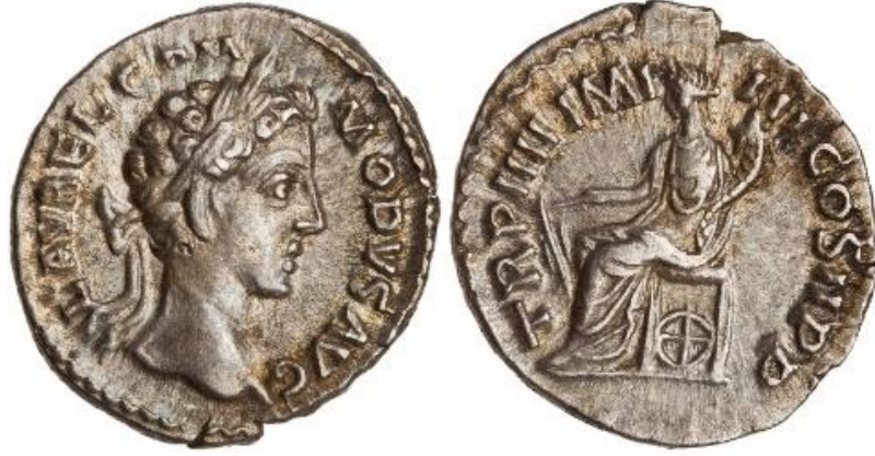
Görsel 2.70. İmparatorlar Marcus Aurelius ve Commodus döneminde, MS 179 yılında, Roma'da basılan denarius. (RIC III Marcus Aurelius 662) (2.79gr)

( http://numismatics.org/collection/1956.127.1116 Erişim Tarihi 28.03.2023)