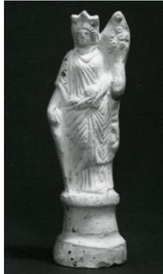
Görsel 2.64. MS 2.yüzyıla tarihlendirilen, Galya'da yapılan ve Hedderheim'da (Almanya/Hesse-Darmstadt) bulunan, ayakta duran, sağ elinde yeke ve sol elinde cornucopia tutan Fortuna'nın pişmiş toprak heykelciği. (16.70 cm)

MS 2. yüzyılda Fortuna Kültü ikonografisi çeşitli şekillerde ve sıklıkla kullanılmıştır. Özellikle sikkeler üzerinde ve ayrıca heykeller, heykelcikler, yüzükler veya değerli taşlar üzerinde, tanrıçanın en ayırt edici ve geleneksel ikonografisi olan, ayakta duran, sağ elinde yeke ve sol elinde cornucopia tutan Fortuna tasviri açık bir şekilde izlenebilmektedir (Görsel 2.64 ve 2.65). Aynı zamanda tanrıçanın bu dönemde heykel sanatındaki tasvirleri artmış ve ayakta duran, başında kalathos bulunan (veya bulunmayan), sağ elinde bir küre üzerinde duran yeke ve sol elinde cornucopia tutan (EK 56 ve EK 57); başında taç bulunan ve cornucopia tutan (Görsel 2.66-Bkz. EK 58); ayakta duran, altında, başında şehir duvarlarını temsil eden taç bulunan Pontus'un (Karadeniz) kişileştirilmesi bulunan (Görsel 2.67) ve cornucopia taşıyan ve ayakta duran, başında zeytin yapraklarıyla süslü kent surlarını temsil eden bir taç bulunan, sağ kolunun altında bulunan kırık parçadan dolayı yeke tuttuğu düşünülen ve sol elinde cornucopia ve bereketin ve zenginliğin kişileştirilmiş tanrısı olan çocuk Ploutos'u tutan (Görsel 2.68) Tykhe/Fortuna heykelleri gibi heykeller dönemin sanat eserleri arasında yer almışlardır. Bunlara ek olarak tam anlamda bir tarihlendirme yapılamasa da çark içermesinden dolayı MS 2. yüzyıla ait olabileceği düşünülen bir duvar resminde, ayakta duran, sağ elinde bir çark üzerinde duran yeke ve sol elinde cornucopia tutan Fortuna yer almaktadır (Görsel 2.69).