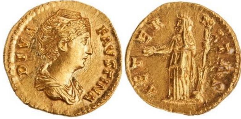
Görsel 2.59. İmparator Antoninus Pius döneminde, MS 141 yılında, Roma'da basılan aureus. (RIC III Antoninus Pius 349Aa) (7.23gr, 19mm)

( http://numismatics.org/collection/1966.62.11 Erişim Tarihi 27.03.2023)