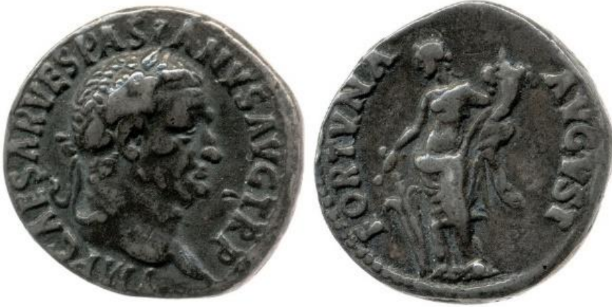
EK 18. MS 71 yılında Lugdunum'da (Lyon/Fransa) basılmış bir denarius. Ön yüzde; IMP CAESAR VESPASIANVS AVG TR P yazısı ve defne yaprakları ile süslenmiş bir taç takmış ve sağa dönük bir şekilde duran imparator Vespasianus ve arka yüzde; FORTVNA AVGVST yazısı ve sola dönük bir şekilde bir şekilde ayakta duran, sağ elinde yeke ve sol elinde bir cornucopia tutan Fortuna. (3.61 gr) (RIC II, Part 1 Vespasian 1116) ( https://www.britishmuseum.org/collection/object/C_R-415 20.03.2023)