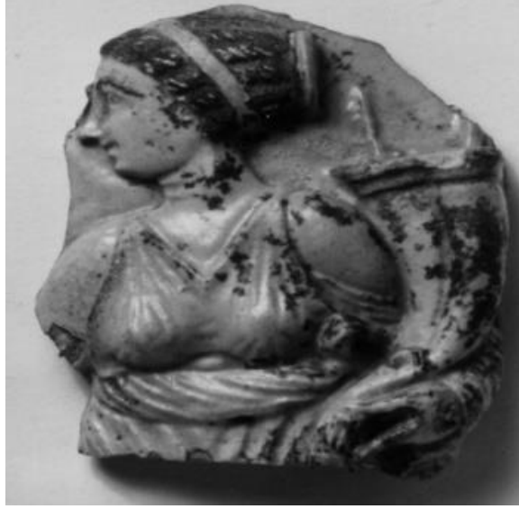
Görsel 1.3. Kraliçe II. Arsinoe'nin çift cornucopia ile tasviri yapıldığı bir oinochoe parçası. (MÖ 270- MÖ 246) 7x5 cm

oinochoe üzerinde, II. Ptolemaios Philadelphos ve karısı II. Arsinoe veya II. Berenike'nin (MÖ 246-MÖ 222) elinde bir cornucopia veya II. Ptolemaios tarafından kraliçelerin zenginliğini ve bereketi tanımlamak için bulunan ve çift boynuz olarak bilinen dikeras tuttuğu ve kraliçelerin yakınında çelenkle süslenmiş uzun bir sütun bulunan boynuzlu bir sunağın yanında libasyon yaptığı tasvirleri yer almaktadır (Görsel 1.3 ve 1.4). 77