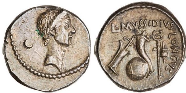
Görsel 2.15. MÖ 42 yılında, Roma'da, L. Mussidius Longus tarafından bastırılmış denarius. (RRC 494/39a) (4.087gr,16mm)

( https://www.britishmuseum.org/collection/object/G_1849-1201-53 Erişim Tarihi 05.02.2023)