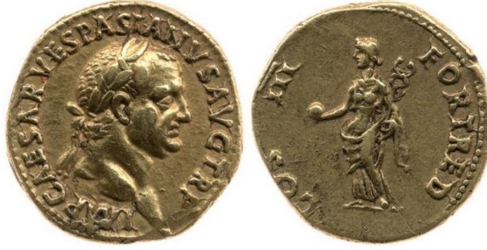
Görsel 2.37. İmparator Vespasianus tarafından Lugdunum'da (Lyon/Fransa) MS 71 yılında bastırılan aureus. (RIC II, Part 1 Vespasian 682) (7,46gr)

( https://www.britishmuseum.org/collection/object/C_1867-0101-640 Erişim Tarihi 20.03.2023)