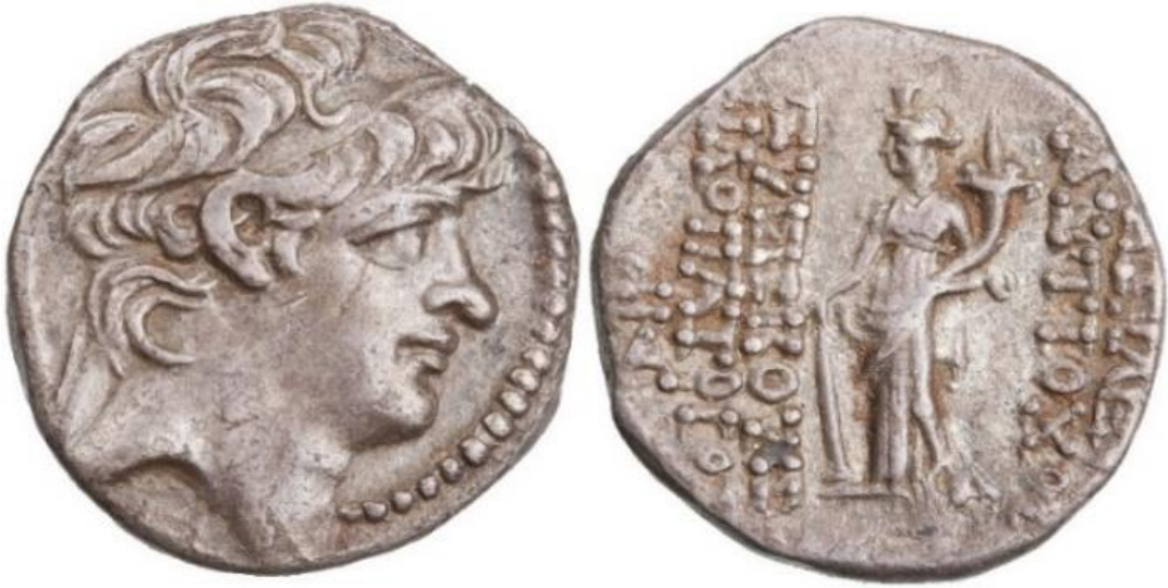
Görsel 1.11. Suriye kralı X. Antiochos Eusebes Philopator döneminde, MÖ 94 yılında, Antakya'da basılan bir drachmi (gümüş). (3.86gr, 18mm) ( http://numismatics.org/collection/1944.100.76916 Erişim Tarihi 23.02.2023)