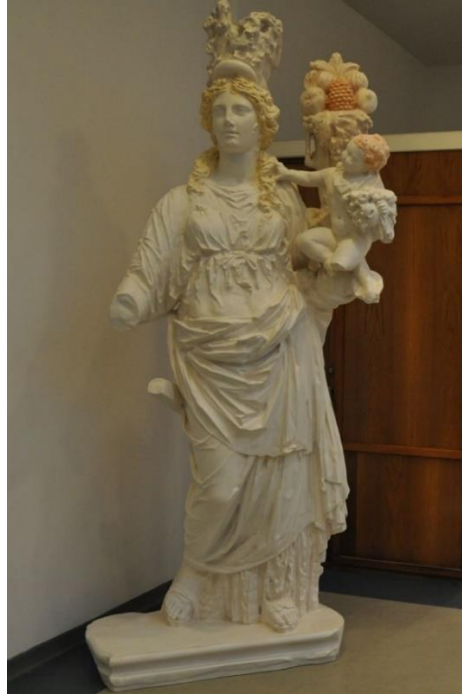
Görsel 2 68. MS 2. yüzyıla tarihlendirilen, Prusias ad Hypium'da (Düzce/Konuralp) ele geçirilmiş ve İstanbul Arkeoloji Müzesi'nde bulunan Tyche heykeli. (2.60m) ( https://www.kulturportali.gov.tr/turkiye/duzce/gezilecek/tyche-heykel-ve-orpheus-mozag Erişim Tarihi 29.03.2023)