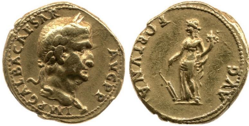
Görsel 2.33. İmparator Galba döneminde, MS 68-69 yılında Lugdunum'da (Fransa/Lyon) basılmış aureus. (RIC I Galba 127) (7.24gr)