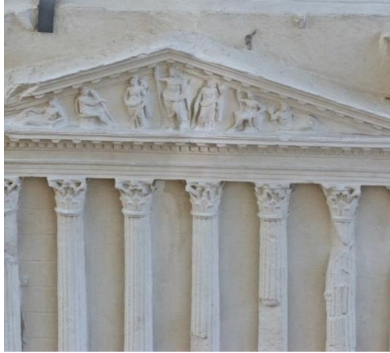
Görsel 2.22. Ara Pietatis Augustae'den (MS 41-43) bir kabartma üzerinde yeniden işlenen Mars Ultor Tapınağı'nın alınlığının Capitol Tepesi'nin yamaçlarında bulunan orijinalinin alçı dökümü. Soldan sağa; Palatine, Romulus, Venüs, Mars, Fortuna, Roma ve Tiber.

Roma'da, Augustus Forum'undaki Mars Ultor Tapınağı'nın alınlığında, Julius Ailesi'nin (Gens Julius) ve Roma'nın soyunun dayandırıldığı Venüs, Mars ve efsanevi Romulus ile Palatine Tepesi'nin, Tiber Nehri'nin ve Roma şehrinin kişileştirilmeleriyle birlikte Fortuna da yeke ve cornucopiasıyla yer almıştır (Görsel 2.22). Burada yer verilen her bir tanrısal figür, bireysel veya toplu olarak, Octavianus Roma'sının dini ve siyasi hayatın önemli yönlerini temsil etmektedir. Nitekim Augustus Forum'u anıtsal anlamda, halka açık bir şekilde Augustus'un hanedanını ve ev halkının bir temsiliydi. Octavianus burada Venüs aracılığıyla doğrudan atalarının soyuna atıfta bulunmaktaydı. Burada Venüs ve Mars'ın yanında Fortuna'nın da varlığı, tanrıçanın Octavianus'un ideolojisindeki rolünü vurgulamaktadır. Nitekim Octavianus'un Fortuna'yı, savaş tanrısı Mars ile kullanması, Julius Caesar'ın Antakya'daki Ares Tapınağı'nın karşısına Tykhe heykeli yerleştirmesine bir vurgu olarak yorumlanmaktadır. 257