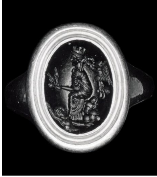
Görsel 2.49. MS 1. ve MS 3.yüzyıllar arasında tarihlendirilen, kayaya oturmıř bir řekilde duvar tacı takmıř ve elinde tahıl demeti ve hařhař (afyon) tutmakta. Ayađının altından ise Orontes Nehri'nin kiřileřtirilmesi bulunan yeřil akmaktařı.

( https://www.britishmuseum.org/collection/object/G_1921-0711-10 Eriřim Tarihi 25.02.2023)