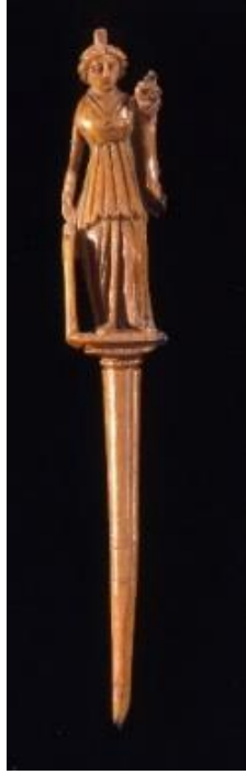
Görsel 2 65. MS 2. yüzyıla tarihlendirilen, Londinium'da (İngiltere/Londra) bulunan ve üzerinde ayakta duran, sağ elinde yeke ve sol elinde cornucopia tutan Fortuna tasvirinin bulunduğu kemik saç tokası. ( https://www.britishmuseum.org/collection/object/H_1883-0509-3 Erişim Tarihi 29.03.2023)