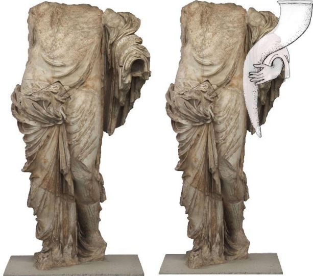
EK 5. Atina'da bulunan, MÖ 335-MÖ 334 yıllarına tarihlendirilen, ayakta duran ve eksik olsa da kolunun pozisyonundan dolayı cornucopia tuttuğu düşünülen Agathe Tykhe heykeli. (Stewart, 2017)