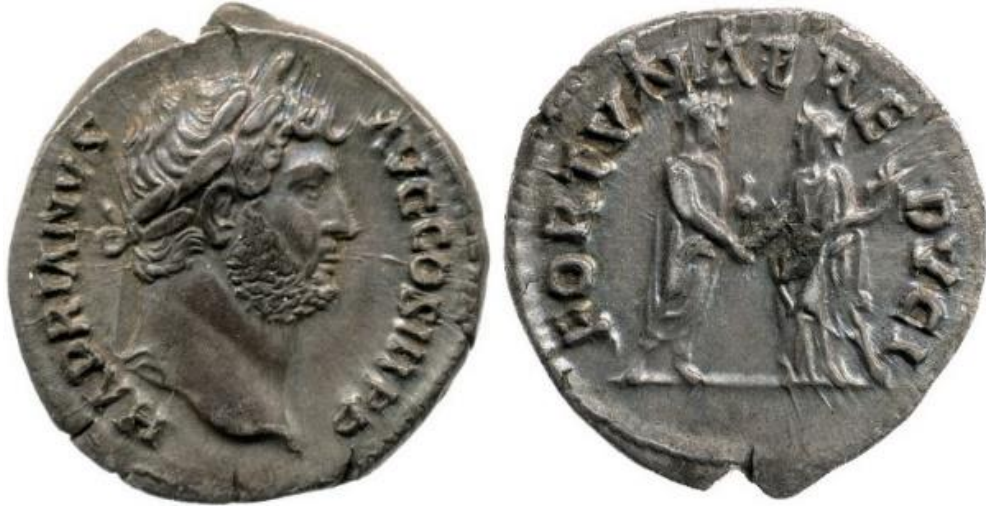
Görsel 2.53. İmparator Hadrianus döneminde, MS 130-MS 138 yılları arasında, Roma'da basılmış denarius. (RIC II, Part 3 Hadrian 2000-2004) (3.100gr)

( http://numismatics.org/collection/1956.127.127 Erişim Tarihi 24.03.2023)