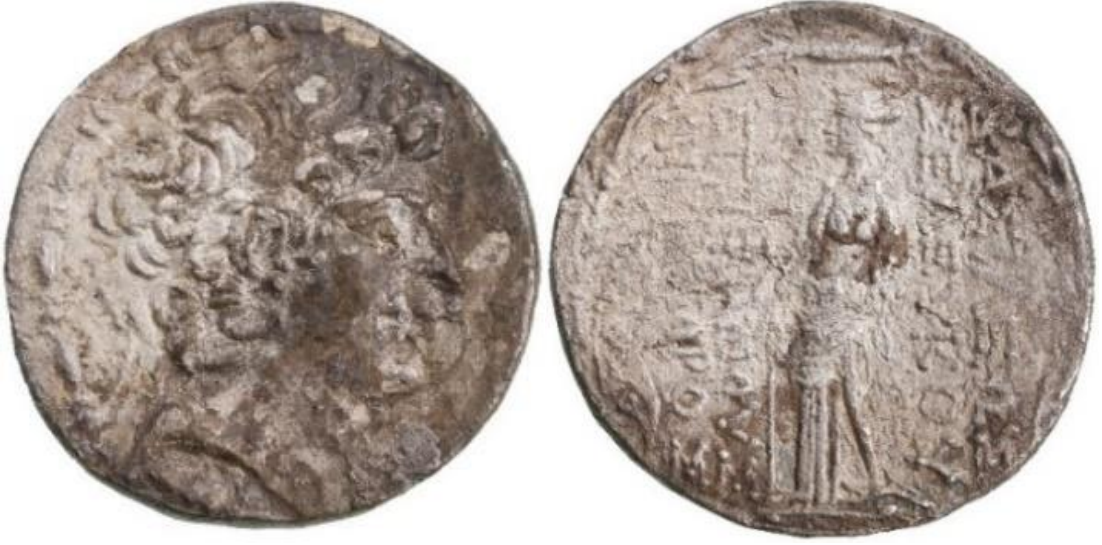
Görsel 1.10. Seleukos hükümdarı VI. Seleukos Epiphanes döneminde, MÖ 96- MÖ 95 yıllarında, Elaeusa'da basılan tetradrahmi (gümüş). (14.83gr, 29mm) ( http://numismatics.org/collection/1944.100.78106 Erişim Tarihi 23.02.2023)