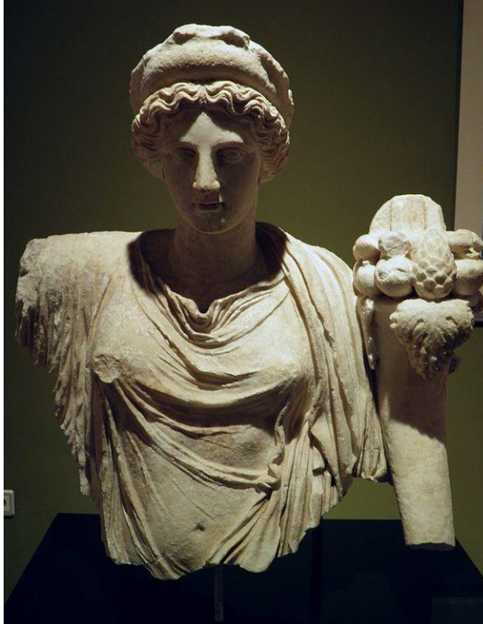
Görsel 2.66. Burdur Müzesi'nde bulunan, MS 2. Yüzyıla tarihlendirilen ve sol elinde cornucopia tutan Tyche.