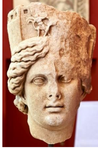
Görsel 2.56. Roma imparatoru Hadrianus dönemine tarihlendirilen ve Sparta Arkeoloji Müzesi'nde bulunan, kent duvarlarını temsil eden bir taç takmış olan Tykhe heykelinin başı. (Baş ve boyun 26cm, yüz 20cm ve taç 11.5cm)

( https://commons.wikimedia.org/wiki/File:Head_of_Tyche_(2nd_century_A.D.)_at_the_Archaeological_Museum_of_Sparta_(5-15-2019).jpg Erişim Tarihi 20.04.2023)