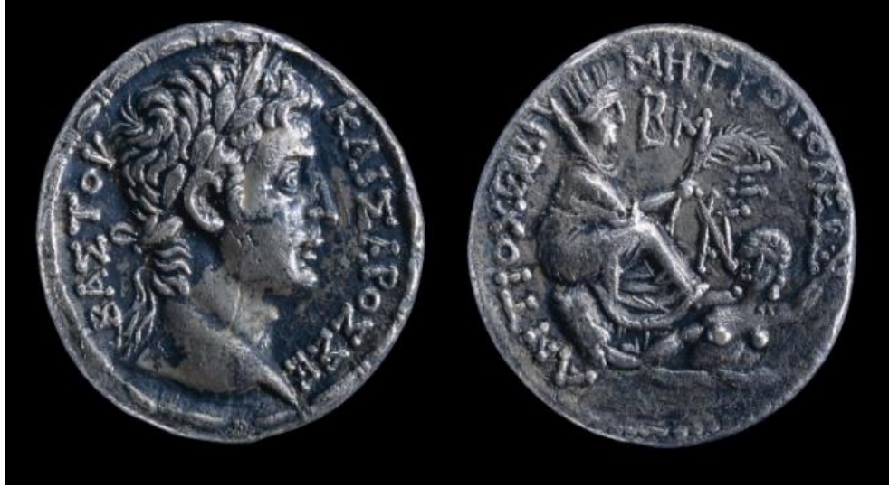
Görsel 2.24. İmparator Augustus döneminde, MS 12 yılında, Antakya'da basılan bir tetradrahmi (gümüş sikke). (RPC I 4159/1) (15.325gr) ( https://www.britishmuseum.org/collection/object/C_G1874-0715-392 Erişim Tarihi 22.03.2023)