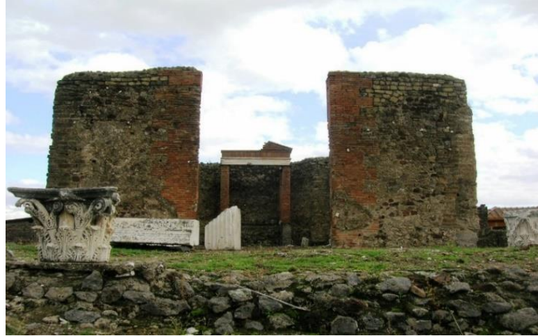
Görsel 2 21. Pompeii'deki Fortuna Augusta Tapınağı'nın kalıntıları.