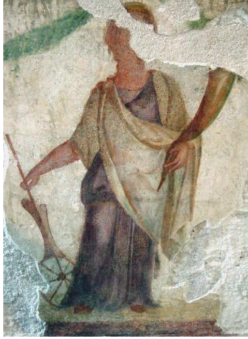
Görsel 2.69. Milano Arkeoloji Müzesi'nde bulunan duvar resmi.

https://commons.wikimedia.org/wiki/File:Fortuna - MI - Museo archeologico - 25-7-2003 - fotomia.JPG Erişim Tarihi 29.03.2023