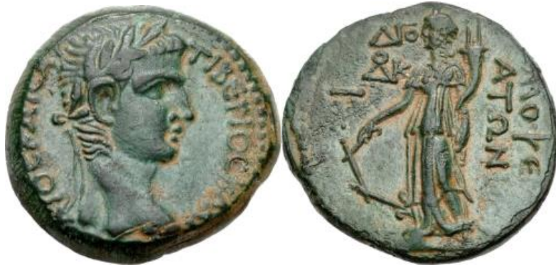
Görsel 2.29. İmparator Claudius döneminde, MS 42-MS 43 yılında, Kilikya’daki Mopsus/ Mopsuestia (Adana/Misis) kentinde basılmış bir Æ . (RPC I 4053) (8.09gr, 24mm) ( https://rpc.ashmus.ox.ac.uk/coins/1/4053 Erişim Tarihi 18.03.2023)