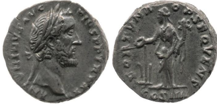
Görsel 2 58. İmparator Antoninus Pius döneminde, MS 157-MS 158 yılları arasında, Roma'da basılan denarius. (RIC III Antoninus Pius 271) (3.81gr)

( https://www.britishmuseum.org/collection/object/C_1970-0406-1 Erişim Tarihi 27.03.2023)