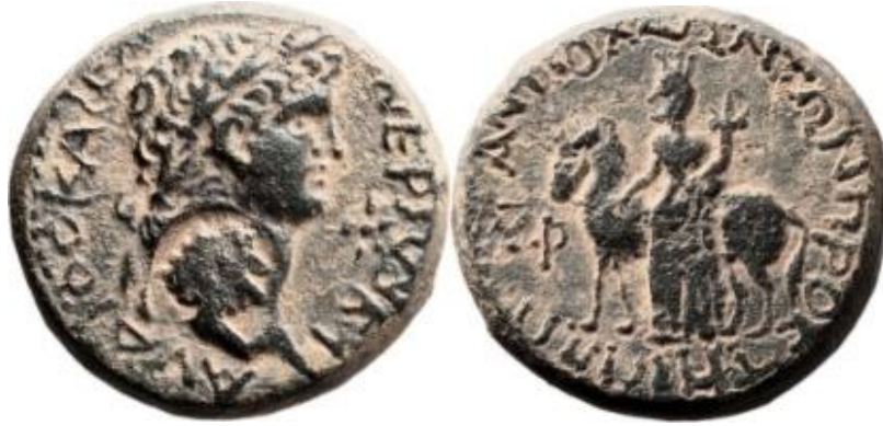
Görsel 2.31. İmparator Nero döneminde, MS 67-MS 68 yıllarında, Antiocheia ad Hippum’da basılmış bir Æ . (RPC I 4807) (12.4gr, 24mm)

Eğlenceye, oyunlara ve araba yarışlarına düşkünlüğü ile bilinen Nero döneminde ilk kez, ismini Grekçe “at” anlamına gelen “ hippos ” (ἵππος) sözcüğünden alan Antiocheia ad Hippum’da (İsrail/Hippos) basılan sikkelerde, ayakta duran, başında şehir duvarlarını temsil eden bir taç bulunan, sağ elinde bir atın dizginlerini tutan ve sol eliyle cornucopia taşıyan Tykhe tasvirleri de çıkmaktadır (Görsel 2.31). 275 Ayrıca bu kent sikkelerinin ön yüzünde Tykhe’nin bulunduğu ve arka yüzünde sadece bir atın bulunduğu veya ayakta duran sağ elinde küçük bir at ve sol elinde cornucopia tutan Tykhe tasviri de görülmektedir. 276