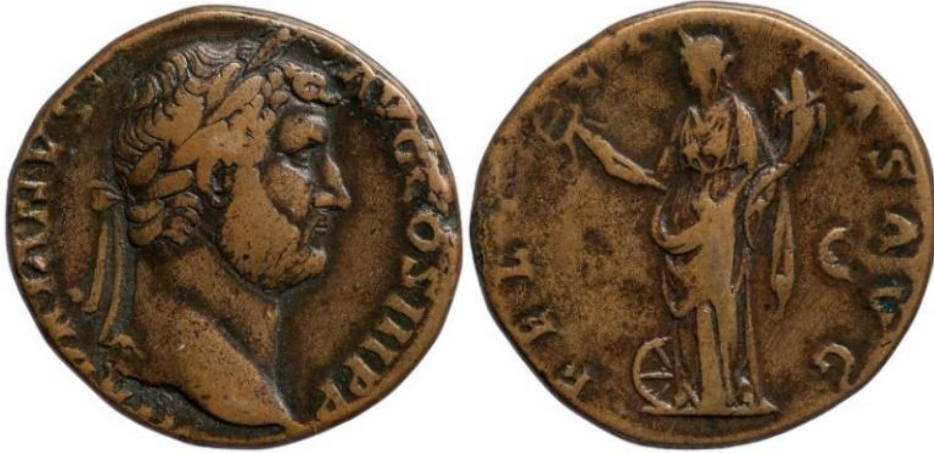
Görsel 2.54. İmparator Hadrianus döneminde, MS 134-MS 138 yılları arasında, Roma'da basılan sestertius. (RIC II, Part 3 Hadrian 2250-2253- RIC Hadrian: 749) (22.83gr, 30.4mm) ( https://www.ikmk.at/object?lang=en&id=ID171514&view=rs Erişim Tarihi 27.03.2023)