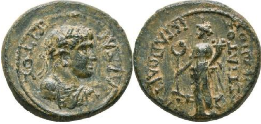
EK 24. MS 79-MS 81 yılları arasında, Hierapolis’de (Denizli/Pamukkale) basılmış bir Æ. Ön yüzde TITOΣ KAIΣAP yazısı ve defne yaprakları ile süslenmiş bir taç takmış ve sağa dönük bir şekilde duran imparator Titus ve arka yüzde IEPAPIOΛITΩN ΣΩΣΤΡΑΤΟΣ [ ] yazısı ve sola dönük bir şekilde ayakta duran sağ elinde yeke ve sol elinde cornucopia tutan Tykhe. (5.47gr, 20mm) (RPC II 1303) ( https://rpc.ashmus.ox.ac.uk/coins/2/1303 Erişim Tarihi 21.03.2023)