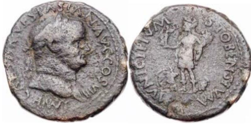
Görsel 2.38. İmparator Vespasianus döneminde, MS 77-MS 78 yıllarında, Stobi'de (Makedonya) basılan AE. (RPC II 306) (13.67gr, 28mm)

( https://rpc.ashmus.ox.ac.uk/coins/2/306 Erişim Tarihi 21.03.2023)