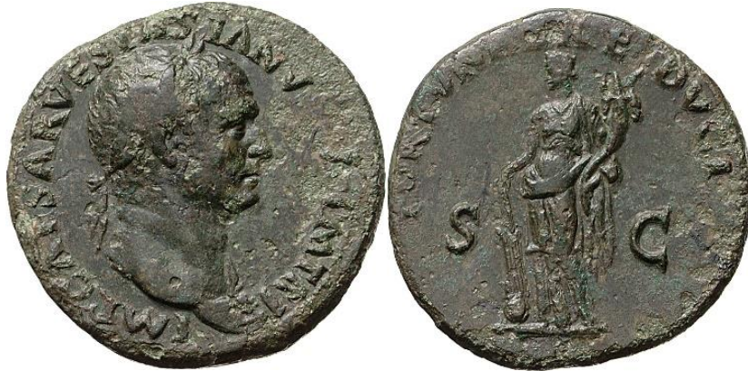
Görsel 2.36. İmparator Vespasianus tarafından Roma'da, MS 71 yılında bastırılan sesterisus (bronz sikke. (RIC II, Part 1 Vespasian 50) (24,98gr, 33mm)

Bütün bunların yanında Vespasianus, Galba'nın Fortuna'nın ayaklarının altına yerleştirdiği, dünyayı ve evrensel yetkiyi temsil eden küreyi, tanrıçanın tuttuğu yekenin altına yerleştirmiş ve böylece kendisinin, tanrıçanın koruması altında dünyayı, bir kaptanın gemiyi yönlendirdiği gibi yönlendirdiği ve imparatorluk içerisindeki dengeyi sağladığı mesajını vermek istemiştir (Görsel 2.36). Aynı zamanda bazı sikke tiplerinde, dünyayı ve evrensel gücü temsil eden küreyi Fortuna'nın eline vererek, tanrıçanın ve tanrıça aracılığıyla kendisinin evrensel yetkisini ve gücünü göstermeye çalışmıştır (Görsel 2.37).