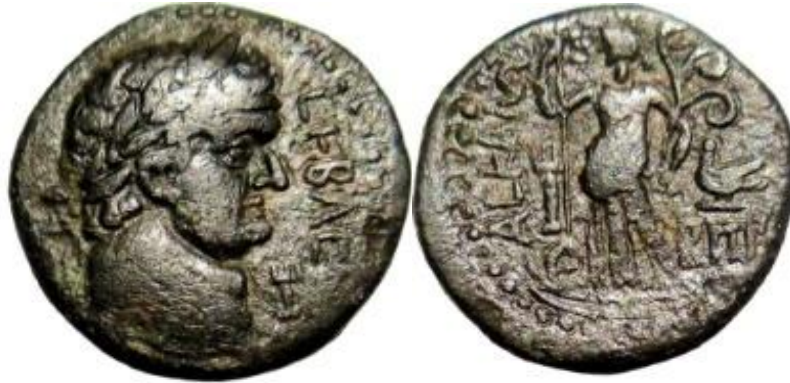
Görsel 2.40. İmparator Vespasianus döneminde, MS 78-MS 79 yıllarında, Ascalon'da basılan bir Æ (RPC II 2208) (11.87gr, 22mm)

( https://rpc.ashmus.ox.ac.uk/coins/2/2088 Erişim Tarihi 21.03.2023)