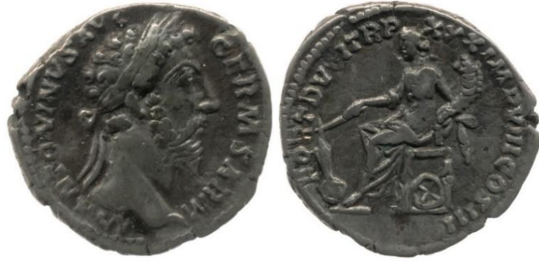
Görsel 2.63. İmparator Marcus Aurelius döneminde, MS 175-MS 176 yılında, Roma'da basılmış denarius. (RIC III Marcus Aurelius 343) (3.22gr)

duran bir yeke ve sol elinde cornucopia tutmakta ve oturduğu tahtın altında bir çark ( rota Fortunae ) bulunmaktadır (Görsel 2.63). Bize göre, tanrıçanın ve talihin değişkenliğini, iniş ve çıkışlarını ve insanların talihinin her zaman ters dönebileceği gibi anlamlar ifade eden çarkın, Marcus Aurelius döneminin sonlarına doğru, yani imparatorluğun sallantıya geçtiği ve istikrarın, barışın ve düzenin sarsılmaya başladığı bir zamanda ortaya çıktığı düşünülmürse bu tasvir ikonografik olarak oldukça etkileyici bir mesaj olmuştur.