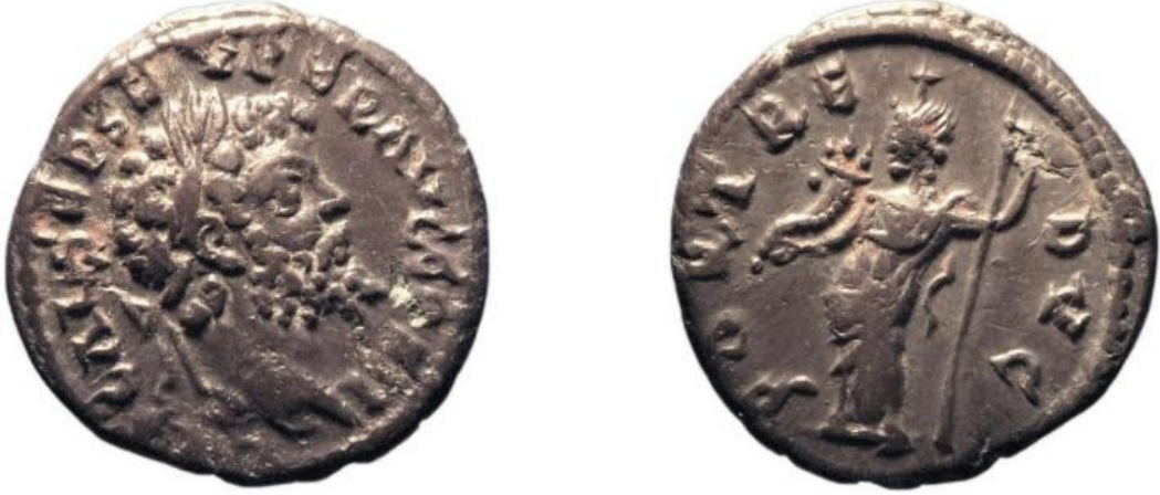
Görsel 2.78. İmparator Septimius Severus döneminde, MS 194-MS 195 yıllarında, Kapadokya'da basılan denarius. (RIC IV Septimius Severus 388) (2.857gr)

ve zenginliğini arttırdığının propagandasını açık bir şekilde yapmıştır. Nitekim MS 194 yılında basılan bir sikkede Fortuna, ayakta durmakta ve iki elinde de bereketin ve zenginliğin artışı gösteren cornucopia taşımaktadır (Görsel 2.79). 394