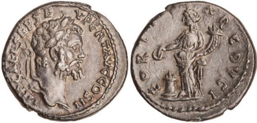
Görsel 2.77. İmparator Septimius Severus döneminde, MS 194-MS 195 yıllarında, Emesa'da basılan denarius. (RIC IV Septimius Severus 385) (3.13gr, 17.5mm)

Septimius Severus döneminde karşımıza çıkan bir başka ikonografi ise ayakta duran, sağ elinde tuttuğu patera ile önündeki sunağa sunuda bulunan ve sol eliyle cornucopia tutan tanrıçadır. Romalılar için dindarlık, zafer ve ardından gelen barışın sağlanması ve devam ettirilmesi için gerekli bir araçtır. Böylece zafer ve barışa vurgu yapan Septimius Severus, Fortuna'yı patera ile bir sunuda bulunurken tasvir ettirerek de dini erdeme ve dindarlığa da dikkat çekmiştir (Görsel 2.77). 391 Ayrıca bu dönemde ikonografilerin Fortuna Redux epiteti ile kullanılmasının sebebi ise imparatorun Roma'ya sağ salim dönüşünü kutlamak için tanrıçaya yaptığı sunulara atıfta bulunmaktadır. 392