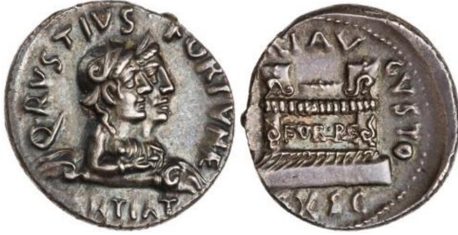
Görsel 2.9. MÖ 19- MÖ 4 yılları arasına tarihlendirilen bir denarius (gümüş sikke). (RIC 1 Augustus 322) (3.83gr, 19.5mm)

( http://numismatics.org/ocre/results?q=deity_facet:%22Fortuna%20Victrix%22 )