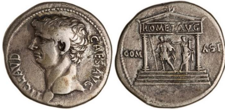
Görsel 2.28. İmparator Claudius döneminde MS 41-MS 54 yılları arasında, Pergamon’da (Bergama) basılmış cistophorus (antik Bergama’nın gümüş madeni parası). (RIC I Claudius 120) (10.8gr, 26mm) ( http://numismatics.org/collection/1955.21.4 Erişim Tarihi 18.03.2023)

yükselişe geçen Fortuna düşüncesi vurgulanmaktadır. Aynı zamanda, MS 41-MS 54 yılları arasında, imparatorluğun doğu bölgelerinde basılan sikkelerde ayakta duran, sağ elinde bir yeke ve sol elinde cornucopia tutan Fortuna/Tykhe tasvir edilmiştir (Görsel 2.29). 270 Bunlara ek olarak, Kilikya’da basılan sikkelerde Tykhe, Antakya Tykhe’si tipinde, bir kaya üzerinde sağa dönük bir şekilde oturur vaziyette, başında şehir duvarlarını temsil eden bir taç, elinde buğday başağı ve altında bir nehir tanrısının kişileştirilmesi ile tasvir edilmiştir (Bkz EK 15). 271