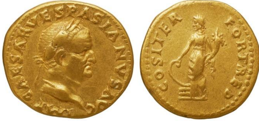
Görsel 2.35. İmparator Vespasianus tarafından Roma'da, MS 70 yılında bastırılan aureus. (RIC II Part 1, Vespasian 18) (6,99gr)

( http://numismatics.org/ocrc/id/ric.2_1(2).ves.18 Erişim Tarihi 20.03.2023)