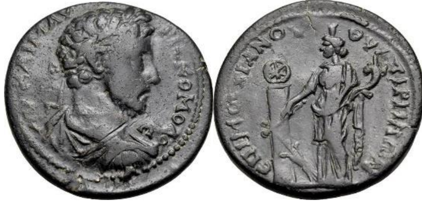
Görsel 2.71. İmparator Commodus döneminde, MS 184-MS 187 yıllar arasında, Thyatira'da basılmış bir Æ. (RPC IV.2 2877) (19.28gr, 32m)

( http://numismatics.org/collection/1956.127.1116 Erişim Tarihi 28.03.2023)