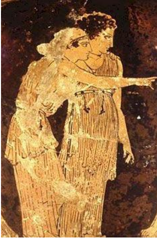
EK 2. Berlin amphoriskosu üzerindeki Nemesis ve Tykhe tasviri. ( https://www.theoi.com/Gallery/N16.1.html Erişim Tarihi 13.02.2023)