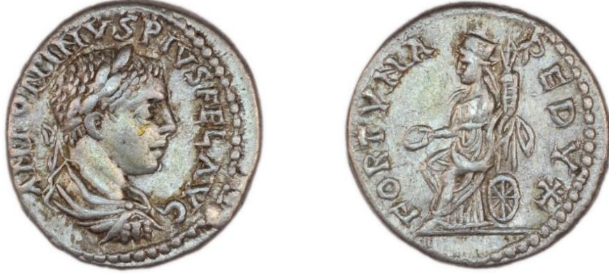
Görsel 2.83. İmparator Elagabalus döneminde, MS 218-MS 219 yılında, Antakya'da basılan denarius.

çıkılmaktadır (Bkz. EK 75). 405 Elagabalus döneminde ayrıca, oturan, oturduğu tahtın altında çark bulunan, sağ elinde bir patera ve sol elinde cornucopia tutan Fortuna tasvirleri de görülmektedir (Görsel 2.83). 406 İmparator kullandığı bu ikonografi ile tanrıçaya yaptığı sunuları ortaya koymakta ve tanrıçanın koruması altında olduğunu vurgulamaktadır.