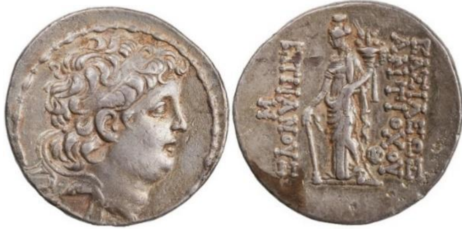
Görsel 1.9. Seleukos hükümdarı VIII. Antiokhos Grypus'un iktidara gelmede önce, MÖ 129- MÖ 128 yıllarında basılan tetradrahmisi (gümüş). (16.39gr, 29mm)