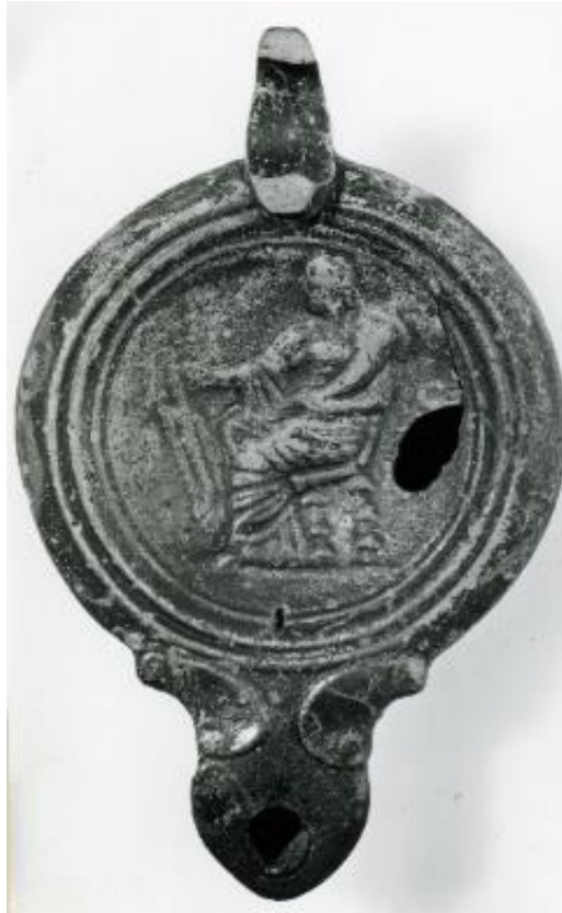
Görsel 2.43. MS 51-MS 100 yıllarına arasına tarihlendirilen, Pozzuoli 'de (İtalya/Napoli) bulunan ve üzerinde, oturan, sağ elinde yeke ve sol elinde cornucopia tutan Fortuna tasviri bulunan bir kandil. (Uzunluk: 13.90cm, Genişlik: 9cm) ( https://www.britishmuseum.org/collection/object/G_1856-1226-402 Erişim Tarihi 22.03.2023)