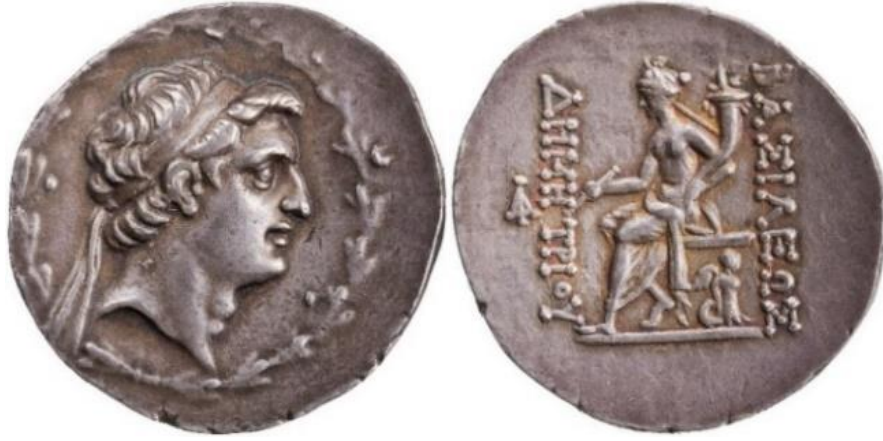
Görsel 1.7. I. Demetrios'un MÖ 162-MÖ 154 yılları arasında Antakya'da basılmış tetradrahmi (gümüş,). (16.67gr, 32mm)

ikonografide, Tykhe'nin oturduğu tahtın altında kanatlı bir dişi Triton (Tritoness) 107 bulunması da Tykhe'nin deniz ve denizcilik niteliği ile ilişkilendirilebilir. Bunlara ek olarak, Antakya'da basılmalarına rağmen bu sikkelerde Eutykhides'in Tykhe tasviri bulunmamaktadır. Bu durumdan anlaşılacağı üzere bir şehrin veya bir bireyin kişisel koruyucu Tykhe'si, Tykhe kavramının kapsadığı geniş anlam aralığının kendine özgü bir özelliğidir. Tykhe ikonografisinde özel, belirli ve kişisel olan Tykhe ile genel ve kapsamlı olan Tykhe karıştırılmamalıdır. 108