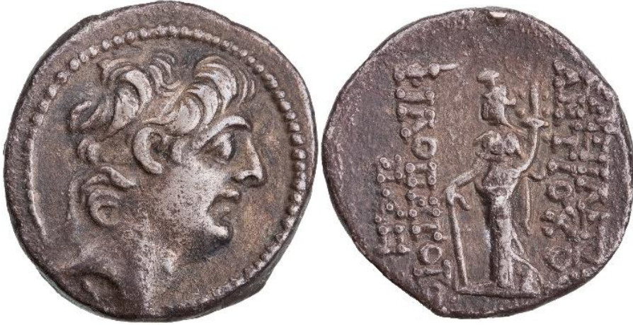
EK 11. MÖ 96-MÖ 95 yıllarında, Antakya’da basılmış bir drachmi (gümüş). Ön yüzde; diadem takmış ve sağa dönük bir şekilde duran IX. Antiokhos Kyzikenos ve arka yüzde; ΒΑΣΙΛΕΩΣ ΑΝΤΙΟΧΟΥ ΦΙΛΟΠΑΤΟΡΟΣ yazısı ve ayakta duran, başında kalathos bulunan, sağ elinde yeke ve sol elinde cornucopia tutan Tykhe. (3.86gr, 17mm) ( http://numismatics.org/collection/1944.100.76895 Erişim Tarihi 23.02.2023)