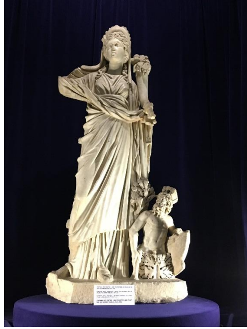
Görsel 2.67. Romanya'daki Köstence Ulusal Tarih ve Arkeoloji Müzesi'nde (Muzeul de Istorie Națională și Arheologie Constanța) bulunan ve MS 2. yüzyıla tarihlendirilen Fortuna heykeli. (1.55m) ( https://ro.wikipedia.org/wiki/Muzeul_de_Istorie_%C8%99i_Arheologie_din_Constan%C8%9Ba#/media/Fi%C8%99ier:Fortuna_cu_Pontos.jpg Erişim Tarihi 29.03.2023)