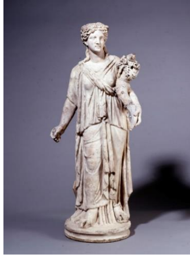
Görsel 2.14. MÖ 100- MS 30 yılları arasına tarihlendirilen ve ayakta duran, sağ elinde sadece yekenin kalan parçasını tutan ve sol elinde cornucopia tutan Fortuna heykeli. (93.98cm)

Hellenistik dünyadaki Tykhe gibi şehir duvarlarını temsil eden bir taç ile tasvir edilmemiştir. Çünkü artık kentin Fortuna'sını değil, Caesar'ın kişisel Fortuna'sını tasvir etmektedir. 233 Ayrıca Julius Caesar dönemindeki tanrıça Fortuna ikonografisine ek olarak MÖ 42 yılında basılan bir sikkede, doğrudan tanrıçaya yer verilmemiş ve isim olarak atıfta bulunulmamış olsa da tanrıçanın en ayırt edici ikonografik nitelikleri olan cornucopia , yeke, dünyayı temsil eden küre ve tanrı Hermes'in asası caduceusa bir arada yer verilmiştir (Görsel 2.15).