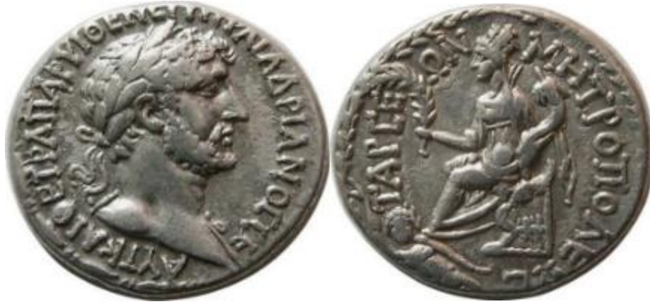
Görsel 2.55. İmparator Hadrianus döneminde, MS 117-MS 138 yılları arasında, Tarsus'da basılan tetrachmi. (RPC III 3260) (9.62gr, 25mm)

Hadrianus döneminde, özellikle Kilikya bölgesinde basılan sikkelerde; oturan, başında şehir duvarlarını temsil eden bir taç ve altında kişileştirilmiş bir nehir tanrısı bulunan, hurma dalı ve buğday başağı tutan Tykhe ikonografisi de sıklıkla kullanılmıştır. 331 Aynı ikonografiye cornucopia da eklenmiştir (Görsel 2.55). Ayrıca bu dönemde, Flaviuslar ve Traianus döneminde olduğu gibi, Dora'da (İsrail/Tantura) basılan, ayakta duran, sancak ve cornucopia taşıyan ve Ascalon'da (İsrail/Aşkelon) basılan, gemi pruvası üzerinde ayakta duran, sancak ve aplustrum taşıyan Tykhe tasvirleri de ikonografi de yer almıştır. 332 Ayrıca, başta Judea Eyaleti olmak üzere, Doğu eyaletlerinde basılan sikkelerde, ayakta duran, asa ve cornucopia tutan Tykhe ikonografisine de yer verilmiştir. 333