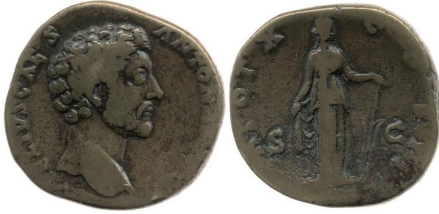
Görsel 2.62. İmparator Antoninus Pius döneminde, MS 155-156 yılında, Roma'da basılan sestertius. (RIC III Antoninus Pius 1329A) (23.52gr)

( https://www.britishmuseum.org/collection/object/C_1937-0607-105 Erişim Tarihi 28.03.2023)