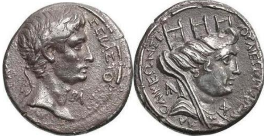
Görsel 2.23. İmparator Augustus döneminde, MÖ 16 yılında, Laodicea ad Mare'de (Suriye/Lazkiye) basılan bir denarius (RPC I 4381) (13.75gr, 26.2mm) ( https://rpc.ashmus.ox.ac.uk/coins/1/4381 Erişim Tarihi 22.03.2023)