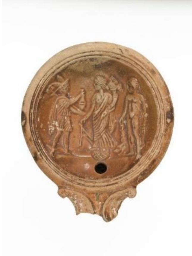
Görsel 2.32. MS 30-MS 70 yılları arasına tarihlendirilen, İtalya'da yapılan bir kandil (Uzunluk 10.30cm, Genişlik: 8.70cm)

astrolojide gök kubbeyi ve kader ile bağlantılı olan tüm yıldızları da temsil etmekteydi. Bu durum göz önüne alındığında kürenin Roma Dönemi'nde neden talih, şans ve kader tanrıçasının en önemli ikonografik özelliği haline geldiği daha net bir şekilde anlaşılmaktadır. Tykhe ve Fortuna Hellenistik ve Roma dininde, birbirlerinde bağımsız olarak, insanlar üzerinde çok etkili olmuşlar ve kişinin kaderini değiştirecek, talihini belirleyecek ve hayatını yönlendirecek güçlerle ilişkili hale gelmişlerdir. 277