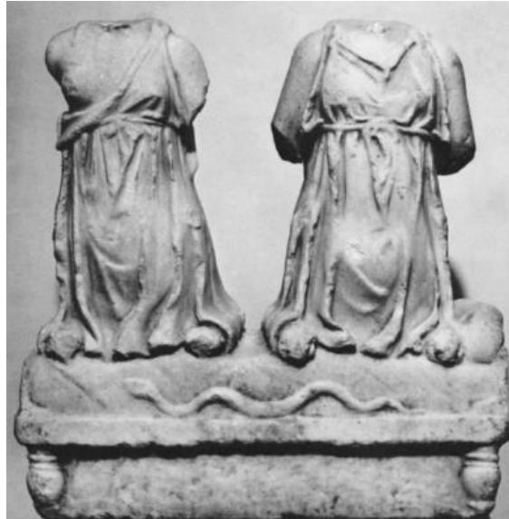
Görsel 2.8. Palestrina'da (Praeneste) Antium Fortunaları heykel grubu.

olmayan figürlerin sikkeler üzerindeki tasvirlerinden yola çıkılarak önde olan ve miğfer taktığı düşünülmekte olan figür, khiton giymiş bir şekilde ve sağ göğsü açıkta betimlenmiştir. Sağ eliyle bir kılıç kabzasını kavradığı ve bunu yatay bir şekilde tuttuğu düşünülmektedir. Burada savaşçı bir kimlik ile tasvir edilen Fortuna, Roma siyasi ve askeri sanatında oldukça yaygın bir şekilde kullanılan savaşçı Amazon kadın tipi ile tasvir edilerek, sadece Roma'yı değil, aynı zamanda Roma'nın erdemlerinin (Virtus) kişileştirilmelerini de temsil etmektedir. 198 Brendel'e göre bu figür kadın olmasına rağmen erkeksi arayışları ve istekleri temsil etmekte ve bu nedenle aslında Fortuna Virilis'i göstermektedir. Buna karşılık olarak ikinci figürün, bol dökümlü kumaşla süslenmesinden ve diadem benzeri bir taç ile ayırt edici bir özellik kazandırılmış olarak anaç bir şekilde tasvir edilmesinden dolayı, karşılığı olan kardeşinin, Roma'daki Fortuna kültlerinden birisinin epiteti olan ve kadın veya kadınsı gibi anlamlara gelen " muliebris " (Fortuna Muliebris) olarak tanımlanması gerektiğini ileri sürmektedir. 199 Ancak, daha sonraki araştırmacılar sikke üzerindeki figürleri " virilis " ve " muliebris " olarak değil, Amazon tipinde tasvir edilen ve elinde bir patera veya kılıç tuttuğu düşünülen figürü Fortuna Victrix (Muzaffer Fortuna) ve diğer taç takan ve saçları örgülü olan figürü ise Fortuna Felix (Şanslı/Mutlu Fortuna) olarak tanımlamışlardır. 200