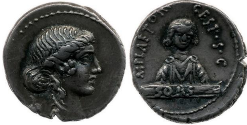
Görsel 2.11. MÖ 69-MÖ 68 yılında M. Plaetorius Cestianus tarafından Roma’da basılmış bir denarius.

oynaması ve kader, kura, kehanet ve talih gibi anlamlara gelen “SORS” sözcüğünün yer almasından dolayı bu sikkenin Fortuna’nın tasvir edildiği ilk sikke olduğu düşünülse de üzerinde tanrıça Fortuna’ya doğrudan bir atıfta bulunulmaması ve ayırt edici bir özelliğinin yer almaması sebebiyle kesin bir sonuca varılamamıştır.