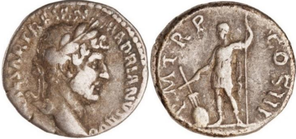
Görsel 2.52. İmparator Hadrianus döneminde, MS 121-MS 123 yılları arasında, Roma'da basılmış denarius. (RIC II, Part 3 Hadrian 567-571) (3.38gr, 17mm)

yeniden yaratmaya çalışmıştır. Kısacası Hadrianus, kendi dönemine kadar uygulanan dış politikanın aksi bir siyaset izlediği için, otoritesini haklı çıkarmak ve meşrulaştırmak adına militarist özellikle sahip olmayan bir Fortuna Redux imajı yaratmış ve onu benimsemiştir. 328