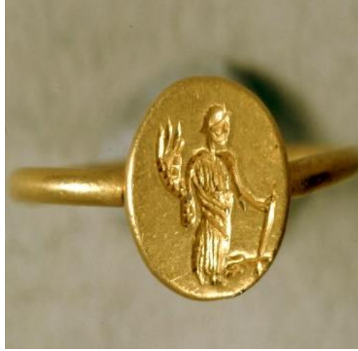
Görsel 2.76. MS 3. ve MS.4 yüzyıllar arasında tarihlendirilen ve Girit Adası'nda bulunan bir altın yüzük. (4.27gr, 1cm)

( https://www.britishmuseum.org/collection/object/G_1896-1016-5 Erişim Tarihi 29.03.2023)