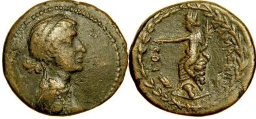
Görsel 2.19. VII. Kleopatra döneminde, MÖ 37-MÖ 36 yıllarında, Damascus'da basılan Æ (bronz, bakır, pirinç ve metal alaşım sikke). (RPC I 4781) (10.17gr, 25mm) ( https://rpc.ashmus.ox.ac.uk/coins/1/4781 Erişim Tarihi 06.03.2023)

Fortuna'nın hem Marcus Antonius'un hem de Octavianus'un sikkelerinde neredeyse aynı zamanda ortaya çıkması, iki rakip arasındaki görsele dökülerek yapılan güç mücadelesini açıkça gözler önüne sermektedir. Bu liderlerin sikkelerindeki Fortuna'nın tekrarı, onların tanrıça ile olan ilişkileri hakkındaki edebi tanıklığı da yansıtmaktadır. Örneğin, Plutarkhos, “ De Fortuna Romanorum ” (Romalıların Fortunası Üzerine) adlı eserinde Octavianus'un bir zar oyununda Marcus Antonius'u her zaman yendiğinden bahsetmektedir. 239 Kanımızca, Julius Caesar zamanında Fortuna Kültü'nün siyasi meşruluk açısından önemli bir hale gelmesiyle birlikte bu dönemde, halkın gözünde Fortuna'nın lütfuna sahip olmak ve onun koruması altına girmek büyük önem arz etmeye başlamış ve bu durum hem ikonografide hem de edebiyatta kendisini etkili bir biçimde göstermiştir.