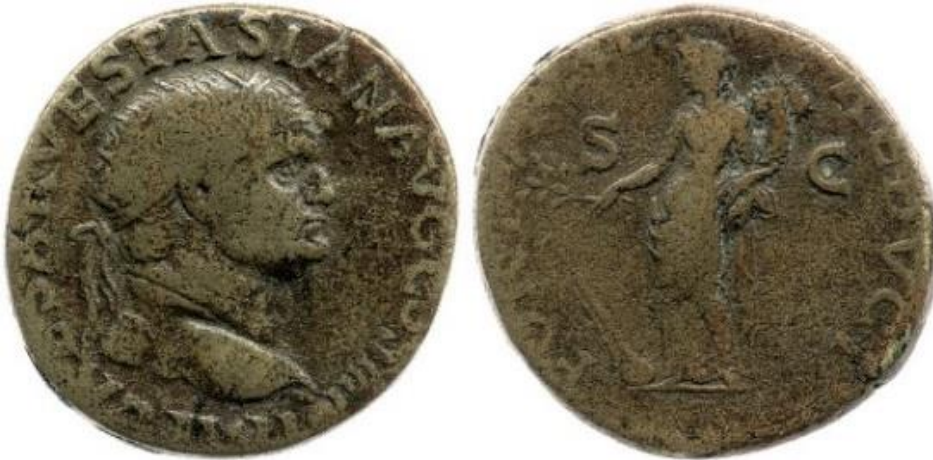
EK 19. MS 72 yılında, Lugdunum'da basılmış bir dupondius (bronz alaşım). Ön yüzde; IMP CAESAR VESPASIAN AVG COS IIII yazısı ve ışınlar ile donatılmış bir taç takmış ve sağa dönük bir şekilde duran imparator Vespasianus ve arka yüzde; FORTVNAE REDVCI yazısı ve ayakta duran, sağ elinde bir kürenin üzerinde duran yeke ve hurma dalı ve sol elinde cornucopia tutan Fortuna. (12.71 gr) (RIC II, Part 1 Vespasian 75) ( https://www.britishmuseum.org/collection/object/C_R-10680 Erişim Tarihi 20.03.2023)