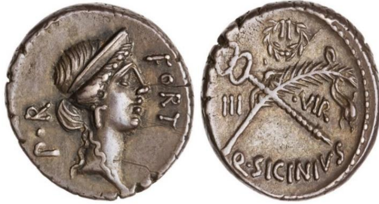
Görsel 2.12. MÖ 49'da Q. Sicinius tarafından Pompeius adına Roma'da bastırılan denarius. (RRC 440/1) (3.83gr)

( http://numismatics.org/collection/1944.100.3257 Erişim Tarihi 04.03.2023)