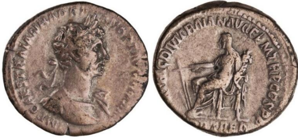
Görsel 2.50. İmparator Hadrianus döneminde, MS 117 yılında, Roma'da basılmış denarius. (RIC II, Part 3 Hadrian 17) (3.4gr, 17mm)

Bunun yanında Hadrianus, hükümdarlığının başlarında iki tip Fortuna tasvirine daha yer vermiştir. Bunlardan birisi Traianus'un ikonografisinin devamı olan; oturan, başında kalathos bulunan veya bulunmayan, yeke ve cornucopia tutan Fortuna/Tykhe tasviridir (EK 42 ve EK 43). 326 İkincisi ise oturan Fortuna ikonografisindeki yekenin altına bir küre eklenmiş tasvirdir (Görsel 2.50). İlerleyen dönemlerde ise bu iki ikonografiye ek olarak, ayakta duran veya oturan, patera ve cornucopia tutan Fortuna tasvirleri de karşımıza çıkmaktadır (Görsel 2.51). 327