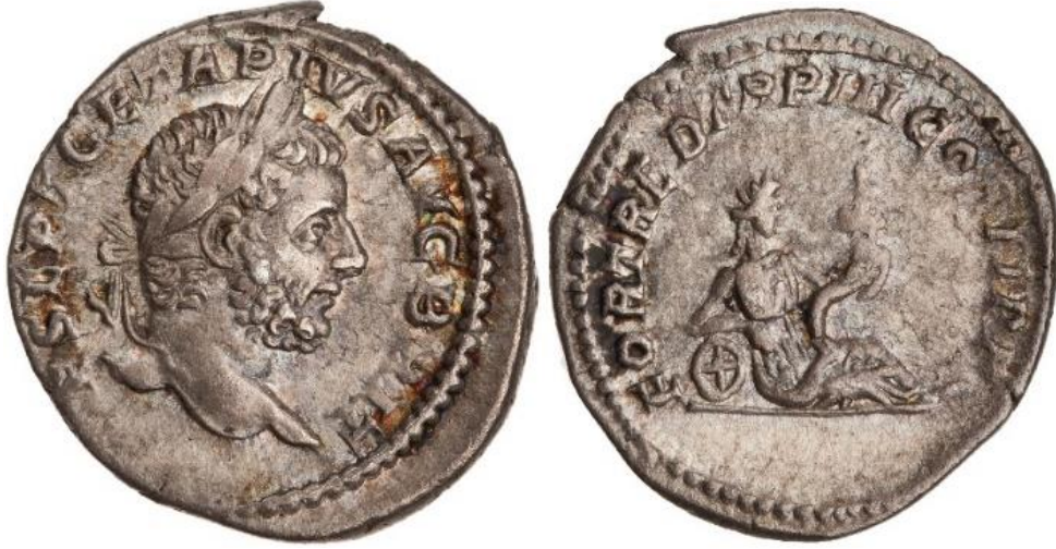
Görsel 2 82. İmparator Geta döneminde, MS 211 yılında, Roma'da basılan gümüş. (RIC IV Geta 77) (3.2gr, 19mm)

çark ile gösterilen Fortuna, Caracalla ve Geta'nın, Britanya'dan Roma'ya güvenli ve sağ salim dönüşlerini ifade etmektedir (Bkz. EK 74). 401 Ayrıca Caracalla'nın sikkelerinde, ayakta duran, yeke ve cornucopia tutan Fortuna tasvirlerine de yer verilmiştir. 402 Ayrıca Geta'nın MS 211 yılında basılan bir sikkesinde Fortuna ilk kez karşımıza, çarkın üzerine yaslanmış bir şekilde yerde oturmakta ve sol elinde cornucopia tutmaktadır (Görsel 2.82).