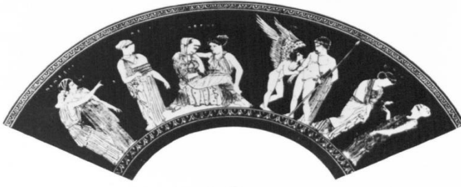
EK 1. Berlin amphoriskosu üzerindeki Helen'in ikna edilmesi sahnesi. (Kershaw, 1984)