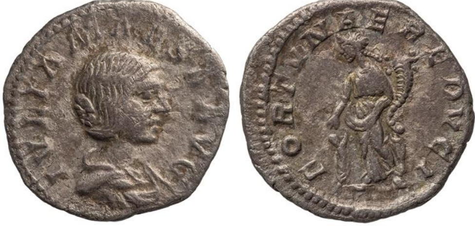
Görsel 2 84. İmparator Elagabalus döneminde, MS 218-MS 222 yılları arasında, Roma'da basılan denarius. (RIC IV Elagabalus 252) (3.36gr, 19mm)

edilmesini sağlamıştır. İmparatorluğun otoritesinin, hükümet sisteminin ve kurumlarının güvenliğini ve devamlılığını sağlayan bir tanrıça olan Fortuna'nın, imparatorluk gücünün anahtarı olan koruyucu kadın figürü ile ilişkilendirilmesi, iktidarın meşrulaştırılması açısından oldukça önemli bir gelişme olmuştur. 407