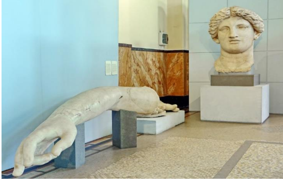
Görsel 2.7. Largo Argentina'daki Fortuna Huiusce Diei Tapınağı'nın kalıntıları altında bulunan Fortuna kültüne ait olduğu düşünülen ve boyutunun yaklaşık 8 metre olduğu hesaplanan kült heykelinin baş, kol ve ayak parçaları.

( https://commons.wikimedia.org/wiki/File:0670_framenti_della_statua_colossale_%22Fortuna_Huiusce_Diei%22_del_Tempio_B_dell%27Area_Sacra_di_Largo_Argentina,_opera_di_Skopas_Minore_II_sec._a_.C.jpg Erişim Tarihi 02.03.2023)