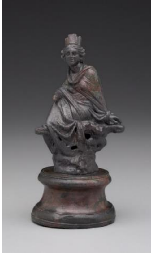
Görsel 2.48. Eutykhides'in Antakya Tykhesi tasvirinin Roma dönemine (MS 1.veya 2.yüzyıllar) ait bronz kopyası. Boy:15.8 cm.

( https://artgallery.yale.edu/collections/objects/7257 Erişim Tarihi 24.02.2023)