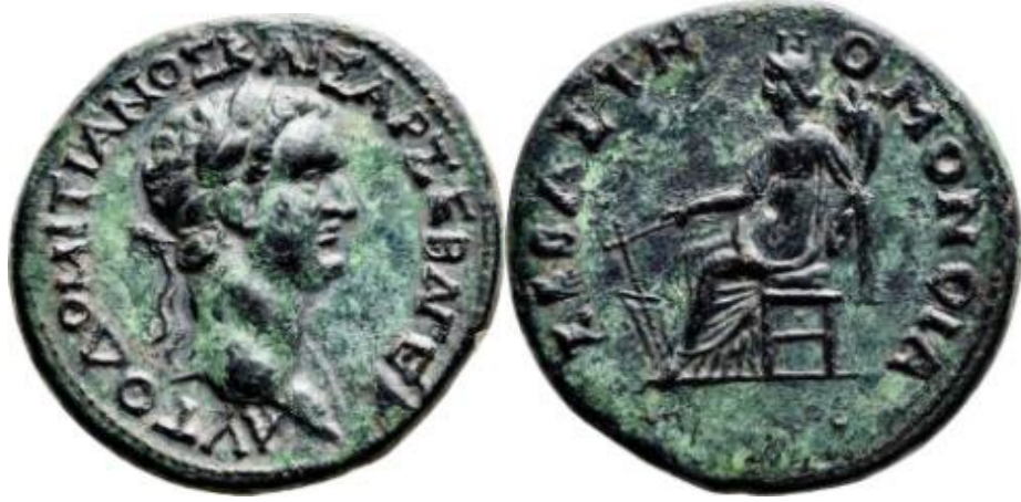
Görsel 2.42. İmparator Domitianus döneminde, MS 81-MS 96 yılları arasında, Bithynia eyaletinin Prusias ad Hypium (Düzce/Konuralp) kentinde basılan bir Æ. (RPC II 683) (12.75gr, 27mm) ( https://rpc.ashmus.ox.ac.uk/coins/2/683 Erişim Tarihi 21.03.2023)