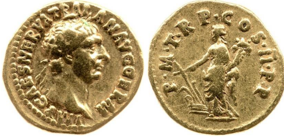
Görsel 2.45. İmparator Traianus döneminde, MS 98/99 yılında, Roma'da basılmış bir aureus. (RIC II Trajan 4) (7.43gr,19mm)

yönetme konusundaki amaç ve isteklerini belirten bir mesaj taşımaktadır. 308 Traianus döneminde ayrıca, ayakta duran, yeke ve cornucopia taşıyan Fortuna/Tykhe ikonografisi kullanılmaya devam edilmiştir (Bkz. EK 35). 309