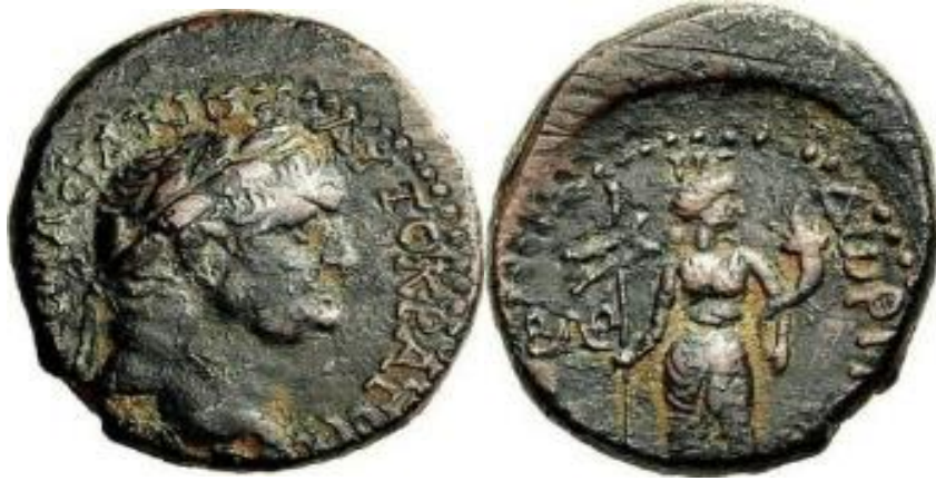
Görsel 2.39. İmparator Vespasianus döneminde, MS 69-MS 70(?) yıllarında, Dora'da basılan bir bronz sikke. (RPC II 2088) (9.27gr, 22mm)

( https://rpc.ashmus.ox.ac.uk/coins/2/306 Erişim Tarihi 21.03.2023)