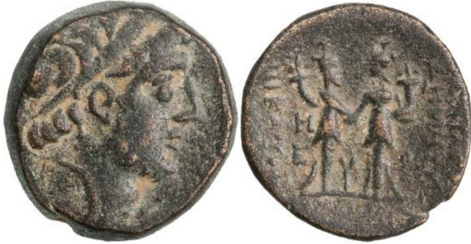
Görsel 1.8. II. Demetrios döneminde, MÖ 145-MÖ 139 yılları arasında Nisibis’de basılan bronz sikke. (7.91gr)