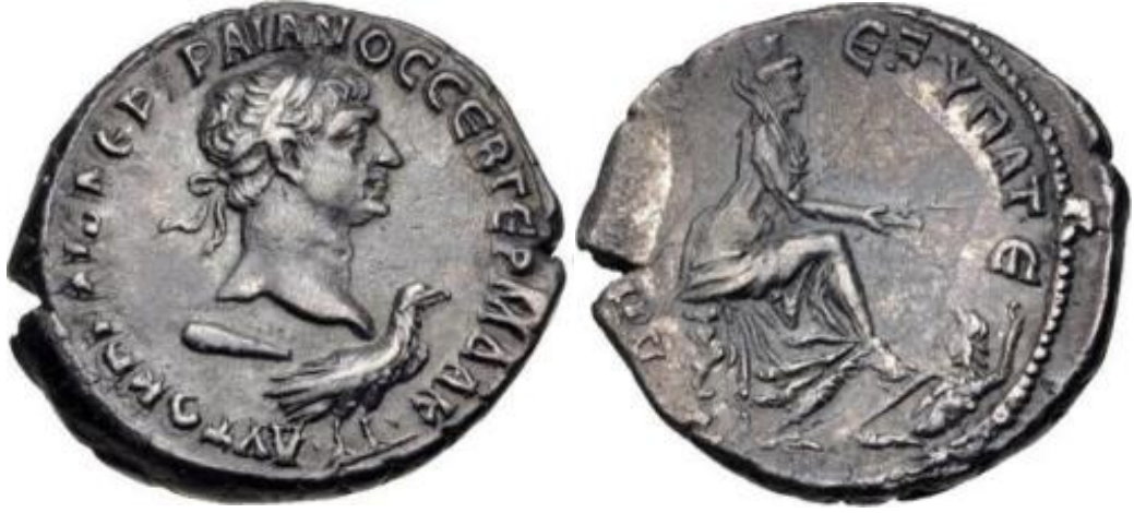
Görsel 2.47. İmparator Traianus döneminde, MS 103-MS 111 arasında Antakya’da basılmış tetradrahmi.

olsa da yine de bazı sorunlarla karşılaşmaktadır. Özellikle Traianus döneminden itibaren Antakya’da basılan veya başka yerde basılıp Antakya Tykhe’sini tasvir eden sikkelerde belirli değişiklikler göze çarpmaktadır. MS 115 yılındaki Antakya depreminden önceki bazı sikkelerde, tasvirin niteliklerinin değiştiği görülmektedir. Genel yapı aynı olsa da Antakya ve çevresindeki sikkelerde Tykhe, artık hurma dalı yerine bir veya iki tahıl demeti ya da meyve veya çiçek tutmaktadır. (Görsel 2. 47). MS 2. yüzyılda ait eserlerde de hurma dalı veya nehir kişileştirilmesi eksik veya kayıp olsa da tasvir için kullanılan temel kompozisyon aynıdır (Görsel 2.48). Antakya Tykhe’si kompozisyonu, Traianus döneminde diğer Doğu kentlerinde basılan sikkelerde de karşımıza çıkmaktadır. 318