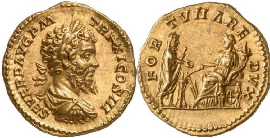
Görsel 2.81. İmparator Septimius Severus döneminde, MS 203 yılında, Roma'da basılan aureus. (RIC IV Septimius Severus 188) (7.24gr, 20mm)

Septimius Severus dönemine ait farklı türlerde yapılmış birçok Fortuna tasvirine ek olarak bu dönemin en dikkat çeken ikonografisi, MS 203 yılında basılan bir sikkede görülmektedir. Bu sikkede; oturan, oturduğu tahtın altında bir çark bulunan, sağ elinde bir yeke ve sol elinde cornucopia tutan Fortuna'nın önünde başı örtülü ve toga giymiş bir şekilde üç ayaklı bir sehpanın önünde ayakta duran imparator Septimius Severus, sağ elinde tuttuğu bir patera ile tanrıçaya sunuda bulunmaktadır (Görsel 2.81). Kanımızca burada, sol elinde tuttuğu yekeyle insanların hayatını, talihini ve kaderini yönlendiren, sağ elinde tuttuğu cornucopia ile bereketi sağlayan Fortuna, değişkenliği ve belirsizliği temsil eden çarkın üstündeki bir tahta oturarak kalıcı hale gelmiş ve çarkın dönüşü durmuştur. Septimius Severus ise kalıcı hale gelen ve refah sağlayan Fortuna'ya şükranlarını sunarak onun, Roma İmparatorluğu'nun egemen tanrıçası olduğunu göstermektedir.