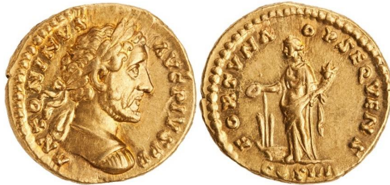
Görsel 2.60. İmparator Antoninus Pius döneminde, MS 145-MS 161 yılları arasında, Roma'da basılan aureus. (RIC III Antoninus Pius 139) (7.23gr, 17.5mm)