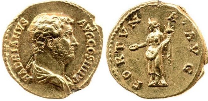
Görsel 2.51. İmparator Hadrianus döneminde, MS 117 yılında, Roma'da basılmış aureus. (RIC II, Part 3 Hadrian 2010) (7.06gr 20mm)

( https://www.britishmuseum.org/collection/object/C_1996-0316-94 Erişim Tarihi 24.03.2023)