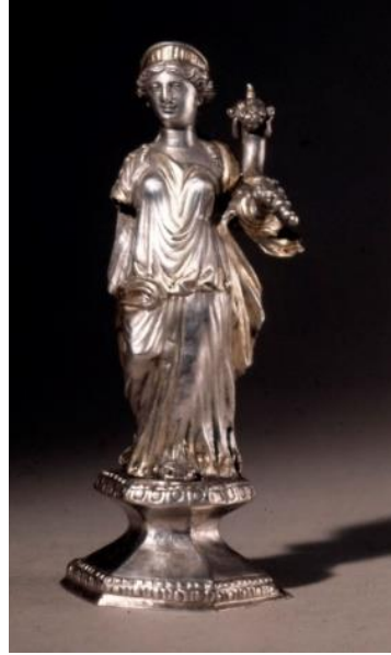
Görsel 2 75. Severus Hanedanlığı dönemine, MS 200-MS 225 yılları arası tarihlendirilen, Galya'da (Fransa) yapılmış ve büyük ihtimalle masa süslemesi için kullanılan bir Fortuna heykelciği. (12.80cm)

ikonografilerini oluşturan bir imparatorudur. Septimius Severus'un bastırıldığı sikkelerde, Fortuna Redux epiteti ile kullanılan ve tanrıçanın askeri niteliklerinin vurgulandığı ikonografide tanrıça, oturmakta veya ayakta durmakta, sağ elinde yeke (küre üzerinde veya yerde) ve sol elinde cornucopia tutmaktadır. 385 Bunlara ek olarak Septimius Severus; oturan, oturduğu tahtın altında çark bulunan, sağ elinde bir küre üzerinde duran yeke ve sol elinde cornucopia tutan Fortuna 386 (Bkz. EK 65), ayakta duran, sağ elinde bir küre üzerinde duran yeke ve sol elinde cornucopia tutan Fortuna 387 (Bkz. EK 66) ve ayakta duran, sağ elinde cornucopia ve sol elinde yeke tutan ve gemi pruvası ile tasvir edilen Fortuna (Bkz. EK 67) betimlerini de kullanmıştır. Ayrıca Severus Hanedanlığı döneminde, sol elinde cornucopia ve sağ elinde yeke tutan Fortuna heykelcikleri ve üzerinde Fortuna'nın bulunduğu yüzükler de karşımıza çıkmaktadır (Görsel 2.75 ve 2.76).