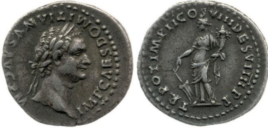
EK 25. MS 82 yılında, Roma’da basılmış bir denarius. Ön yüzde; IMP CAES DOMITIANVS AVG P M yazısı ve defne yaprakları ile süslenmiş bir taç takmış ve sağa dönük bir şekilde duran imparator Domitianus ve arka yüzde TR POT IMP II COS VIII DES VIII P P yazısı ve sola dönük bir şekilde ayakta duran bir yeke ve sol elinde cornucopia tutan Fortuna. (3.41gr) (RIC II, Part 1 Domitian 141) ( https://www.britishmuseum.org/collection/object/C_BNK-R-312 Erişim Tarihi 21.03.2023)