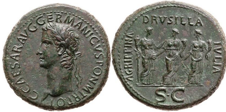
Görsel 2.27. İmparator Caligula tarafından MÖ 37/38 yılında, Roma'da basılan sestertrius (bronz sikke). (RIC I Gaius/Caligula 33) (28.47gr, 36mm)

İmparator Caligula, MÖ 37/38 yılında bastırıldığı bir sikkede, kız kardeşlerinden Julia'yı cornucopia ve yeke ile betimleyerek onu Fortuna olarak tasvir ettirmiştir (Görsel 2.27). Bu dönemde batıda basılan sikkelerde, Fortuna ile alakalı sadece bu tip Fortuna tasviri bulunmaktadır. Doğuda basılan sikkelerde ise ayakta duran, sağ elinde yeke ve sol elinde cornucopia tutan Tykhe tasvirine yer verilmiştir (Bkz. EK 14). Aynı zamanda Kilikya'da basılan sikkelerde Tykhe, Antakya Tykhe'si tipinde, bir kaya üzerinde sağa dönük bir şekilde oturur vaziyette, başında şehir duvarlarını temsil eden bir taç, elinde buğday başağı ve altında bir nehir tanrısının kişileştirilmesi şeklinde betimlenmiştir. 268