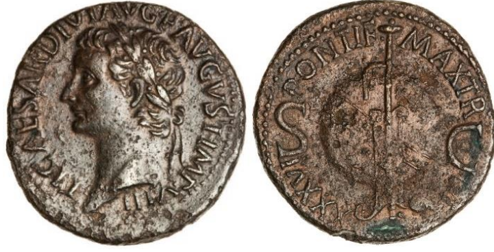
Görsel 2.25. Tiberius döneminde, MS 34-MS 35 yılında bastırılan bronz sikke. (RIC I Tiberius 52) (11.24gr, 27.5mm)

( http://numismatics.org/collection/1944.100.39293 Erişim Tarihi 21.03.2023)