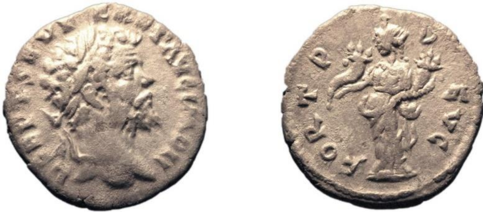
Görsel 2.79. İmparator Septimius Severus döneminde, MS 194 yılında, Antakya'da basılan denarius. (RIC IV Septimius Severus 449A) (2.93gr)

( https://www.britishmuseum.org/collection/object/C_R1946-1004-801 Erişim Tarihi 29.03.2023)