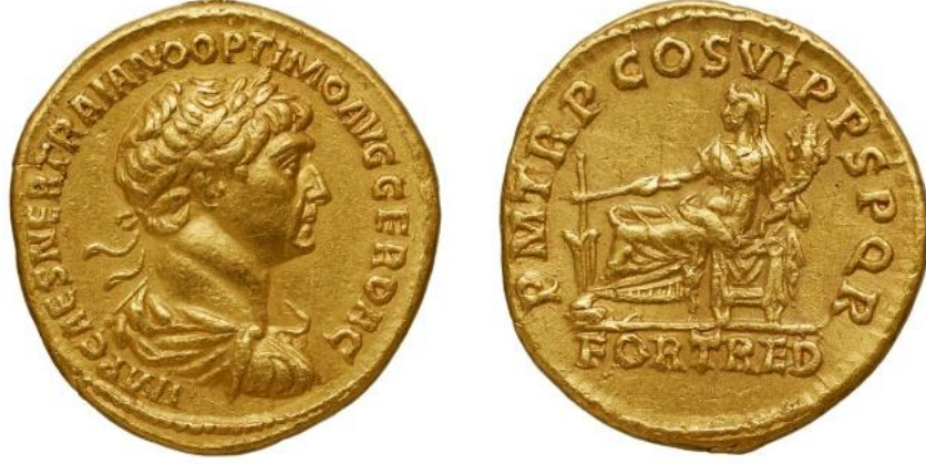
Görsel 2.46. İmparator Traianus döneminde, MS 114 yılında, Roma'da basılan aureus. (RIC II Trajan 318) (7.17gr)

ve Roma imparatorluğunu ve imparatorunu daima koruyacağını mesajını vermek istemiştir.