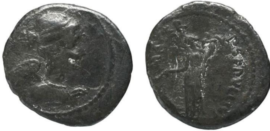
Görsel 2.13. MÖ 44 yılında P. Sepullius Macer tarafından bastırılan quinarius (gümüş sikke). (RRC 480/25) (1.65gr, 15mm)