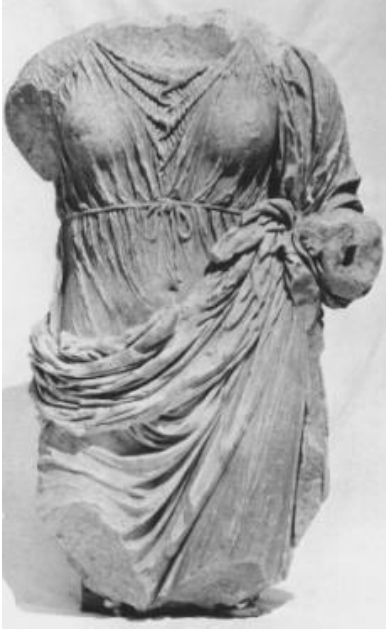
EK 6. Atina Agorası'nda bulunan ve MÖ 325 yılına tarihlendirilen ve kırık olan kolunun kıvrımında dolayı cornucopia tuttuğu varsayılp, Tykhe'ye ait olduğu düşünülen heykel. (1.54m) (Palagia, 1994)