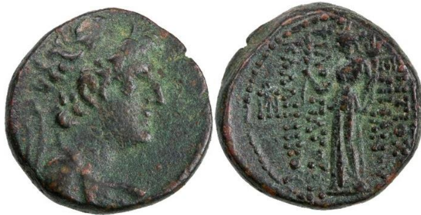
Görsel 1.13. Seleukos hükümdarı XII. Antiokhos Dionysos döneminde, MÖ 87-MÖ 85 yılları arasında, Damascus'da (Suriye/Şam) basılan bronz sikke. (8.64gr, 21mm)

Seleukos hükümdarı ve Suriye kralı XII. Antiokhos Dionysos (MÖ 87-MÖ 82) döneminde ayakta duran, sağ elinde hurma dalı ve sol elinde cornucopia tutan Tykhe ikonografisi de bu dönemde ilk kez karşımıza çıkmaktadır (Görsel 1.13). Genellikle Suriye, Mezopotamya, İsrail ve Filistin bölgelerindeki sikkelerde görülen ve o bölgelere ait ayırt edici bir ikonografik özellik olan hurma dalı, yukarıda da gördüğümüz gibi Antakya Tykhe'sinin ayırt edici bir özelliği haline gelmiş ve diğer Tykhe ikonografilerinde de barışı ve zaferi sembolize etmek için yaygın bir şekilde kullanılmıştır.