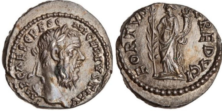
Görsel 2.74. İmparator Pescennius Niger döneminde, MS 193-MS 194 yıllarında, Antakya'da basılan denarius. (RIC IV Pescennius Niger 22) (4.34gr, 18.4mm)

tutmaktadır (Görsel 2.74). 383 Bu dönemin ortak imparatorlarından Clodius Albinus ise; hem ayakta duran, sağ eliyle küre üzerinde bulunan yeke ve sol eliyle cornucopia tutan hem de oturan, sağ eliyle bir küre üzerinde bulunan yeke ve sol eliyle cornucopia tutan ve oturduğu tahtın altında çark bulunan tasviri kullanmıştır (Bkz. EK 64). 384 Bu istikrarsız dönemde tahta çıkan veya ortak olmaya çalışan imparatorlar, kısa zaman içerisinde hakimiyetlerini meşrulaştırmak için tanrıçanın çeşitli ikonografilerini kullanarak kendilerini seleflerine bağlamaya ve tanrıçanın koruması altına girmeye çalışmışlardır. Geç Cumhuriyet Dönemi'ndeki iç savaşlarda ve iktidar mücadelesinde görülen bir durum olan, Fortuna'yı kendi tarafına çekme, tanrıça ve onun ikonografisi üzerinden propaganda yapma ve meşruluk sağlama mücadeleleri, istikrarsız geçen bu dönemde de karşımıza çıkmaktadır.