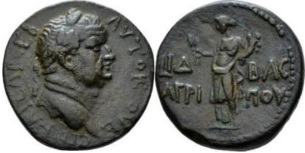
Görsel 2 41. İmparator Vespasianus döneminde, MS 73-MS 74 yıllarında, Tiberias’da (İsrail/Tiberya) basılan Æ . (RPC II 2244) (15.27gr, 25mm)

Flavius Hanedanlığı döneminde, Hellenistik Dönem’de Tykhe’nin doğu kentlerindeki ikonografisinde gördüğümüz buğday başağı, başta Suriye, Filistin ve İsrail olmak üzere doğu kentlerinde basılan sikkelerde yer almıştır. 297 Bu sikkelerde Tykhe ayakta durmakta, başında bir kalathos taşımakta, sağ elinde buğday başağı ve sol elinde cornucopia tutmaktadır (Görsel 2.41). 298 Genellikle Fortuna’nın ikonografisini askeri anlamda kullanan Flaviuslar, tanrıçanın doğudaki temsillerinde bolluk, bereket ve refah niteliklerini de ön plana çıkararak, bu toprakların Roma için ne kadar önemli olduğunun vurgusunu yapmışlar ve bu bölgelerin tanrıçanın koruması altında ve imparatorların kontrolünde olduğunu göstermek ve vurgulamak istemişlerdir.