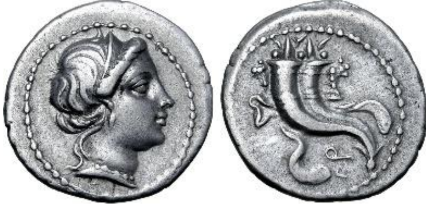
Görsel 2.10. MÖ 81 yılında Sulla tarafından bastırılmış bir denarius. (RRC 375/2) (3.91gr, 20mm) ( https://www.coinarchives.com/a/lotviewer.php?LotID=2121219&AucID=5069&Lot=868&Val=f9c41aa7995dabb78fde5d4f987787c Erişim Tarihi 03.03.2023)