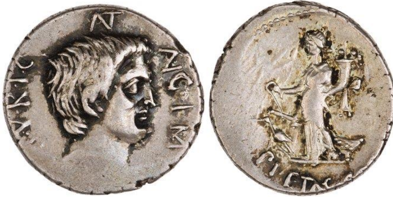
Görsel 2.17. MÖ 41 yılında Marcus Antonius tarafından bastırılan denarius. (RRC 516/2) (3.97gr) ( http://numismatics.org/crro/results?q=RRC+516%2F3 Erişim Tarihi 06.03.2023)

Octavianus, Marcus Antonius'un Caesar ve Fortuna üzerinden yaptığı propaganda ve meşrulaştırma çabalarına cevap vermekte gecikmemiştir. Caesar'ın meşru varisi olarak Octavianus'un kendisini savunması daha kolay olmuştur. MÖ 40 yılında Tiberius Sempronius Gracchus tarafından, ön yüzünde Octavianus'un hafif sakallı bir şekilde yapılan tasviri ve DIVI IVLI F yazısı ve arka yüzünde ayakta duran, sağ elinde yeke ve sol elinde cornucopia tutan bir Fortuna tasviri yer alan altın sikke bastırılmıştır (Görsel 2.18). Octavianus'un Caesar'ın kişisel fortunasını kendisine mâletmesi ve tanrıçanın ikonografik gücünü iyi bir şekilde kullanması, onun siyasi egemenlik hakkını meşrulaştırmasını sağlamıştır. Bu durum tam olarak Fortuna Caesaris'in bir tapınma nesnesi haline gelmesi anlamına gelmese de Divius Julius (Tanrısal Julius) kültürünün gelişiminde önemli bir rol oynamıştır. 237 MÖ 41-MÖ 40 yılları arasında, Marcus