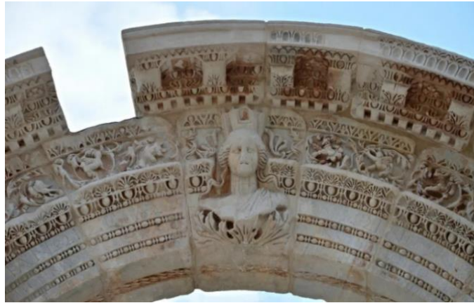
Görsel 2 57. Ephesus kentindeki Hadrianus Tapınağı'nın kemeri üzerinde bulunan, kent duvarlarını temsil eden taç takmış Tykhe başı.

Kent duvarlarını temsil eden bir taç takmış koruyucu Tykhe tasviri, Roma sikkelerinde, anıtlarında ve tapınaklarında koruyucu bir tanrıça olarak sıklıkla yer almıştır. Kentin koruyucu tanrıçası olarak Tykhe tasvirinin bir tapınak üzerinde öne çıkan örneklerinde bir diğeri de Ephesus'daki Hadrianus Tapınağı'nın, merkezi cephesindeki ara sütunların üzerindeki kemerde bulunan bir kilit taşı üzerinde görülmektedir (Görsel 2.57).