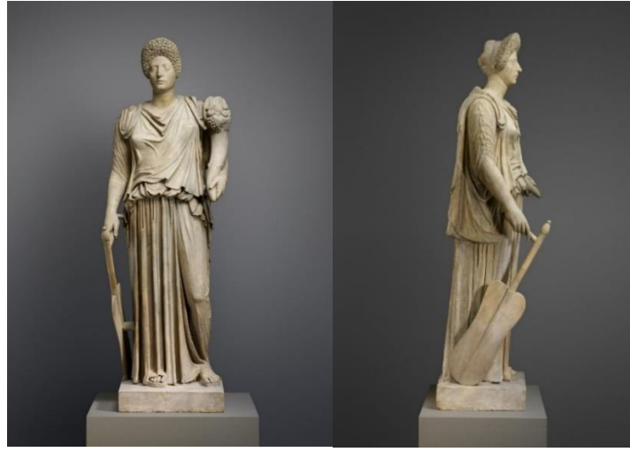
Görsel 2.34. MS 1.yüzyıl veya MS 2.yüzyıl başlarına tarihlendirilen, sağ elinde yeke ve sol elinde cornucopia tutan Fortuna heykeli. Boyu: 190.5 x 66 x 58.4 cm

üzerinde ayakta durduğu veya elinde tuttuğu bir gemi pruvası ve küre eklenmiştir. Ayrıca bu dönemde Fortuna'nın hurma dalı, yeke ve cornucopia (Bkz. EK 19) veya barış ve seyahatin sembolü caduceus ve dünyayı temsil eden küre ile yapılan tasvirleri de sikkelerde yer almıştır (Bkz. EK 20 ve EK 21). Tüm bunlara ek olarak Flavius Hanedanlığı döneminde, Fortuna'nın yeke ve cornucopia ile yapılan geleneksel ikonografisi heykel sanatında da karşımıza çıkmaktadır (Görsel 2.34).