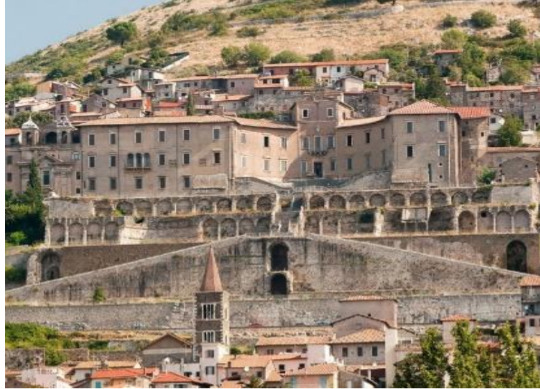
Görsel 2.2. İtalya'nın Palestrina (Praeneste) kentindeki Fortuna Primigenia Tapınağı'nın kalıntıları ve üzerindeki Barberini Sarayı.

( https://www.wetheitalians.com/default/sanctuary-fortuna-primigenia-palestrina Erişim Tarihi