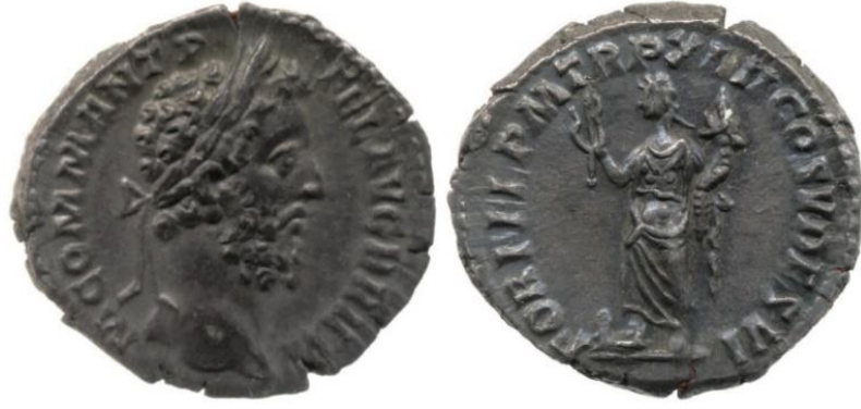
Görsel 2.72. İmparator Commodus döneminde, MS 189 yılında, Roma'da basılmış bir denarius. (RIC III Commodus 186) (3.337gr)

( https://www.britishmuseum.org/collection/object/C_1912-0710-300 Erişim Tarihi 28.03.2023)