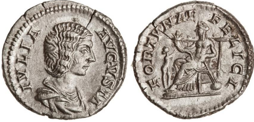
Görsel 2.80. İmparator Septimius Severus döneminde, MS 196-MS 211 yılları arasında, Roma'da basılan denarius. (RIC IV Septimius Severus 554) (3.56gr, 19mm) ( http://numismatics.org/collection/1944.100.51237 Erişim Tarihi 29.03.2023)

Severus Hanedanlığı, Nerva-Antoninus Hanedanlığı'nın aileye ait Fortuna Kültü'nü benimsemiş, Antoninusların yatak odalarında tutukları Fortuna heykeline ibadet etmiş ve onlar da aynı heykeli yatak odalarında saklamışlardır. Septimius Severus, oğulları Caracalla (MS 198-MS 217) ve Geta (MS 209-MS 211) için bu heykelin kopyasını yaptırmak iste de heykelin kopyasının yapılmasından vazgeçilmiş ve Antoninusların yatak odalarında tuttuğu heykel, Septimius Severus'un oğullarının odasına konulmuştur. 398 Bu heykelin niteliklerine dair bir bilgi elimizde mevcut değildir. Hanedanlığını Antoninuslara bağlamak ve hanedan ardılığını garanti altına almak isteyen Septimius Severus, Antoninuslar döneminde yapılmış iki Fortuna tapınağının ve Fortuna Augusta'ya adanmış bir kemerin bulunduğu Kuzey Afrika'da bulunan bir kent olan Leptis Magna'da (Libya), MS 200 yılında, üzerinde Fortuna'nın da yer aldığı Septimius Severus Kemerini inşa ettirmiştir. Bu kemer üzerindeki sahnede Fortuna, Septimius Severus'un üzerinde durmaktadır. Burada imparator oğlu Caracalla'nın elini tutmakta ve Geta da onların arasında durmakta, sağ elinde paterna , sol elinde cornucopia taşıyan ve başında Hellen tanrıçalarına özel polos takmış Julia Domna, büyük ihtimalle Fortuna'nın bir tezahürü olarak onların üzerinde yer almaktadır. 399