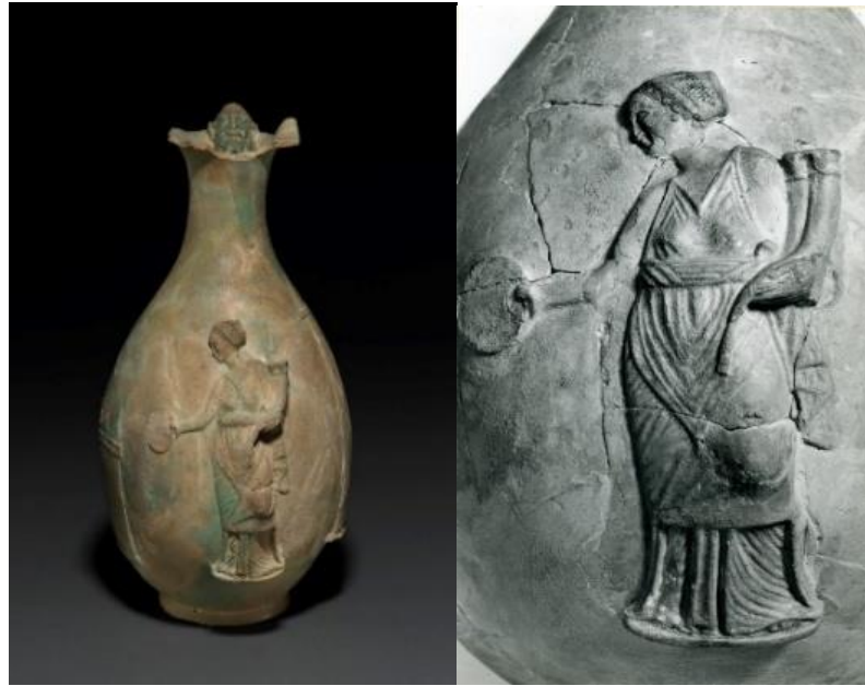
Görsel 1.5. MÖ 270-240 yılları arasına tarihlendirilen bir oinochoe üzerinde, sağ elinde sunuda bulunduğu ( libasyon ) phiale ve sol elinde bir dikeras tasvir edilen kraliçe II. Arsinoe.

Oinochoe üzerindeki yazıtlarda geçen Agathe Tykhe ibaresinin, kraliçe II. Arsinoe yaşarken mi yoksa ölüyken mi adandığı da belirsizdir ve bu delile göre bir sonuca varılması mümkün gözükmemektedir. Buradaki Tykhe'nin, kraliçenin kişisel daimonu olduğu düşünülürse, ikonografinin bu anlayışı çok iyi bir şekilde yansıttığı söylenebilmektedir. Thompson'a göre figür, kraliyet tacı ( diadem ) taktığı ve yüz hatlarının insanlığını vurgulamak üzere karakterize edildiği için tanrıça Tykhe'den ziyade kraliçe Arsinoe'yi temsil etmektedir (Görsel 1.5). Ancak burada kraliçenin kutsallığının vurgulanması için diğer tanrı veya tanrıçalar gibi çıplak ayakla tasvir edilmesi, kutsallığın bir işareti olsa da bu durum sadece kraliçenin kutsal alana olan saygısının bir göstergesi de olabilir. Böylece kraliçe, elindeki cornucopia ve dikeras ile tanrıça olarak hareket eden bir insan olarak gösterilmektedir. Kraliçe II. Berenike, II. Arsinoe'nin kişisel sembolü olan dikerası değil, tanrıça Tykhe'nin sembolü olan cornucopiayı kullanmaktadır. II. Berenike ile Agathe Tykhe ismi oinochoe üzerinde tutulsa da sunaklardan çıkarılmıştır. Böylece bu ikonografi geleneksel bir tanrıçanın temsili haline gelmiş, kişisel Tykhe unutulmuş ve kraliçe, tanrıça Tykhe ile birleştirilmiştir. 79