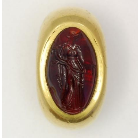
Görsel 1.12. Hellenistik Döneme, MÖ 323- MÖ 31, yılları arasında tarihlendirilen, Al- Hillah'da (Irak) bulunan ve üzerinde, ayakta duran, sağ elinde cornucopia ve sol elinde yeke tutan Tykhe tasviri bulunan altın yüzük. (28.62gr, 2.20cm)

( https://www.britishmuseum.org/collection/object/G_1917-0501-387 Erişim Tarihi 23.02.2023)