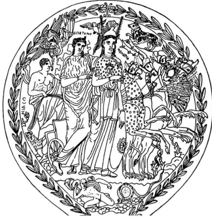
Görsel 2.3. Palestrina'daki (Praeneste) Colombella nekropolünden bir aynanın reproduksiyonu.

atlar tarafından sürülen bir araba ile İakkhos'un 162 Latin karşılığı olan Hiaco'nun kazandığı bir zafer tasvir edilmektedir. 163 Kanımızca bu sahnede Fortuna'yı, akıl ve bilgelik tanrıçası Minerva ile betimleyerek, Hiaco'nun zafer kazanmasında talih ve şansında rol oynadığı gösterilmek istenilmiştir. Fortuna'nın bu zafer sahnesindeki yeri ile tanrıçanın askeri yiğitlik ve zafer ile de bağlantılı anlamları temsil ettiğine işaret edilmektedir. İskenderiye'deki Tykhaion'da da Hellen savaş tanrıça Nike ile ilişkili olan Tykhe'nin zaferi temsil eden nitelikleri, Roma döneminde Fortuna ile de vurgulanmıştır. Ancak Roma'da askeri niteliklerin daha ön planda olması ve bu durumun Tykhaion'dan daha erken bir dönemde ortaya çıkmış olma ihtimali sebebiyle, Roma'da Fortuna'nın askeri zafer ile ilişkili nitelikleri Hellen dünyasından bağımsız olarak ortaya çıkmış olmalıdır.