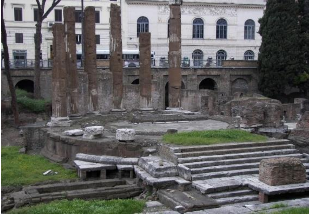
Görsel 2.6. Campus Martius, Largo Argentina'da bulunan Fortuna Huiusce Dei tapınağının kalıntıları.

Tanrıça Fortuna'ya ait olduğu düşünülen en erken heykel parçaları Q. Lutatius Catulus'un barbarlara karşı kazandığı zafer sonrası adadığı tapınakta ele geçirilmiştir. Yaşlı Plinius da Catulus'un tanrıçaya heykeller adadığını ve bunların tapınakta bulunduğunu aktarmaktadır. 193 Roma'daki Largo Argentina'daki Fortuna Huiusce Diei Tapınağı'nın kalıntılarının altında, muhtemelen yukarıda sözü edilen külte ait devasa boyutlarda akrolitik 194 bir heykelin parçaları ele geçirilmiştir (Görsel 2.7). 195