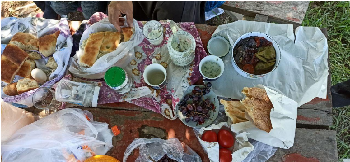
Şekil 7. Mevsimlik tarım işçisi kadınların öğle yemeği, Astara, Azerbaycan, Ağustos 2022