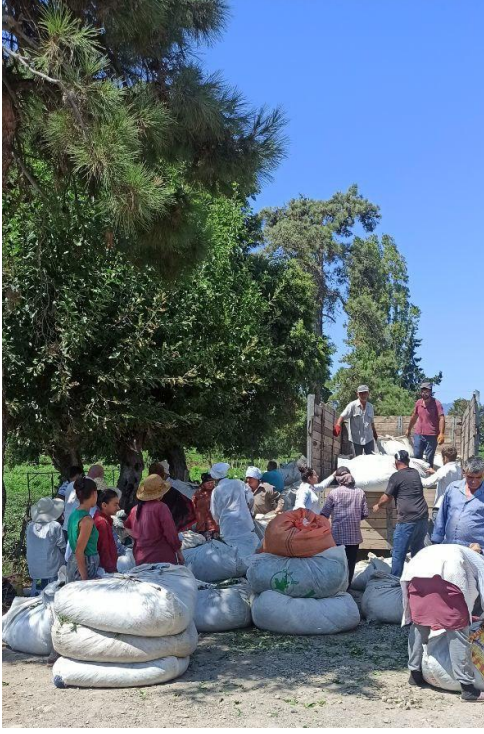
Şekil 4. İşçi kadınların çay yapraklarını tartıda tartma süreci, Astara, Azerbaycan, Ağustos 2022