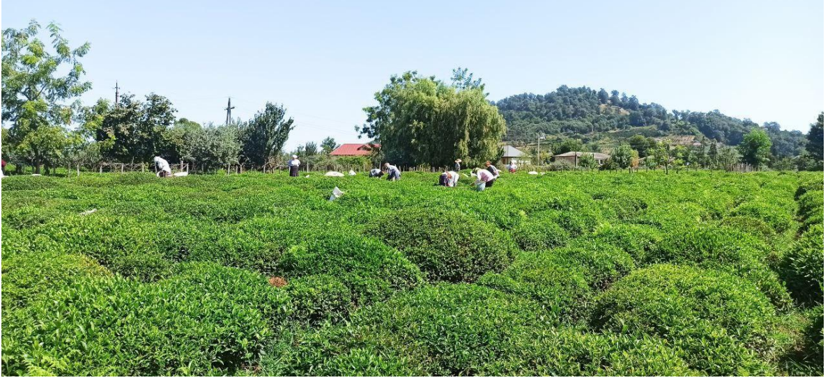
Şekil 1. Çalışan mevsimlik tarım işçisi kadınların uzaktan görüntüsü, Astara, Azerbaycan, Ağustos 2022