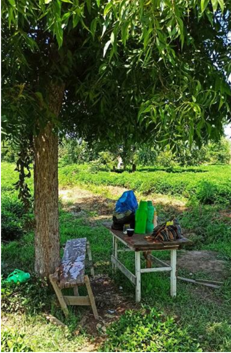
Şekil 5. Öğle arasında dinlenme mekanı, Astara, Azerbaycan, Ağustos 2022