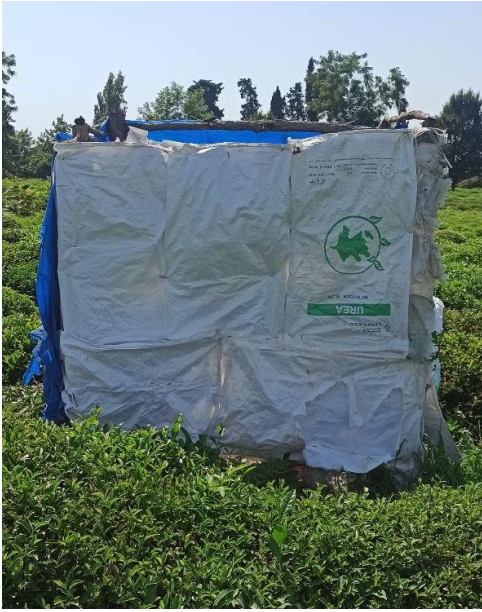
Şekil 8. Çalışma alanında bulunan tuvaletin önden ve yandan görüntüsü, Astara, Azerbaycan, Ağustos 2022