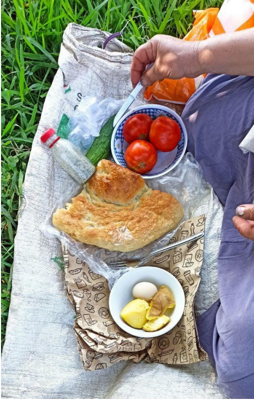
Şekil 6. Mevsimlik tarım işçisi kadının öğle yemeği, Astara, Azerbaycan, Ağustos 2022