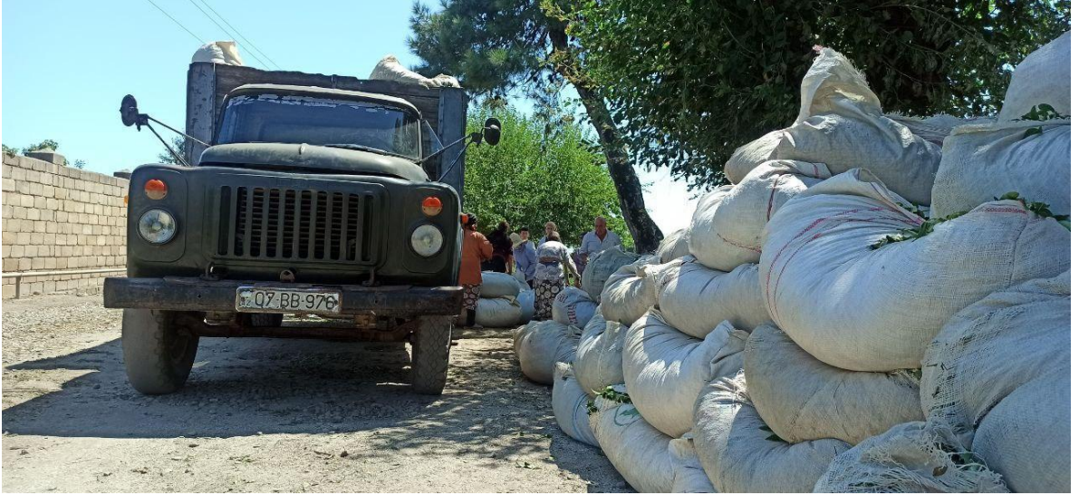
Şekil 2. Toplanan çay yapraklarının teslimi, Astara, Azerbaycan, Ağustos 2022