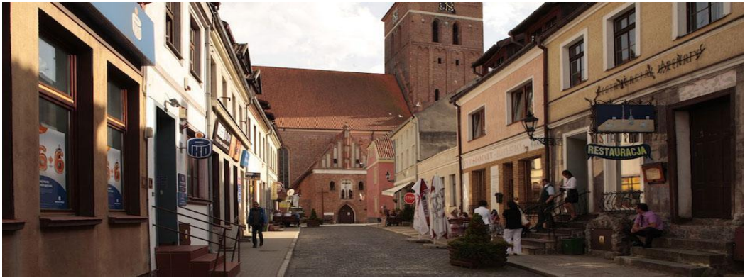
Görsel 2.4. Reszel tarihi sokaklarından bir görüntü( http://www.cittaslow.org/network/reszel , Erişim Tarihi: 25.09.2018)