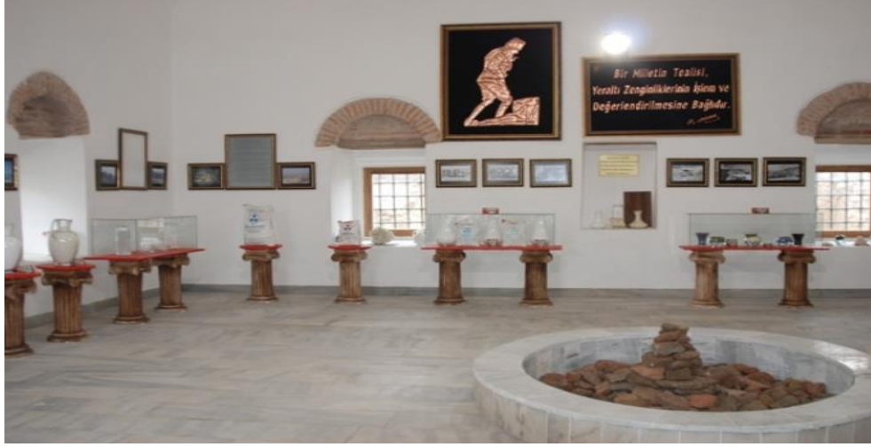
Görsel 3.8. Bor ve Etnografya Müzesi, https://www.kulturportali.gov.tr/turkiye/eskisehir , (Erişim Tarihi: 11.10.2018)

ile ilgili bilgiler, açık ocak maketi ve bordan üretilen sanayi ürünleri yer almakla birlikte, eski ev eşyaları, tarım aletleri ile el sanatları ürünleri de ziyaretçilere sergilenmektedir. 48