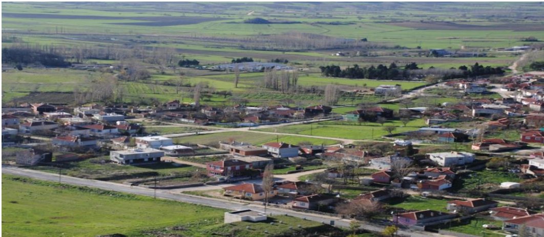
Görsel 2.17. Kuş bakışı Vize ilçesi, Kırklareli, ( http://www.vize.bel.tr/Fgs-1-Kus-Bakisi-Vize-48.html , Erişim Tarihi: 10.09.2018)