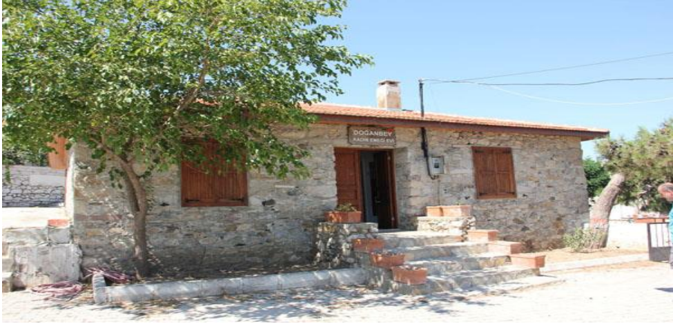
Görsel 2.12. Doğanbey Kadın Emeği Evi