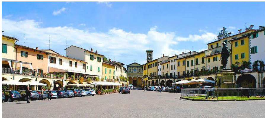
Görsel 2.1. Greve in Chianti şehri, çiftlik evleri ( https://www.greve-in-chianti.com/ ,Erişim Tarihi: 29.08.2018)