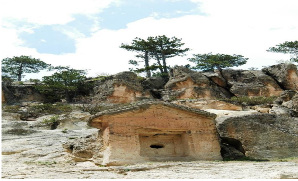
Görsel 3.5. Bahşeyiş Anıtı