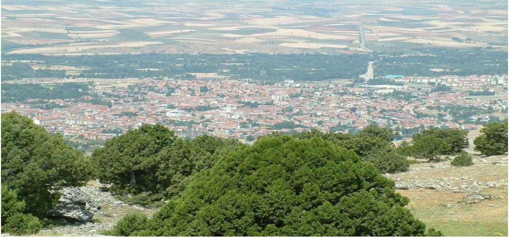
Görsel 2.18. Yalvaç ilçesi, Sakarya, ( http://www.ispartakulturturizm.gov.tr/TR,165541/yalvac.html , Erişim Tarihi: 10.09.2018)