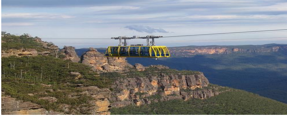
Görsel 2.7. Teleferik manzarası, Katoomba ( https://www.australiaforvisitors.com/katoomba.. ) , Erişim Tarihi: 22.09.2018)