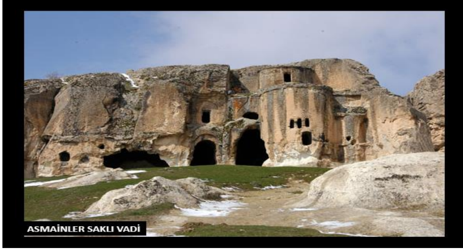
Görsel 3.7. Asmainler Saklı Vadi , http://seyitgaziturizmi.gov.tr/turkish/pages/3 , (Erişim Tarihi: 10.10.2018)