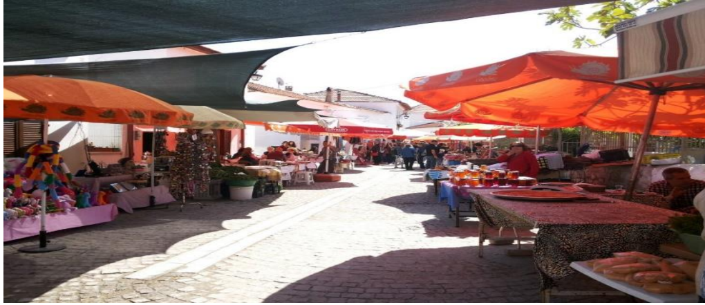
Görsel 2.11. Sığacık Pazarı, Seferihisar http://www.sigacikpazari.com/sigacikkaleici.html#! Erişim Tarihi: 22.09.2018)