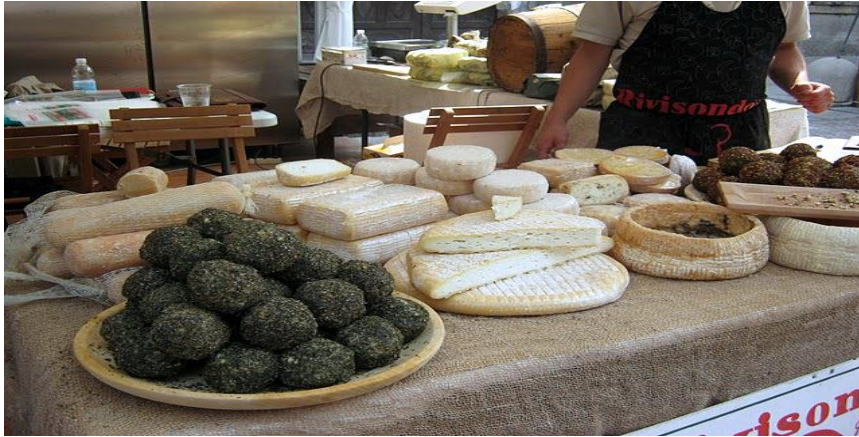
Görsel 2.2. Bra şehrinin ünlü peynirleri, peynir festivalinden bir görüntü ( https://www.formaggiokitchen.com... ), Erişim Tarihi: 29.08.2018)