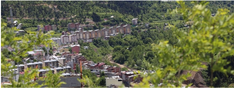
Görsel 2.14. Şavşat ilçesi, Artvin, ( http://savsat.bel.tr/ , Erişim Tarihi: 07.09.2018)