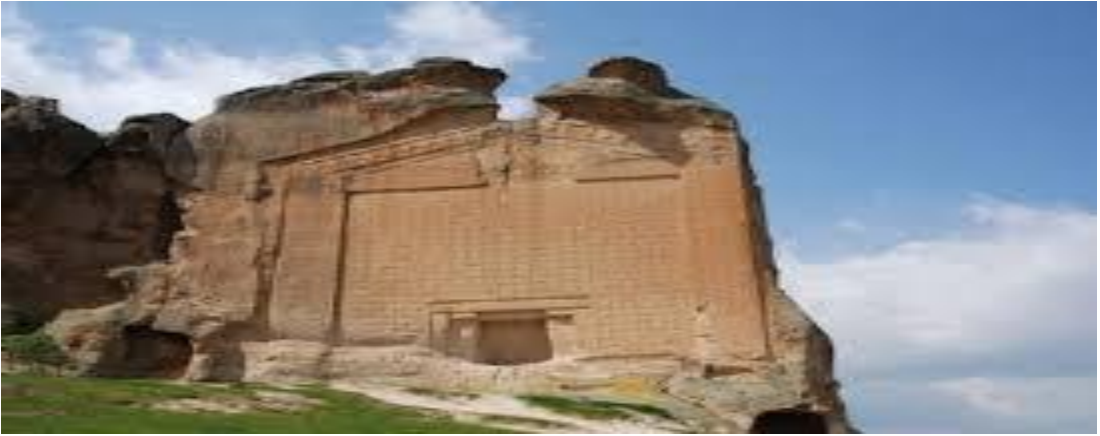
Görsel 3.3. Midas Anıtı, https://www.kulturportali.gov.tr/turkiye/eskisehir/gezilecekyer/midas-aniti , (Erişim Tarihi: 10.10.2018)