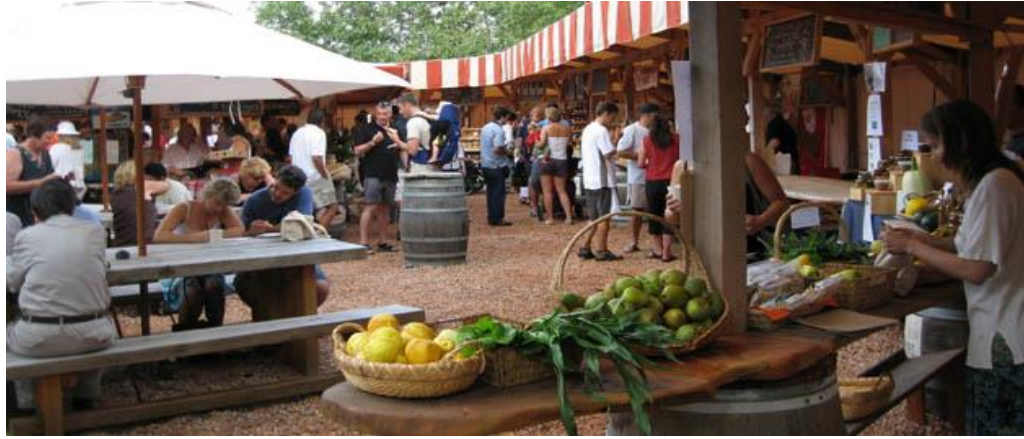
Görsel 2.5. Matakana pazarı, ( http://www.riversidematakana.co.nz... ), Erişim Tarihi: 22.09.2018)

Kasaba halkı her cumartesi günü kurulan pazarda yerli üretimi desteklemek ve yerel kalkınmayı sağlamak adına el sanatlarını, motifleri, yerli ürünleri alıp satarak aynı zamanda doğal ve organik meyve sebzeleri, su ürünlerini, yerli şarapları turistlere tanıtmaya yardımcıdır.