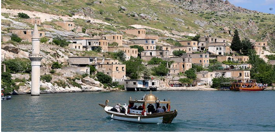
Görsel 2.15. Batık kent, Halfeti, Urfa ( https://www.aa.com.tr/tr/yasam/sakin-sehir-halfeti.. )Erişim Tarihi: 07.09.2018)

İlçenin bir bölümün sular altında kalmasıyla birlikte “batık kent” olarak da ifade edilen Halfeti, turistler açısından büyük ilgi görmekte, sahip olduğu yerel dokuları, tarihi değerleri, barındırdığı taşan evleri ile sakin şehir ile ifade edilen yerel kimliği ortaya çıkarma ve koruma olgusuna fazlasıyla sahip olmaktadır.