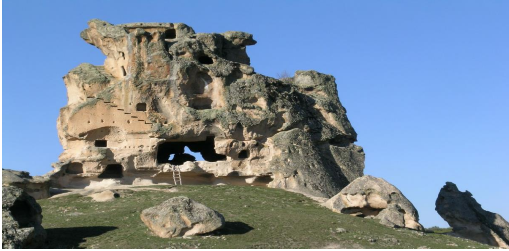
Görsel 3.4. Doğanlıkale

Seyitgazi ilçesinin Burhaniye (Çukurca) köyündedir. Kayanın üst kısmında bulunan bir kaya “doğan başı”na benzetildiğinden dolayı ismi Doğanlıkale olmuştur. Kayanın içi Frigler zamanında oyulmuş, Roma ve Bizans döneminde ilavelerle kullanılmıştır. Çok sayıda oyma mezar ve geçit bulunan kale yedi kattan oluşmakta, bu katlarda ise odalar bulunmaktadır. Katlar arasında geçiş kaya merdivenleriyle sağlanmakta ve depo olarak kullanılan mekânları dikkat çekmektedir. 44