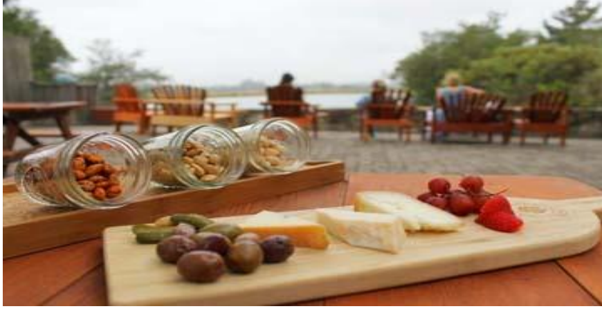
Görsel 2.6. Sonoma şehri ünlü yiyecekleri ( https://www.sonomacounty.com/. ), Erişim Tarihi: 22.09.2018)

kez 1821’de başlamış ve şarap üretiminin temelleri ise 1832’de atılmıştır. Şaraplarının yanında zeytinyağı ve peynirleriyle de ünlü bir kenttir (Atlas, 2015, s.54-55).