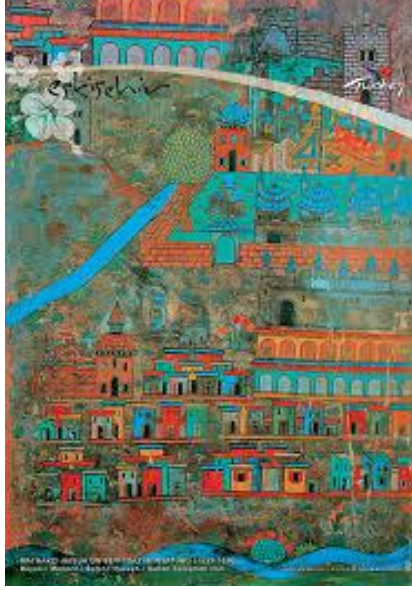
Görsel 3.1. Matrakçı Nasuh Efendi'nin 1533-1536 yıllarında Seyitgazi'nin genel görünümünü resmettiği minyatür

Yine Evliya Çelebi ise Seyahatnamesi'nde Seyitgazi'ye yer vermiş, Seyyid Battal Gazi'nin ilçede gömülü olduğundan bahsetmiştir. 38 Tarihi dokusuyla, birçok medeniyete ev sahipliği yapmış, birçok uygarlıkların önemli merkezi olmuş olan Seyitgazi, kültür turizmine güçlü tarihi yapısı ve sahip olduğu zenginliklerle önemli ölçüde avantaj sağlamaktadır. İlçede taşınmaz kültür varlıkları olarak belirlenen önemli yapılar bulunmaktadır. Seyyid Battal Gazi Külliyesi, Midas Anıtı, Doğanlıkale, Bahşeyiş Anıtı, Aslanlı Mağbet, Asmainler Saklı Vadi, Gerdekkaya Mezar Anıtı, Sücattin-i Veli Türbe ve Külliyesi, Üryan Baba, Melikgazi Türbesi ve Zahran Vadisi bu değerli kültür varlıklarındandır. Bu önemli ve değerli tarihi dokuların hepsinin ayrı değerlere sahip olması yanında kalesi, kervansarayı gibi daha birçok tarihi yapılarıyla kültür ve inanç turizminin örneklerini vermektedir.