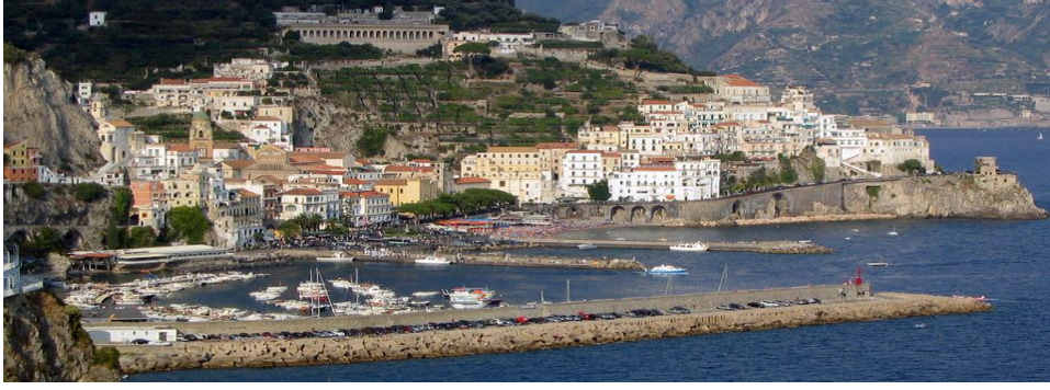
Görsel 2.3. Sahil kasabası olarak ifade edilen Amalfi ( http://www.cittaslow.org/network/amalfi , Erişim Tarihi:29.08.2018)