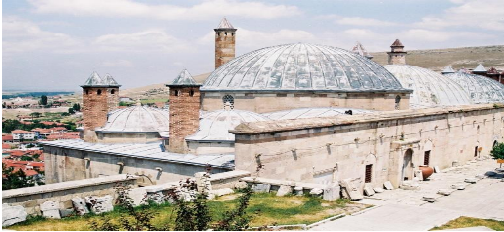
Görsel 3.2. Seyyid Battal Gazi Külliyesi, ( http://www.eskisehirkulturturizm.gov.tr/... ), (Erişim Tarihi: 10.10.2018)

bölümler eklenmiştir (1511-1517). Külliyyede ayrıca Ümmühan Hatun, Çoban Baba, Ayni Ana, Mihaloğlu Ahmet ve Mehmet beylerin türbelerinin yanında kral kızı ve aynı zamanda Battal Gazi'nin de eşi olan Elenora'nın mezarı ve kesikbaşlar odası gibi bölümler vardır. 39 Külliyyenin ortasında dikdörtgen planlı bir medrese bulunmaktadır. Seyyid Battal Gazi Medresesi olarak bilinen bu medrese alışılagelenin dışında biraz çarpık ve üzeri kubbe, yanları da tonoz örtülüdür. Çevresindeki imaret ve hankâh ile Bektaşî dergâhı özelliklerini taşımaktadır. 40 Üçler Tepesi'nde bulunan Külliye'nin bölümlerinden biri de Seyyid Battal Gazi Cami olup; bu cami Gıyaseddin Keyhüsrev zamanında XIII. Yüzyıl başlarında yapılmış, Sultan II. Bayezid dönemi 1511 yılında onarılmıştır. 41 Külliyyenin derslane ve müderris odalarında Kültür Bakanlığı tarafından kurulan Seyitgazi Müzesi 1966 yılında açılmış, 1970 yılında yeniden düzenlenmiştir. Müzede sergilenen eserler arasında Roma döneminde yapılan Herakles Heykeli, pişmiş toprak eserler, çeşitli yöredeki antik kentlere ait mimari parçalar, mermer heykelcikler bulunmaktadır. 42