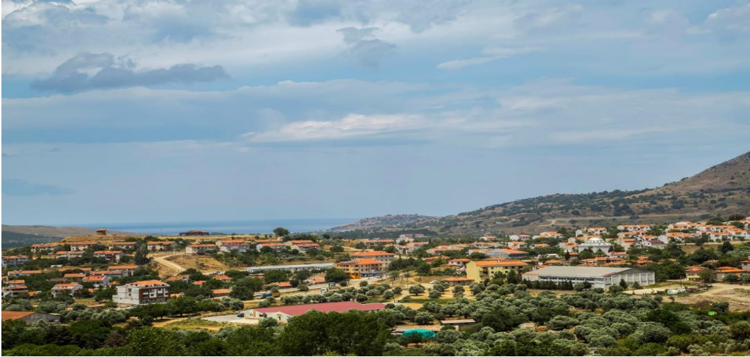
Görsel 2.16. Gökçeada ilçesi, Çanakkale, ( http://www.gokceada.bel.tr/altsayfa.php?sayfam=25 , Erişim Tarihi: 07.09.2018)

Türkiye'nin en batı noktasında yer alan ve en büyük adası olan Gökçeada, nostaljik evleri, doğal yaşamı, organik ürünleri ve alternatif spor olanakları ile son yıllarda önemli bir turizm merkezi haline gelmiştir. 2002 yılından bu yana ada içerisinde gerçekleştirilen organik tarım faaliyetleri ile özellikle 2008 yılından bu yana gerçekleştirilen tarım turizmi uygulamaları sayesinde misafirlerine eşsiz bir doğal ortam sunan Gökçeada, 2011 yılı haziran ayında almış olduğu Cittaslow ünvanı ile dünyanın ilk ve tek sakin adası olmuştur. (Cittaslow, Gökçeada, 2018).