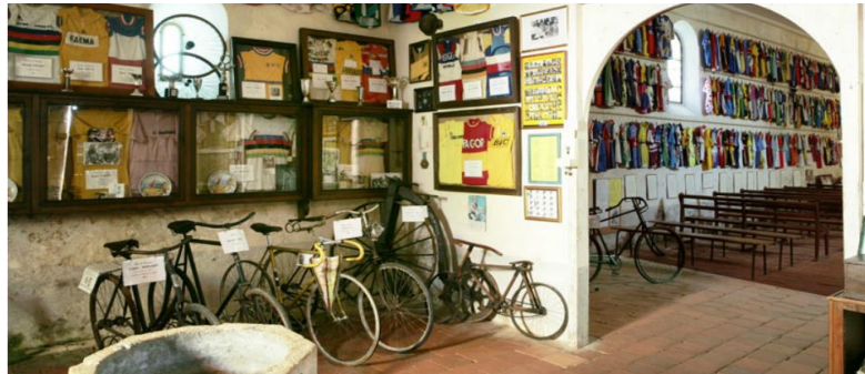
Görsel 2.8. Labastide d'Armagnac şehrinden bisikletlerle dolu bir dükkân ( http://www.cittaslow.org/network/labastide-darmagnac , Erişim Tarihi: 29.08.2018)

Temel yerli üretimleri yanında ekonomisi büyük ölçüde tarıma dayanmakta, üzüm bağlarıyla tanınmaktadır. Eski demiryolu hattından dönüştürülerek yapılan yayalar ve bisikletlilerle sınırlı eko-turistik parkur olarak ifade edilen Yeşil Şerit (La Voie Verte)'e sahiptir. Ekim ayının son haftası kutlanan L'Armagnac en Fête sırasında, yerli üreticiler Armagnac bölgesinde yetişen ürünlerini getirip kasaba meydanında sergilemektedir (Atlas, 2015, s. 64). Ayrıca yerel yemekler, şaraplar, aperatiflerle birlikte yaz mevsiminde ise el sanatları, antikalar, mutfak marketleri, sanatsal sergiler, konserler, tiyatro gösteri düzenlenmektedir (Cittaslow, Labastide D'Armagnac, 2018).