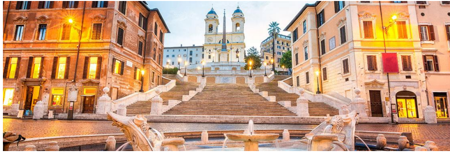
Görsel 1.2. Piazza di Spagna https://www.rome.net/piazza-di-spagna (Erişim Tarihi: 12.09.2018)

Bir fast food zincirinin (McDonalds), şehrin kültürel ve tarihî esintisini ifade eden Roma- Piazza di Spagna (İspanyol Meydanı) 4 'da açılarak, bu esintiyi arka planda ve tek tipleşmeye mahkûm bırakacağı düşüncesine karşıt 1986'da gerçekleştirilen protesto aracılığıyla zemini hazırlanmıştır. Önderliği, Carlo Petrini tarafından yapılan bu protestoda amaç; bu mekânın meydanın estetiğini bozduğunu ve İtalyan yemek ve beslenme kültürüne zarar verdiğini öne sürmektir (Sırım, 2012, s.121).