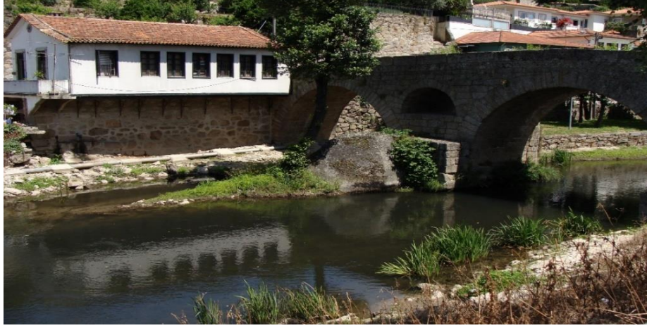
Görsel 2.9. Tarihi Roma Köprüsü, Vizela ( http://www.vizela.pt/?page_id=189 , Erişim Tarihi: 22.09.2018)

Doğal kaynaklar ve turizm açısından sınırsız sayılan Vizela kenti Portekiz'in en bilinen sakin şehirlerindedir. Turizm açısından Vizela, Roma halkının bıraktığı miras olarak görülen hidroterapi uygulamasıyla yakından ilişkili olarak termal turizm açısından fizikî rahatsızlıklarda sıklıkla tercih edilen bir bölgedir.