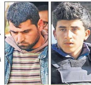
Suriyeli iki katil tutuklandı.