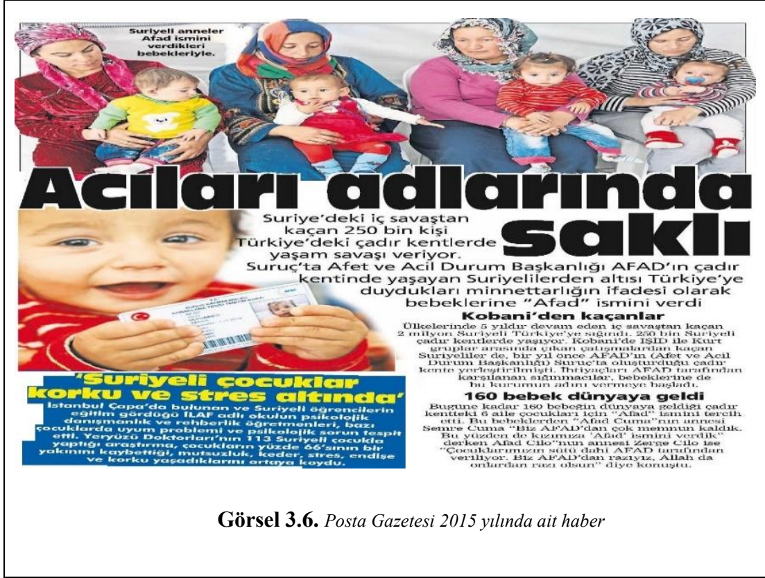
Görsel 3.6. Posta Gazetesi 2015 yılında ait haber

Posta ve Hürriyet gazetelerinde 2015 yılında yayınlanan ve çadır kentte doğan Suriyeli bebeklere AFAD isminin verilmesini konu edinen haberlerde de benzer bir durum görülmektedir. Her iki gazetede de sığınmacıların minnettarlık ifadeleri yer almaktadır. Posta Gazetesi'nde AFAD'a duyulan memnuniyet bebeğine bu ismi veren bir sığınmacının şu sözleriyle anlatılmaktadır: “Çocuklarımızın sütü dahi AFAD tarafından veriliyor. Biz AFAD'tan razıyız, Allah da onlardan razı olsun.”. Sığınmacının son cümlesinde görülebileceği üzere metinlerde dini içerikli övgüler de yer almaktadır. Aynı konuyu işleyen Hürriyet Gazetesi'nde ise yer verilen sığınmacı görüşü şu şekildedir: “İŞİD'lilerden kaçtık, Türkiye bize kucak açtı. Türkiye olmasaydı bugün hayatta bile olamazdık. Türkiye'ye, AFAD'a karşı minnetimizi göstermek için kızıma Afad ismi verdim.”