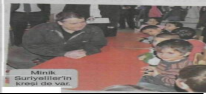
Minik Suriyelilerin kresli de var.