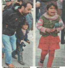
Polisler çocuklar arasında kovale maca yazandı.