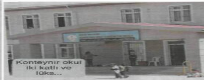
Konteynir okul iki katlı ve lüks...

Suriye'deki iç savaştan kaçarak Türkiye'ye sığınan Suriyeliler, ülkelerinde böyle bir eğitim imkanı sunulmadığını söyledi. Sıralarda 2'şer 2'şer oturan mülteci öğrenciler bilgisayarlı eğitim görüyor. Onlara Arapça, İngilizce ve Türkçe dersleri veriliyor. Çocukların sınıfları son derece lüks. Okul tahtası ve sıralar kolej düzeyinde. Türkiye'deki çoğu çocuğun yok-sun olduğu birçok imkanın Suriyeli çocuklara verilmesi içler acısı... Yavuz ALATAN/ANKARA