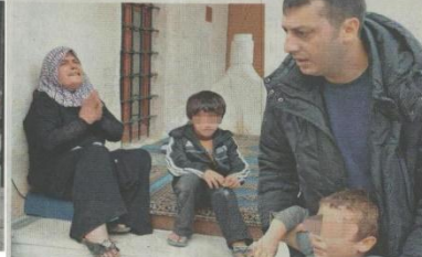
Camiye sığınan dilenciler polislerle uzun süre yalvardı.

Antalya Valisi Muammer Türker kentte 10 bin Suriyeli olduğunu belirterek, "Bin 500'üne kenti terk edin talimatı verdik" dedi