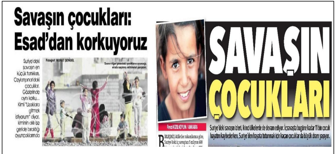
Görsel 3.1. 2012 Sabah (solda) ve 2015 Hürriyet (sağda) gazetelerinde yayınlanan haberler “Savaşın çocukları” ifadesinin başlıklarda kullanımına örnektir.

Yukarıdaki ifadelerde görüldüğü gibi Suriyeli çocukların savaşın kurbanları olarak sunulmaları incelenen her gazete ve yıl için geçerlidir. Bu temsil şekli, medyanın savaş