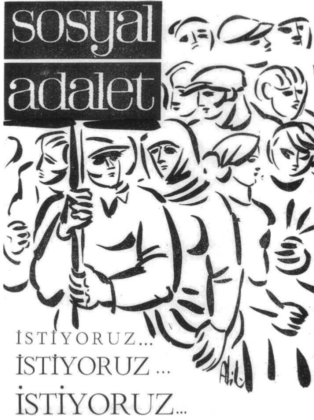
Görsel 4.1.2.7. Abidin Dino Deseni. Sosyal Adalet 18. Sayı. Eylül 1965

Sosyal Adalet dergisinin 13. Sayısının arka kapağındaki desende ise yüzler ve bedenler belirgindir. Kalabalık içerisindeki köylü, işçi, öğrenci, muhafazakâr ve modern kadın olmak üzere TİP'in siyasal ideolojisini anlatma ve benimsetmeye çalıştığı karma bir emekçi topluluğudur. Derginin iç sayfalarındaki desenlerde pankartlarda TİP taşıyan figürler, bu desende sosyal adalet yazan bir pankart taşımaktadır. Pankartın hemen altına denk gelecek şekilde de büyük harflerle ve puntosu gittikçe artan, üç kez yinelenen İSTİYORUZ ifadesine yer verilmektedir.