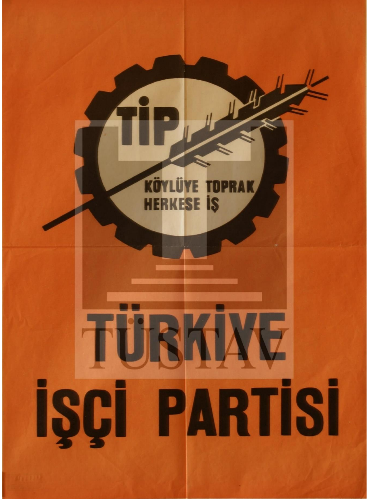
Görsel 4.6. TİP Afişi. TÜSTAV veritabanı. Afişler kataloğu