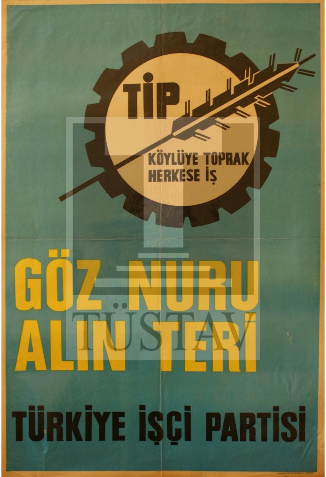
Görsel 4.7. TİP Afişi. TÜSTAV veritabanı. Afişler kataloğu