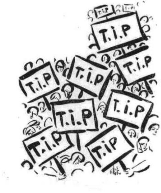
Görsel 4.1.2.6. Abidin Dino Deseni. Sosyal Adalet 18. Sayı. Eylül 1965