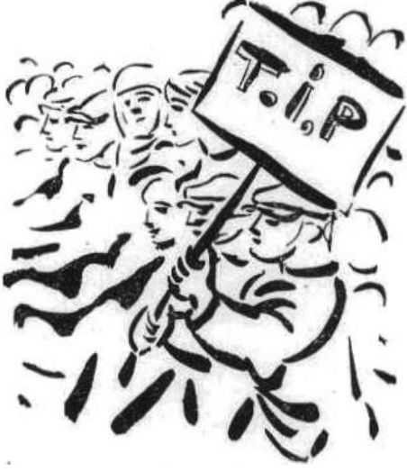
Görsel 4.1.2.4. Abidin Dino Deseni. Sosyal Adalet 18. sayı. Eylül 1965

Sosyal Adalet dergisinde (s.45) sayfasında sağ üstte yer alan desen soldan-sağa okumaya alışkın algı için hareketi kavramda zorlanmayacaktır. İlk bakışta desende belirgin olan TİP pankartı ve onu iki eliyle sıkıca kavramış, bedeni ileri doğru yönelmiş kasketli insan figürüdür. Pankartın altında yedi belirgin insan yüzü vardır ancak desendeki leke dağılımı çok daha kalabalık bir insan topluluğunun yürüyüşünü düşündürmektedir. Abidin Dino tarafından kalabalıkların resmedildiği desende, başı kapalı ve saçları açık olmak üzere muhafazakâr ve modern kesimleri temsil eden iki ayrı kadın, genç bir erkek, kasketi düzgün ve düzgün olmayan erkekler -köylü ve işçi temsilcisi olarak- yer almakta ve gülen yüzleri ile TİP bayrağı ile ortak ideolojileri doğrultusunda -gelecekleri için- yürümektedirler.