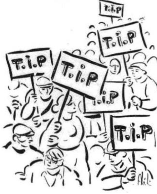
Görsel 4.1.2.5. Abidin Dino Görseli. Sosyal Adalet 18. sayı. Eylül 1965

Sosyal Adalet'in 18. sayısının 46. sayfasında sağ altta yer alan Abidin Dino deseninde aydın, işçi, köylü, kentli, köylü olmak üzere toplumun tüm emekçileri yer almaktadır. En önde yakalı gömlek ve ceketi ile memur (veya aydın), arkasında topuz ve elbisesi ile kadın (ev hanımı belki de) ile kasketi ile köylü, bareti ile işçi ve arkalarda kimlerin olduğu tam bilinmeyen ancak daha önceki desenlere kıyasla kalabalıkların gittikçe arttığı dolayısıyla yine TİP bayrağı altında sayıları artarak çoğalan bir halk resmedilmiştir.