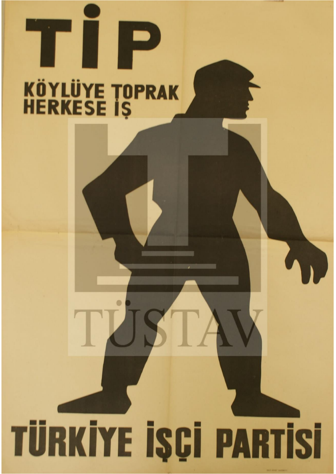
Görsel 4.8. TİP Afişi ve Yeni Logosu. TÜSTAV veritabanı. Afişler kataloğu