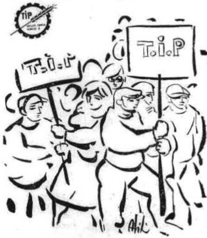
Görsel 4.1.2.3. Abidin Dino Deseni. Sosyal Adalet 18. sayı. Eylül 1965

Sosyal Adalet'te (s.44) sayfanın sağ altında yer alan bu desende altı belirgin insan vardır. Bunların dördünün ayaklar dışında neredeyse tam bedeni çizilmiş; iki tanesi de kadın oldukları anlaşılan belirgin kafa çizimleridir.