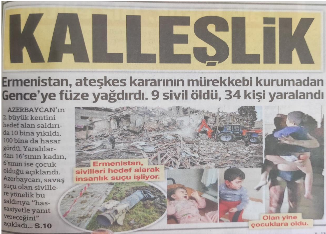
Görsel. 3.1. Ermenistan'ın Gence'ye füze saldırısı, Sözcü, 12 Ekim, 2020

Sözcü gazetesinde manşete çıkarılan tek haber Görsel 3.1'de yer alan ve Ermenistan'ın sivil vatandaşları hedef alan füze saldırısını konu edinen haber olmuştur. Bu haber "Kalleşlik" başlığı ile manşete çıkarılmış ve haberde Ermenistan'ın ateşkes kararına uymadan Azerbaycan'ın Gence şehrine füze saldırısı sonucunda 9 sivilin öldüğü, 6'sı çocuk olmak üzere 34 kişinin yaralandığı, 10 binanın yıkıldığı, 100 binanın ise hasar gördüğü ile ilgili bilgiler okurlara sunulmuştur.