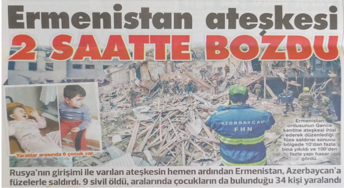
Görsel 3.3. Sivil yaşam yerlerinin bombalanması, Sözcü , 12 Ekim 2020

“Saldırıya maruz kalan yerleşim yerleri ve ya insanlar” (%15.8), “Askeri araç ve mühimmatlar” (%12.3) ve “Diğer yetkililer ve görevliler” (%11.4) kategorilerinde yer almaktadır. Bu fotoğraflarla savaşın insanlar üzerindeki etkileri, saldırıların sivil yerleşim alanlarını nasıl hedef aldığı ve çocukların savaşın mağdurları olduğu vurgulanmaktadır.