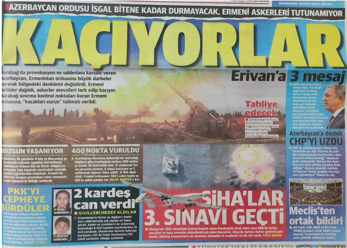
Görsel 3.2. Azerbaycan ordusunun saldırılara karşılık vermesi, Yeni Şafak, 29 Eylül 2020

“Büyük çöküş”, “Sonuçları ağır oldu”, “Kaçıyorlar”, “Karabağ kurtulana kadar” gibi ifadeler, çerçeveleme kuramının duygusal çerçeveleme yaklaşımını yansıtmaktadır. Bu tür ifadeler, haberin duygusal yönünü öne çıkartarak okuyucuların empati kurmasını ve haberin önemini daha yoğun bir şekilde hissetmelerini sağlamaktadır. Örneğin, “Büyük çöküş” ifadesi, çatışmaların olumsuz sonuçlarına vurgu yaparken, “Karabağ kurtulana kadar” ifadesi, mücadele ve direniş temasını işaret etmektedir. Bu tür duygusal ifadeler, okuyucuların haberlere daha duyarlı bir şekilde tepki vermelerini sağlayarak haberlerin etkisini artırmaktadır. “SİHA'lar 4 günde süpürdü” ifadesi, Türk Silahlı İHA'ların başarısını ve çatışmadaki etkinliğini vurgulayarak zafer temasını işaret etmektedir. “Kaçmasın diye zincire vuruluyor” ifadesi, düşmanın zor durumda olduğu ve savaşın seyrini değiştirebilecek olumlu gelişmeleri vurgulayarak direniş temasını yansıtmaktadır. “Cepheden kaçıyor sivilleri vuruyor” ifadesi ise, düşmanın zalim ve acımasız eylemlerini vurgulayarak mağduriyet temasını ön plana çıkarmaktadır. “28 Yıl sonra ezan sesleri” ifadesi ise, tarihi bir anı ve milletin zaferini simgeleyen duygusal bir tema sunmaktadır. Bundan başka “Çıkın yoksa pişman olacaksınız” ifadesi, düşmana