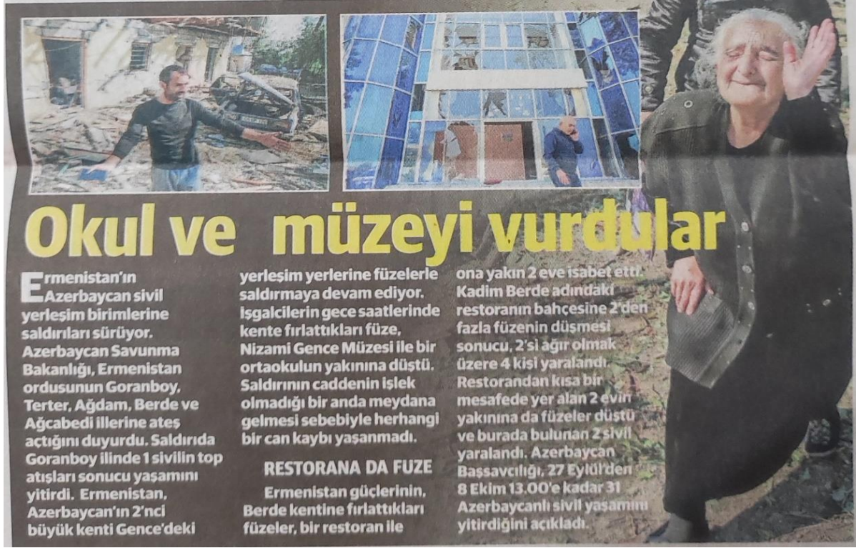
Görsel 3.4. Saldırıya maruz kalan sivil yaşam yerleri, Yeni Şafak, 9 Ekim 2020

Her iki gazetenin de fotoğraf seçimlerinde, haberlerin duygusal yönüne odaklandığı ve okuyucuların empati kurmasını sağlayacak fotoğraflara yer verdiği görülmektedir (Görsel 3.3 ve Görsel 3.4). Özellikle sivillerin ve çocukların savaşın mağduru olduğunu vurgulayan fotoğrafların kullanımı, haberlerin etkisini artırmak ve okuyucuların duygusal bir bağ kurmasını sağlamak amacıyla yapılmıştır. Ayrıca liderlerin ve diğer yetkililerin fotoğraflarının kullanımı ile haberlerin politik ve stratejik boyutunun ön plana çıkarılması hedeflenmiştir.