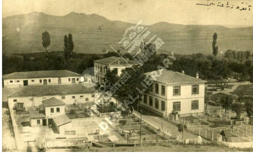
Görsel 5.6. Nümune Çiftliği

( https://libdigitalcollections.ku.edu.tr/digital/collection/FKA/id/3280/ )