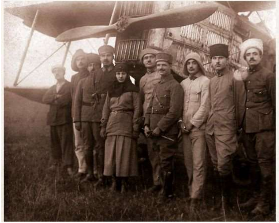
Görsel 5.5. Büyük Taarruz'dan önce Türk havacılarını ziyaret eden Halide Edib Cephne Tayyare Bölüğü Komutanı Yüzbaşı Fazıl Bey ile, 1922