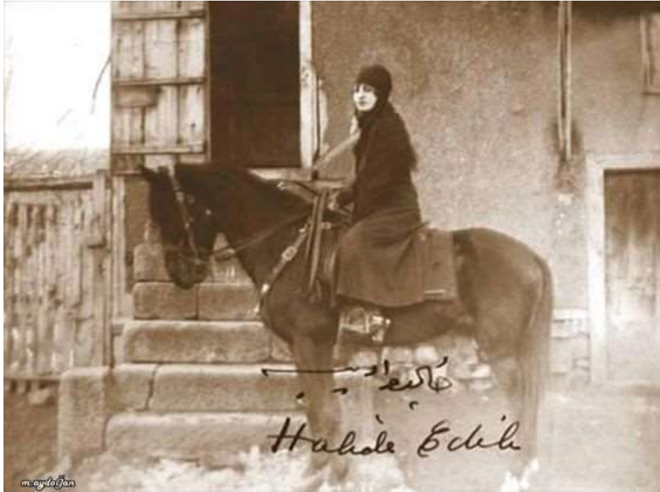
Görsel 5.4. Halide Edib ve atlarından biri

“...Kadife Hanım adlı, gayet güzel, sarı bir kedisi vardı. Bu mahlûk ona tamamiyle hâkimdi. Yavruladığı zaman, hepimize şerbet ikram eder, yavrulara karşı gerçek ve büyük bir sevgi gösterirdi... (s. 85)”