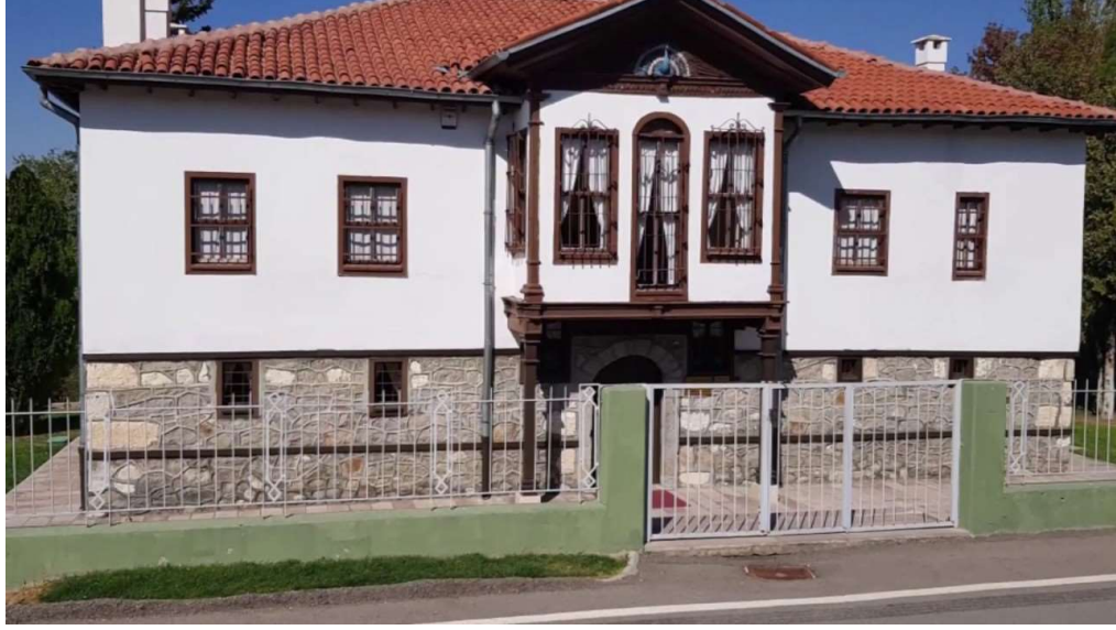
Görsel 5.2. Alagöz Karargâh Müzesi

https://www.kulturportali.gov.tr/turkiye/ankara/gezilecekyer/alagoz-karargah-muzesi