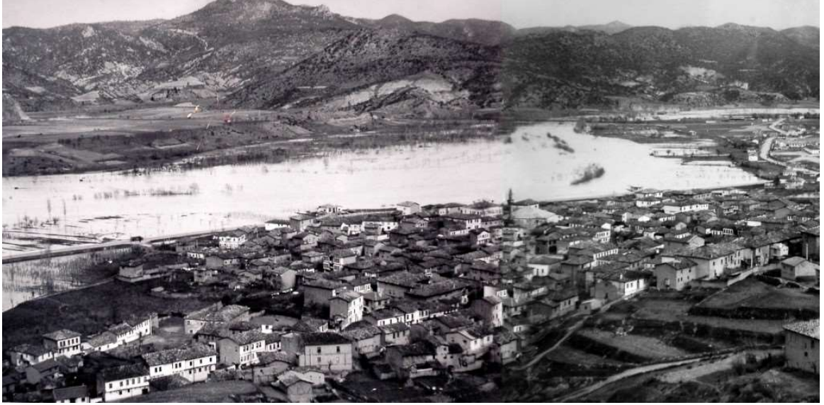
Görsel 5.1. Lefke'nin (Osmaneli) en eski resmi

Eskişehir'e ulaşmışlardır. Fakat güvenli olmadığı için burada durmadan Ankara'ya devam etmişlerdir.