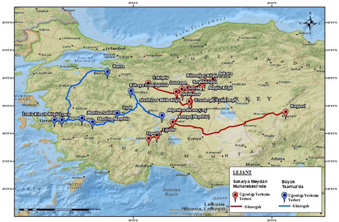
Harita 6.2. Anadolu'da Bulunduğu Yerler

Buradan sonra Anadolu'da Bulunduğu Yerlere ait güzergâh şu şekildedir; Eskişehir, Ankara/Polatlı/Duatepe, Sivrihisar, Kösebağ, Gecek, Aziziye, Beylikköprü, Ankara, Sivrihisar, Isparta/Eğirdir, Ankara, Kayseri/Akşehir, Afyonkarahisar, Dumlupınar, Uşak, Manisa/Alaşehir/Salihli, Nif (İzmir Kirazlı köyü), İzmir'dir. Bu yerler Harita 6.2.'de verilmiştir.