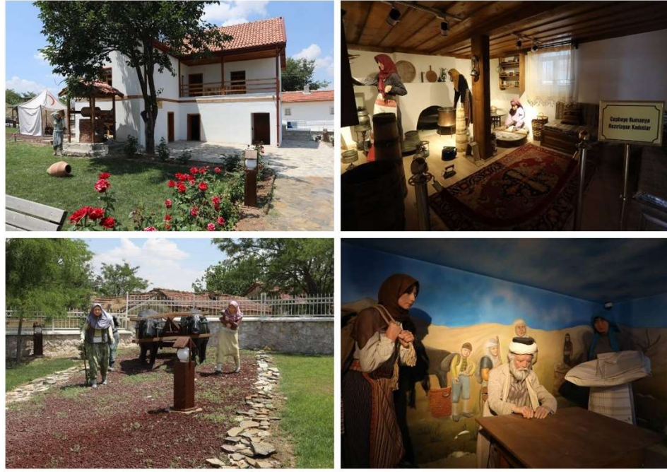
Görsel 5.3. Halide Edib Adivar ve Kadın Kahramanlar Müzesi

( https://bolge9.tarimorman.gov.tr/Menu/173/Halide-Edip-Adivar-Ve-Kadin-Kahramanlar-Muzesi )