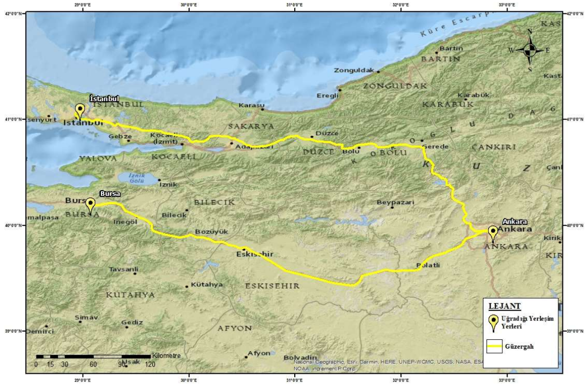
Harita 6.3. Eve Dönüş

Halide Edib'in dönüş yolculuğu Harita 6.3. Eve Dönüş'te şu şekilde verilmiştir;