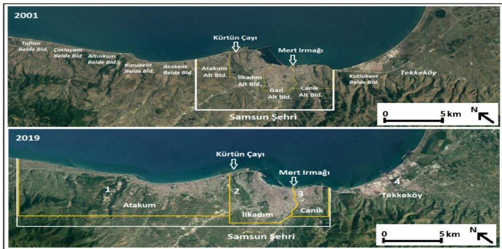
Görsel-2: Samsun’un Doğu ve Batı Yönündeki Değişimi (2001-2019).