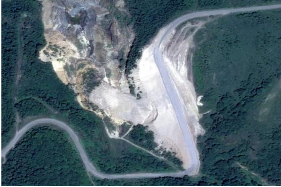
Görsel 7. Terter Şehrinin Çardaklı Köyünde Bulunan Doğal Maden Bölgesi Ermenistan tarafından yağmalandıktan sonra 155