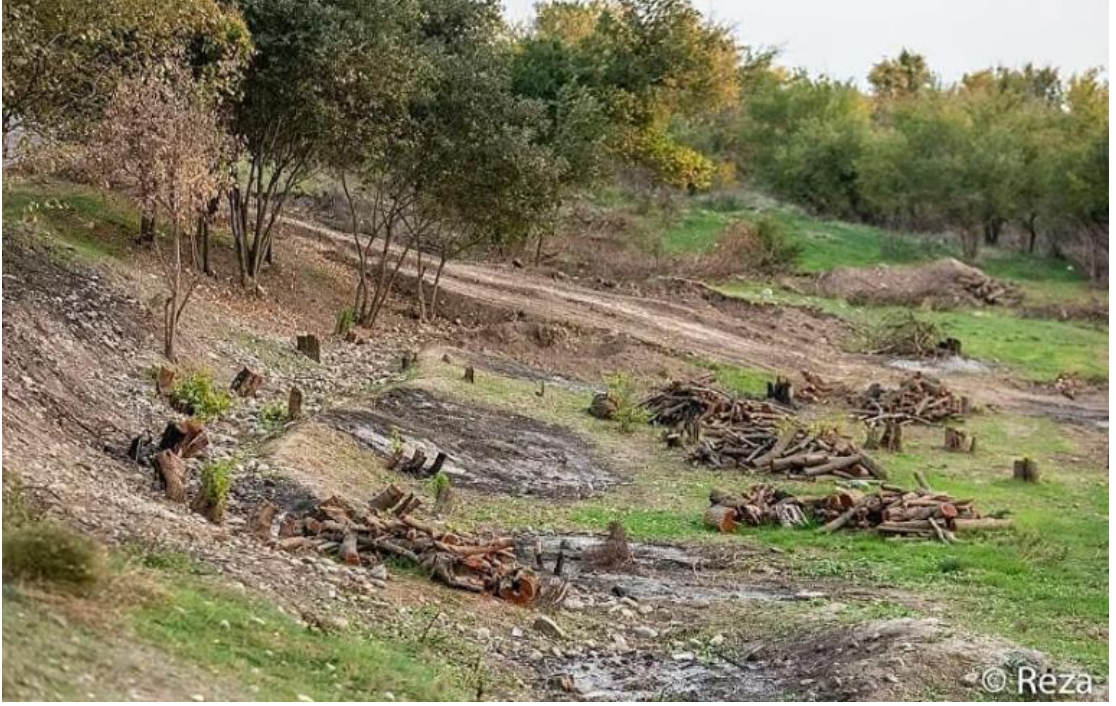
Görsel 5. Ermenistan Tarafından Karabağ Bölgesinde Kesilerek Yok Edilen Ormanlar 153