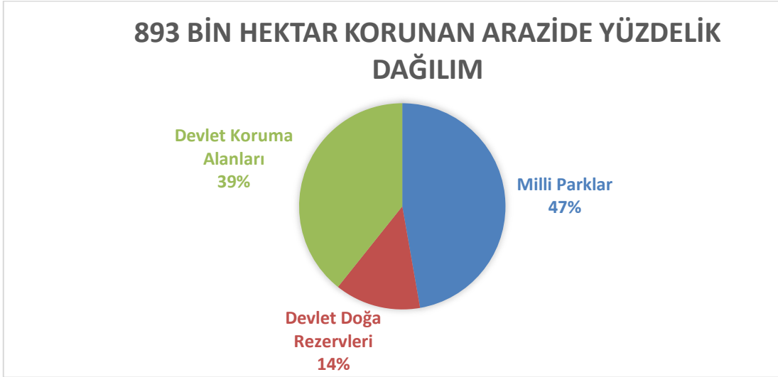
Grafik 1. 893 Bin Hektar Korunan Arazide Yüzdeler Dağılımı