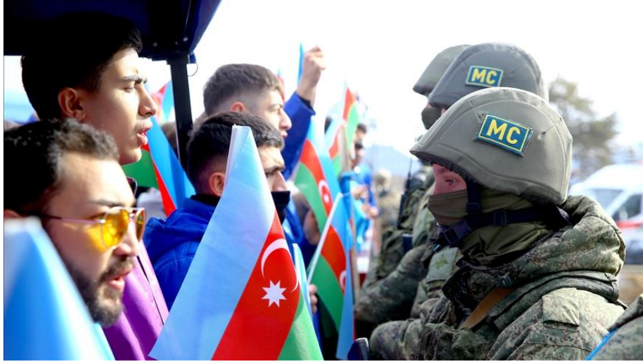
Görsel 2. Genç Gönüllü Aktivistler ve Çevreci STK Üyeleri Şuşa'da Bulunan Rus Barış Güçleri Önünde 150

olması ve Ermenistan tarafından yapılan bu ekolojik yıkımlara ses çıkarmamasıda ek olarak bu eylemin başlama sebeplerinden biridir.