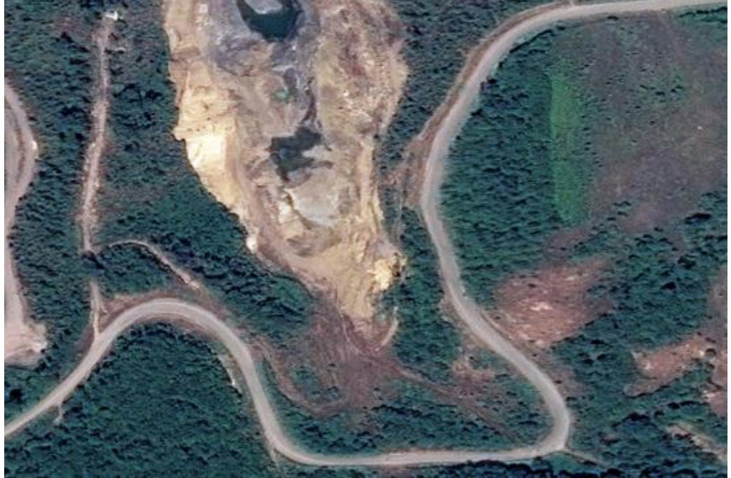
Görsel 6. Terter Şehrinin Çardaklı Köyünde Bulunan Doğal Maden Bölgesi Ermenistan tarafından yağmalanmadan önce 154