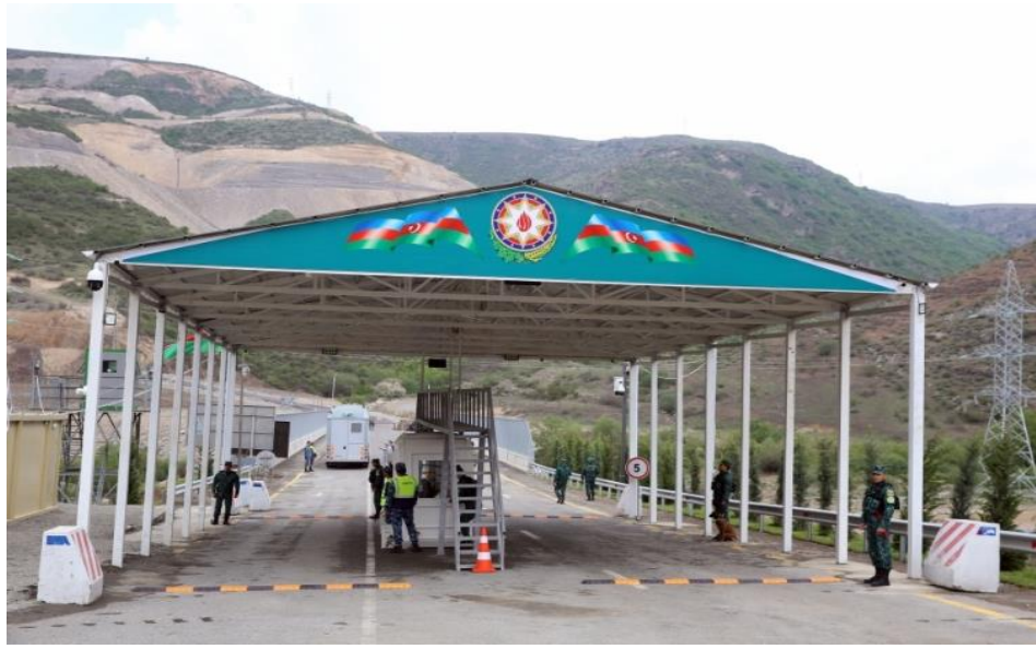
Görsel 9. Yapılan Eylem Sonrası Laçın Koridoru'nda Kurulan Sınır Kontrol Merkezi 158

türlü provakasyonun önüne geçilmiştir. Buda yapılan bu eylemdeki katılımcılar hedeflerine kısmen ulaştığını göstermektedir 157 .