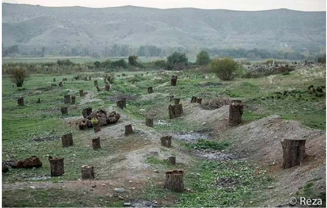
Görsel 4. Ermenistan Tarafından Karabağ Bölgesinde Kesilerek Yok Edilen Ormanlar 152