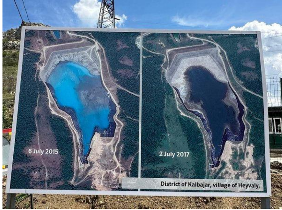
Görsel 3. İşgalden Kurtarılan Kelbecer Bölgesinin Heyvalı Köyünde Ermenistan'ın Yapmış Olduğu Ekolojik Vahşet 151 .