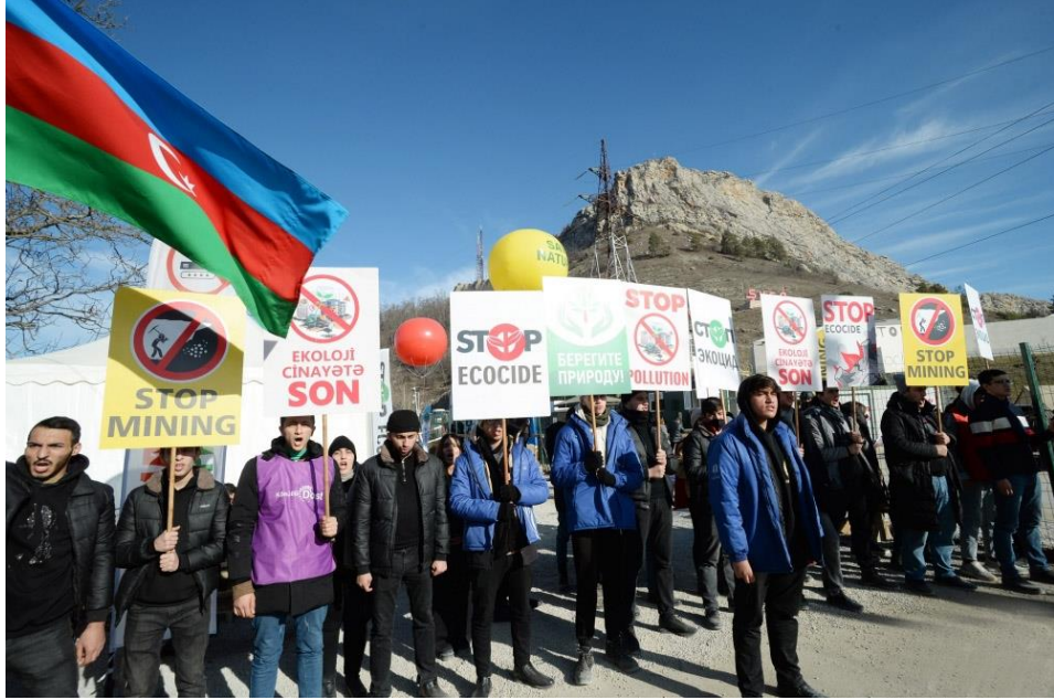
Görsel 1. Genç Gönüllüleri ve Çevreci STK üyeleri 149 .

12 Aralık 2022 tarihinden itibaren Azerbaycan'nın Karabağ bölgesinde Laçın-Hankendi yolunun Şuşa tarafından geçen kısmında, yani Laçın Koridoru'nda Ermenistan'nın Azerbaycan topraklarında yapılan izinsiz doğal kaynak çıkarmalarını ve işletmelerini, ek olarak gerçekleştirdikleri ekolojik yıkımlara karşı Azerbaycan çevre hakkını koruyan ve çevre sorunları ile ilgilenen STK'lar eylemler düzenlenmiştir. Bu tarihten itibaren Ermenistan'ın Karabağ'da yaşayan Ermeniler ile tek kara bağlantısı olan Laçın Koridoru 138 gün kapatılmıştır. Yapılan bu eylemler 138 gün aralıksız devam etmiştir.