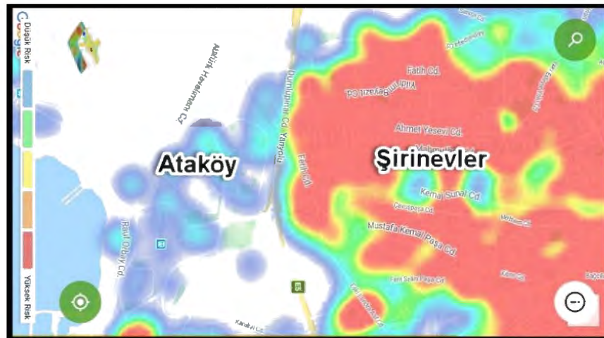
Görsel 1. Hayat Eve Sığar Uygulaması Görüntüsü (Çıtak, 2020)

Covid-19 pandemisi sırasında İstanbul'da birbirine komşu olan iki semt (Ataköy ve Şirinevler) ve o iki semtteki aktif koronavirüs vakalarının yoğunluğunu Sağlık Bakanlığı tarafından oluşturulan Hayat Eve Sığar uygulamasından görüntüleyebiliyordu.