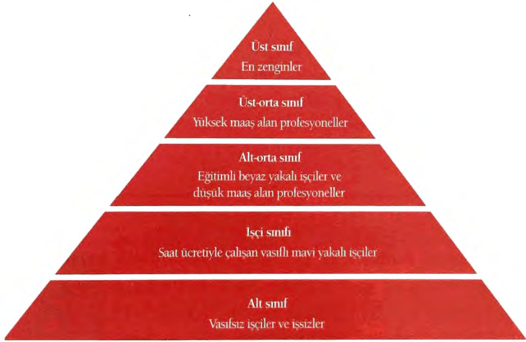
Şekil 1. Tabakalaşmanın Beşli Ayrımı

beyaz yakalılar orta tabakayı, düşük ücret karşılığında kol gücüne dayalı emeğini satan işçiler ise alt tabakayı oluşturmaktadır.